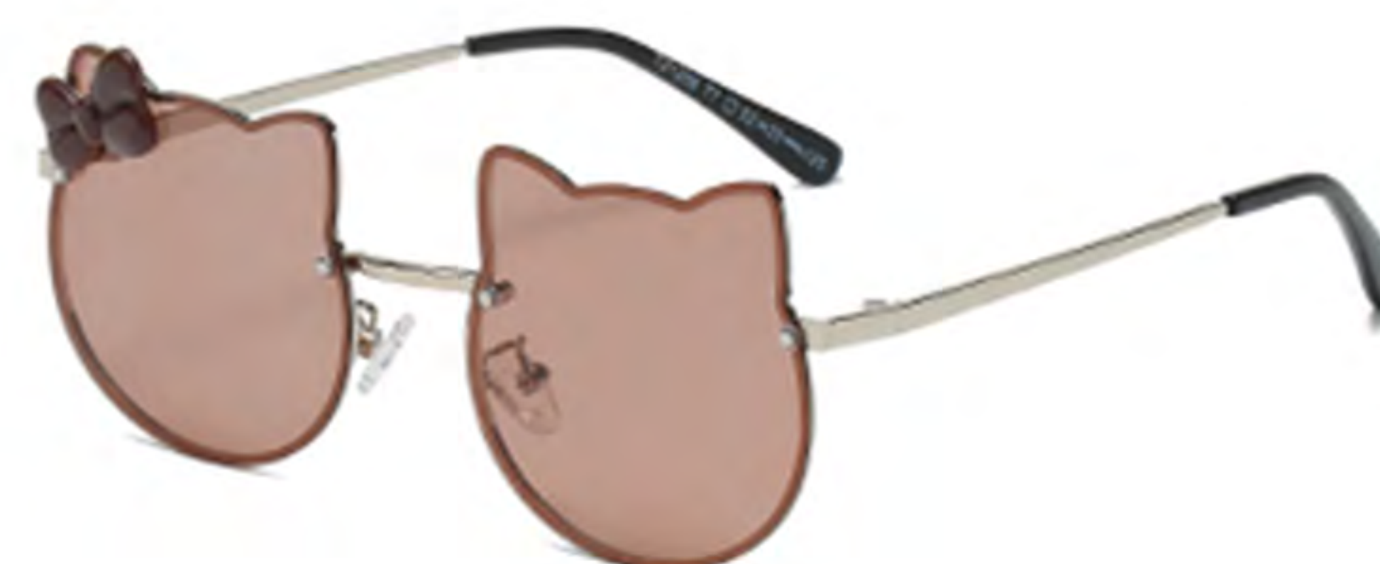
NO.3 T7 银框茶片