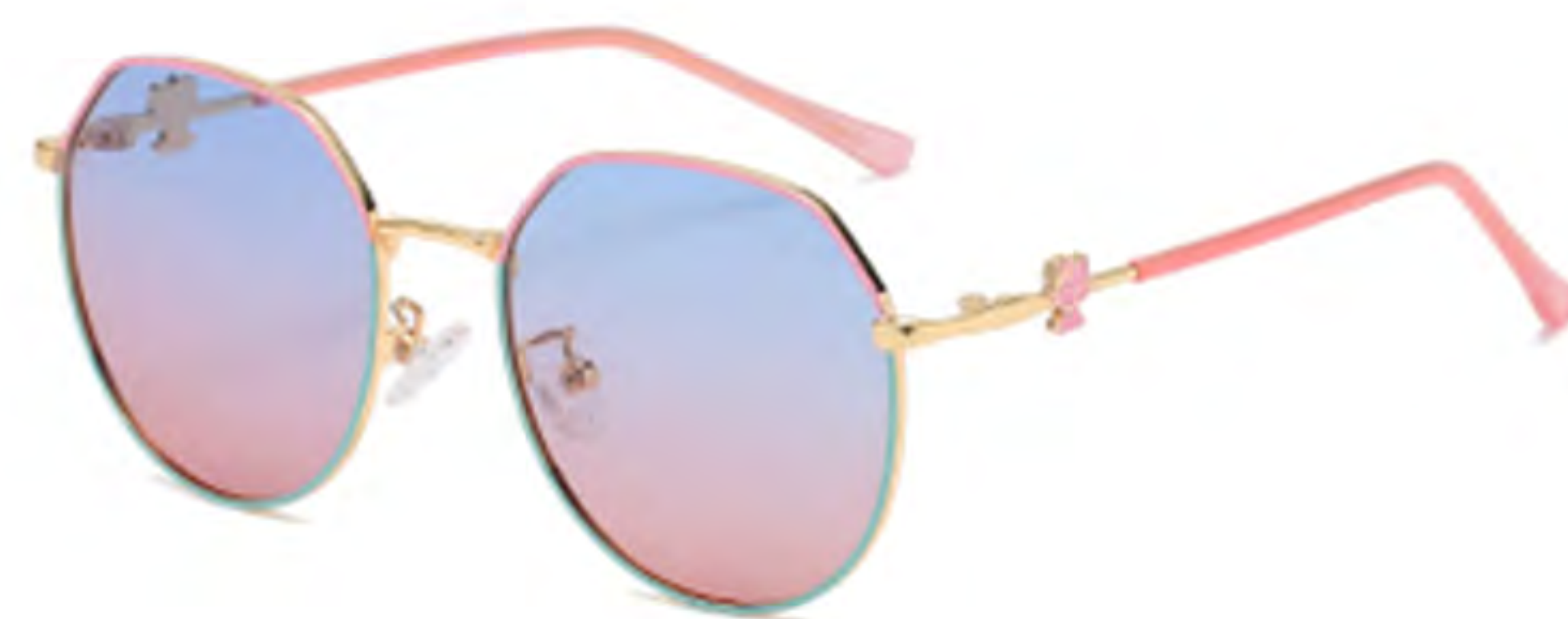
NO.3 T23 上粉下蓝渐变蓝粉