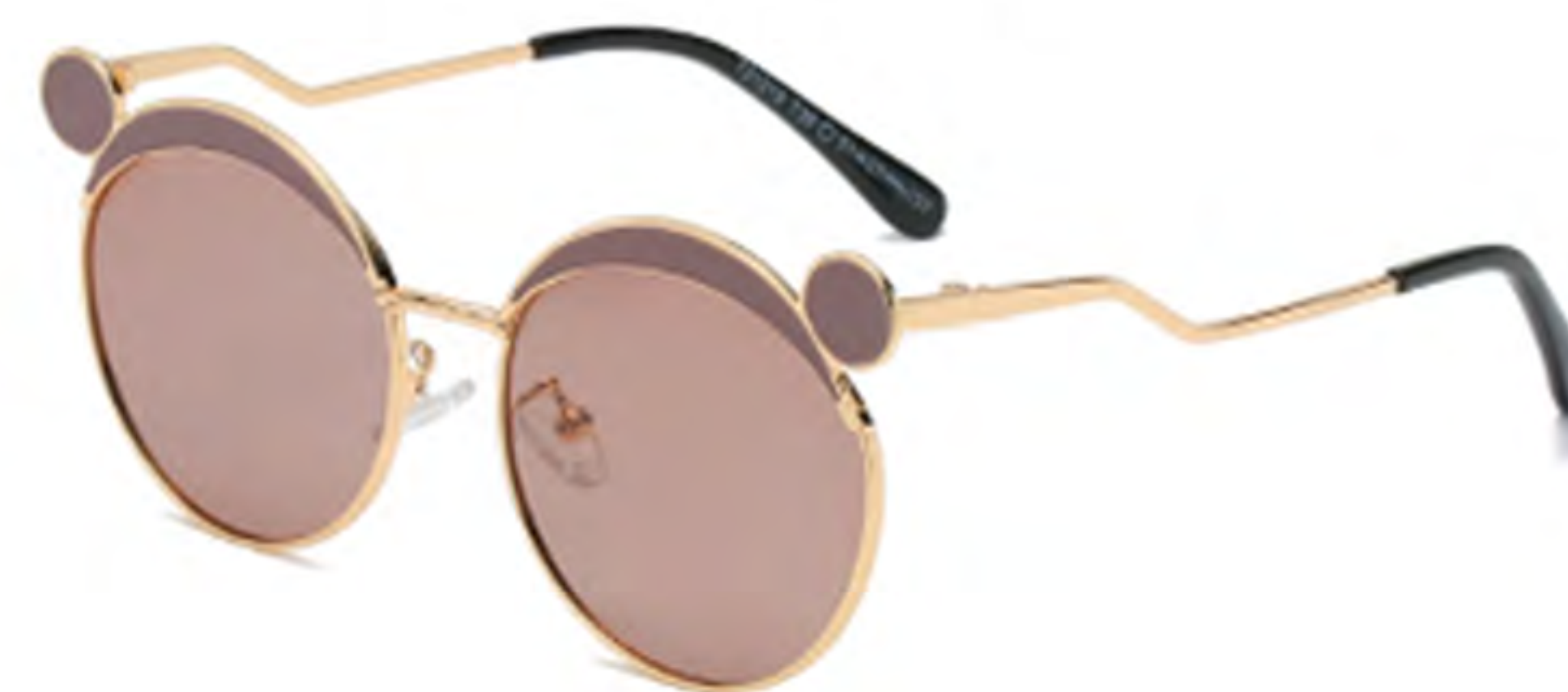
NO.3 T38 金烤咖啡茶片