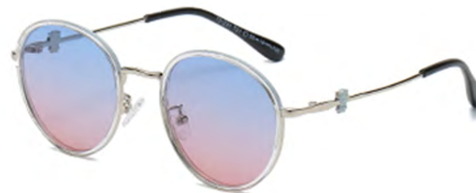
NO.3 T21 银框渐变粉蓝