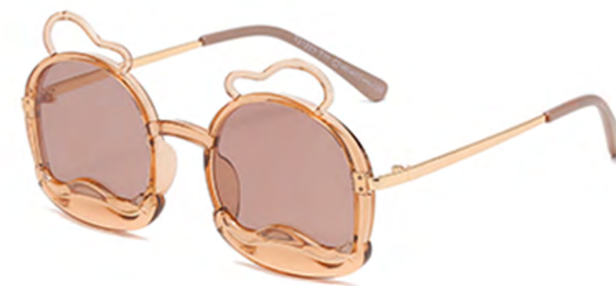
NO.2 T11 透明茶茶片