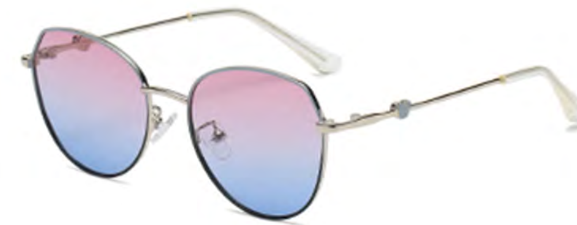
NO.5 T16 上蓝下黑渐变粉蓝