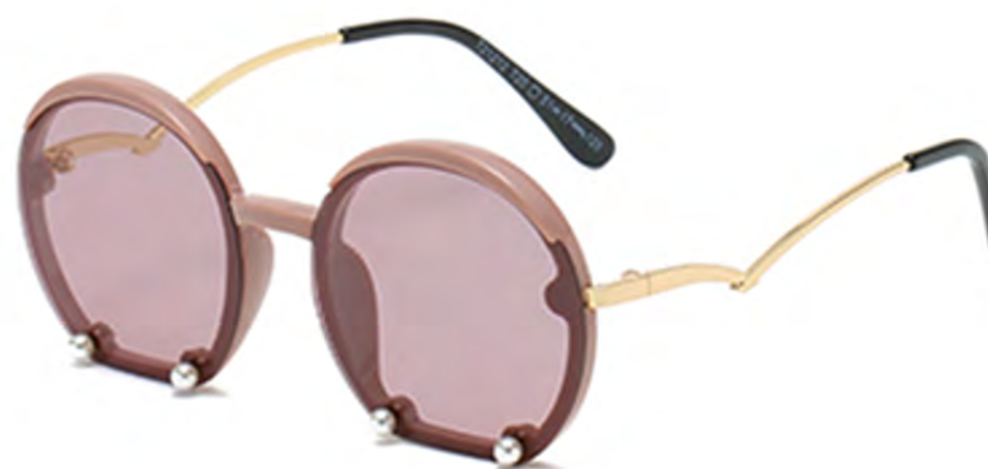
NO.5 T20 咖啡