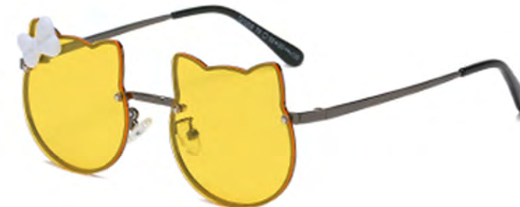
NO.6 T6 枪框黄片