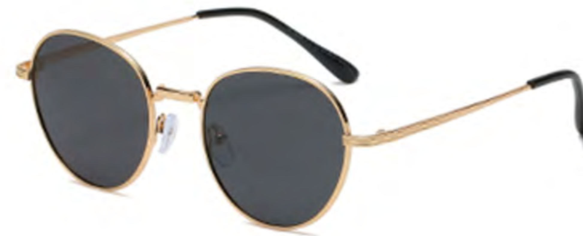
NO.1 T1 金框灰片