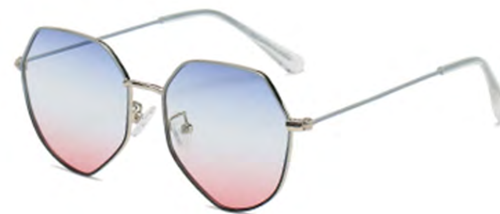
NO.5 T16 上蓝下黑渐变粉蓝