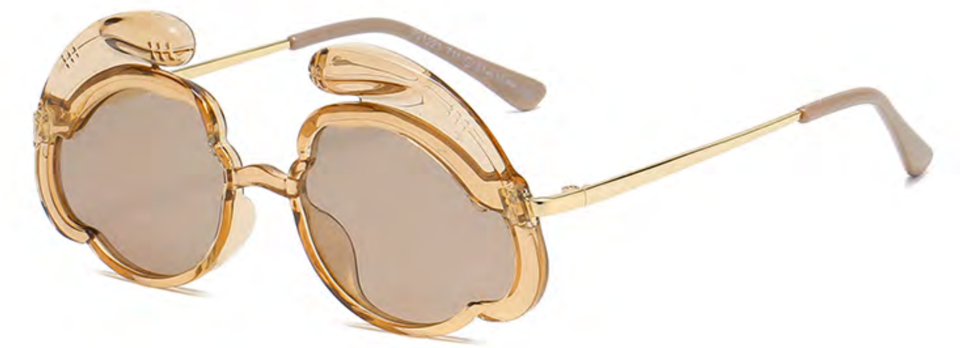
T11 NO.2 透明茶茶片