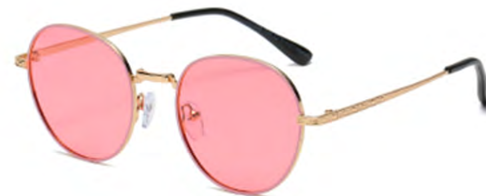
NO.5 T40 金烤粉粉片