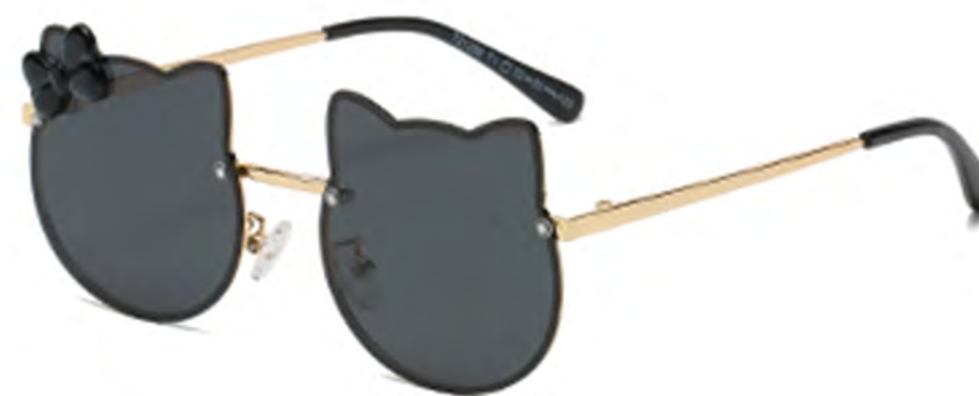
NO.1 T1 金框灰片