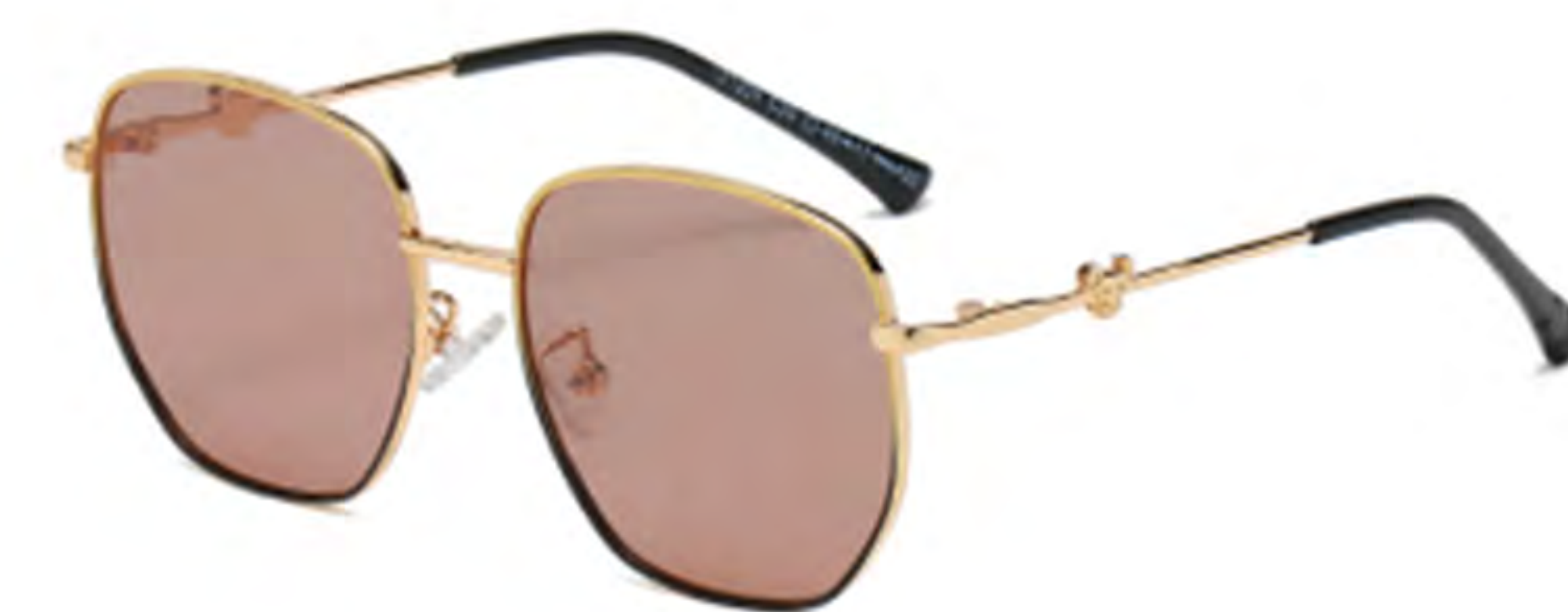
NO.2 T26 上黄下黑黄片