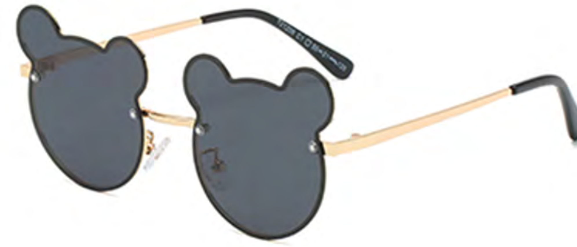
NO.1 C1 金框灰片