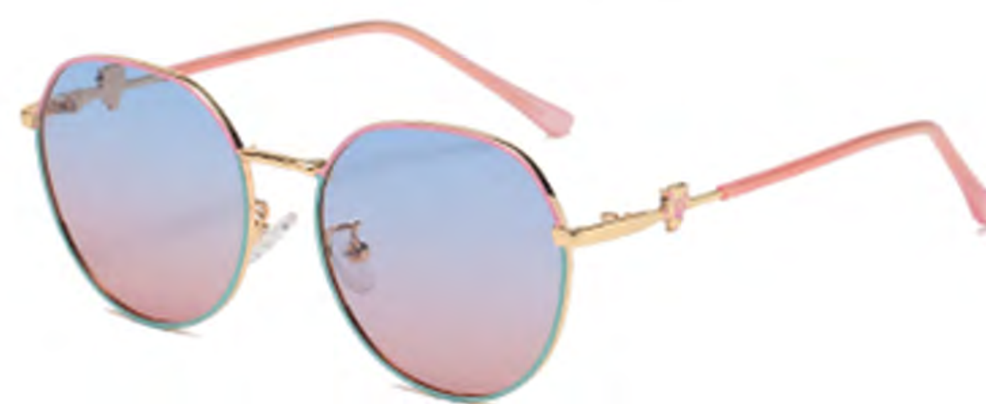
NO.3 T23 上粉下蓝渐变蓝粉