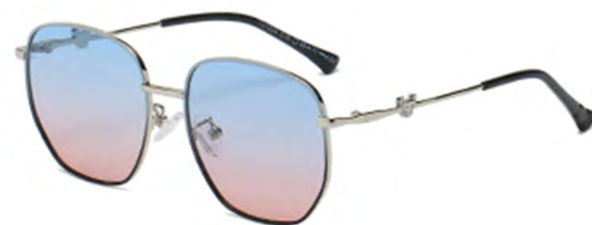
NO.5 T16 上蓝下黑渐变蓝