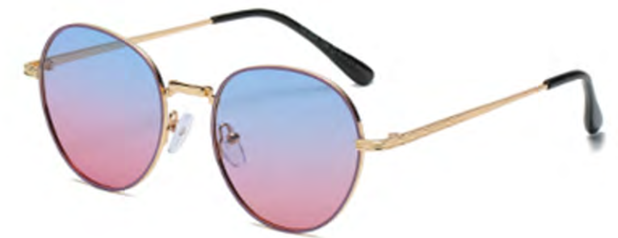
NO.2 T56 金烤紫渐变蓝紫