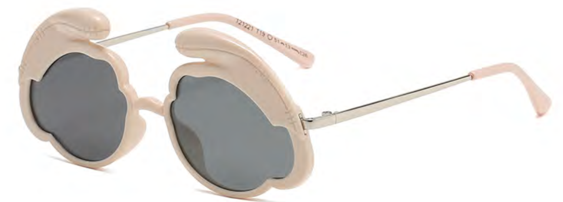
T19 NO.4 米黄框灰片