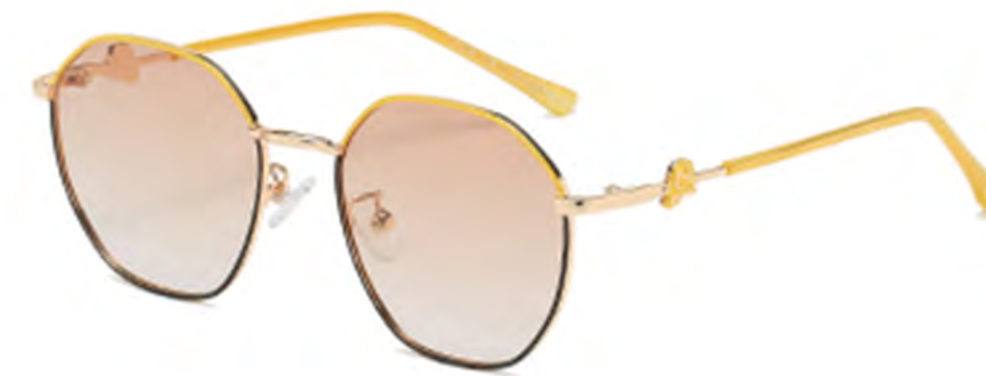
NO.4 T26 上黄下黑黄片