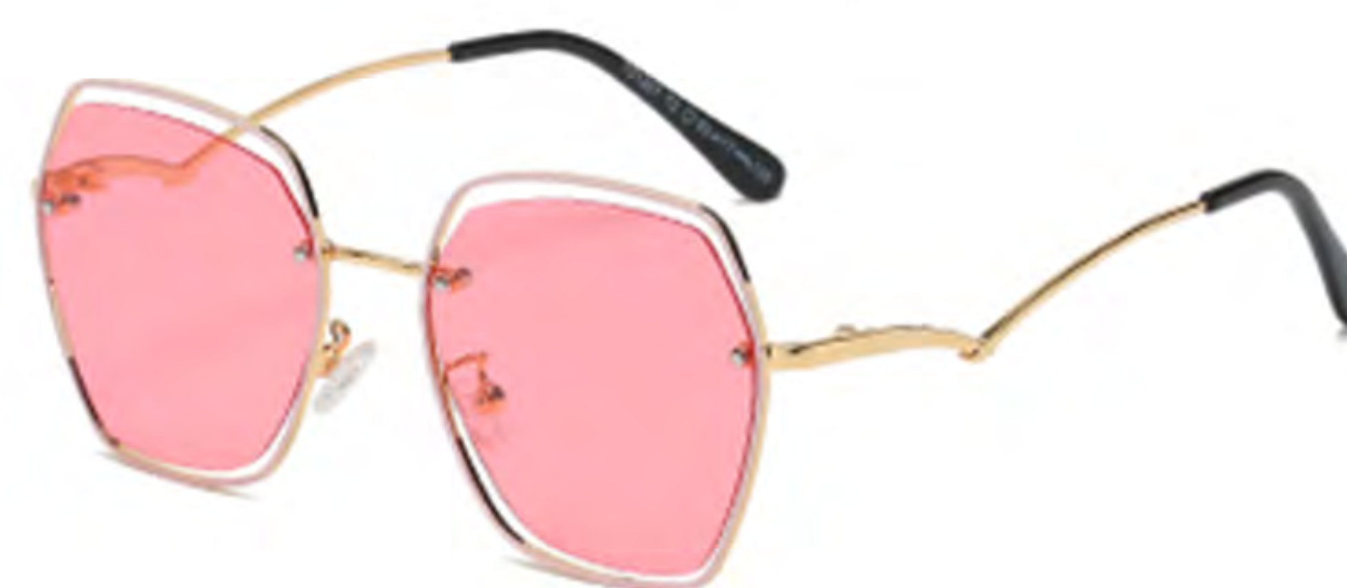
NO.3 T2 金烤粉粉片