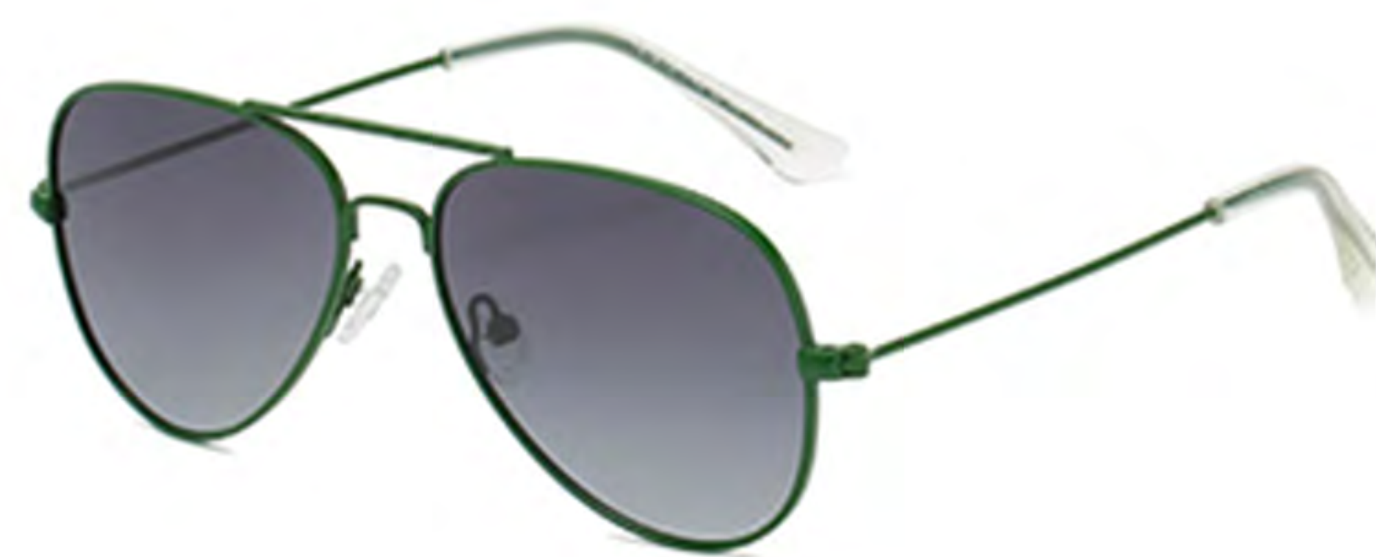
NO.5 T48 绿框灰片