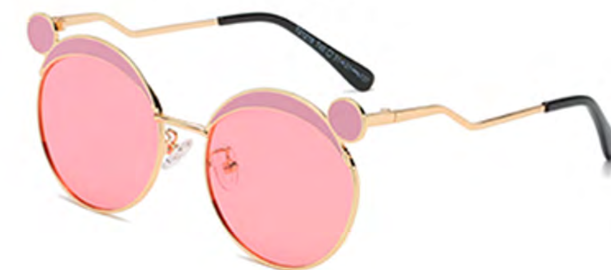
NO.4 T40 金烤粉粉片