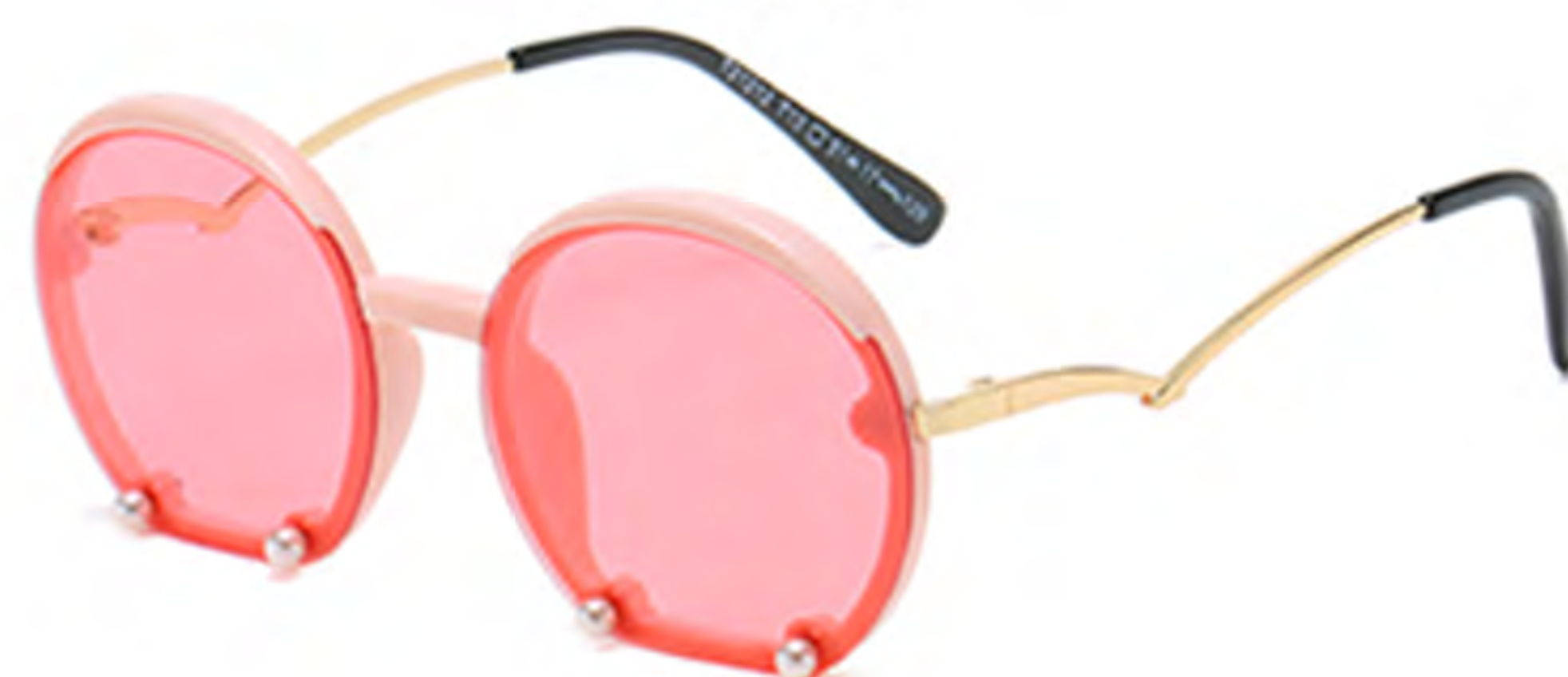
NO.3 T13 粉框粉片