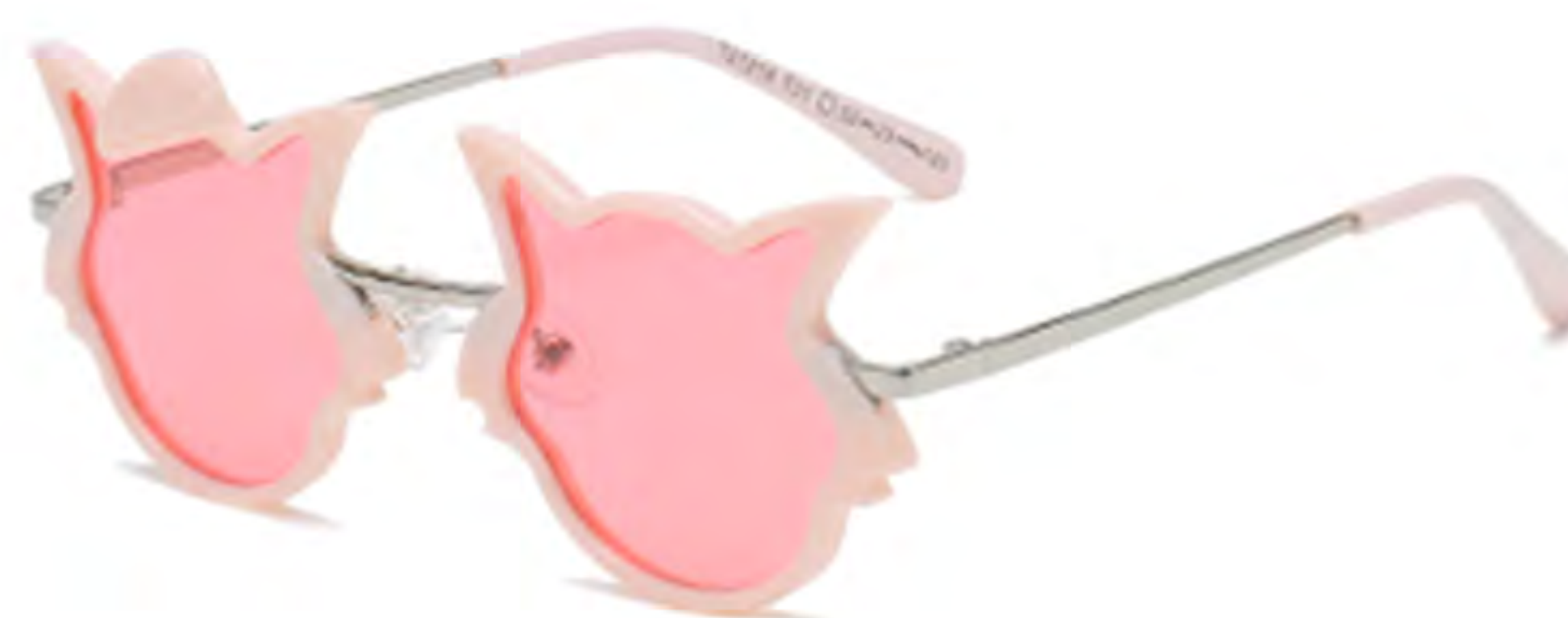
NO.3 T31 粉框粉片