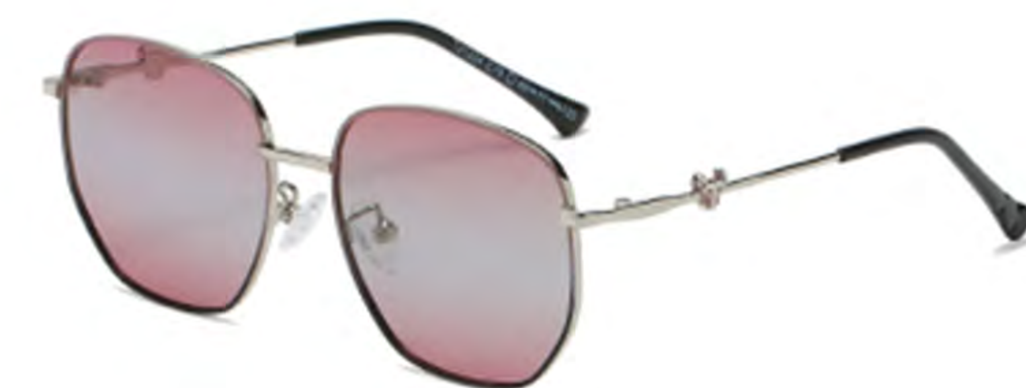
NO.4 T15 上紫下黑渐变紫