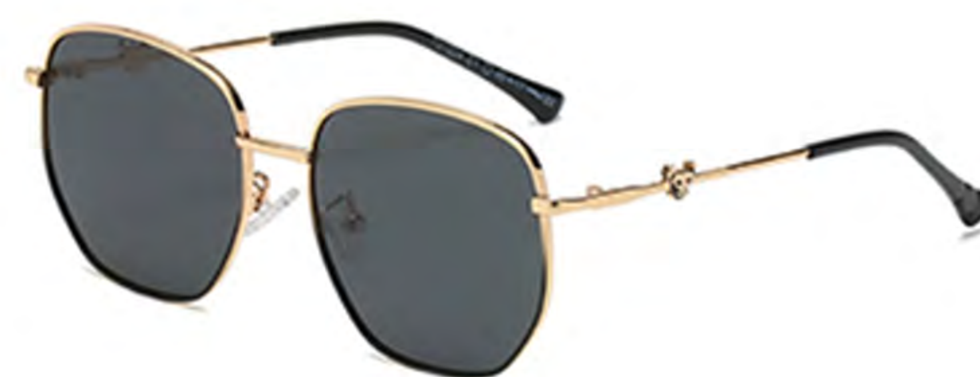
NO.1 T1 上金下黑灰片