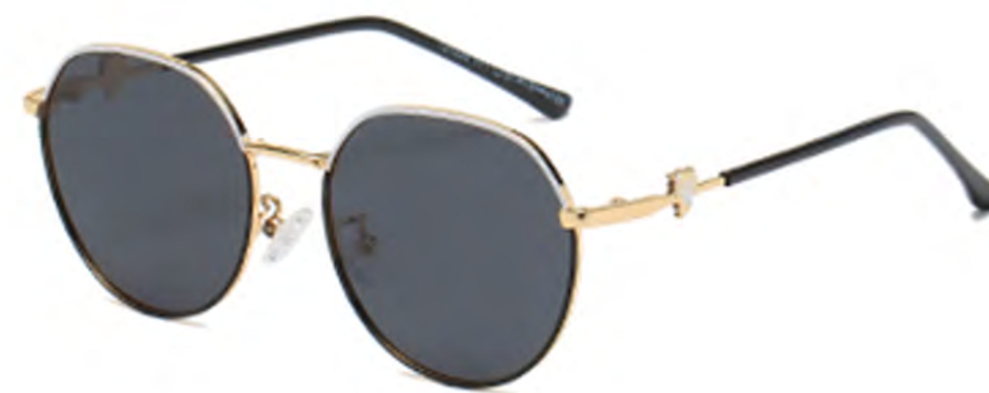
NO.1 T71 上白下黑灰片