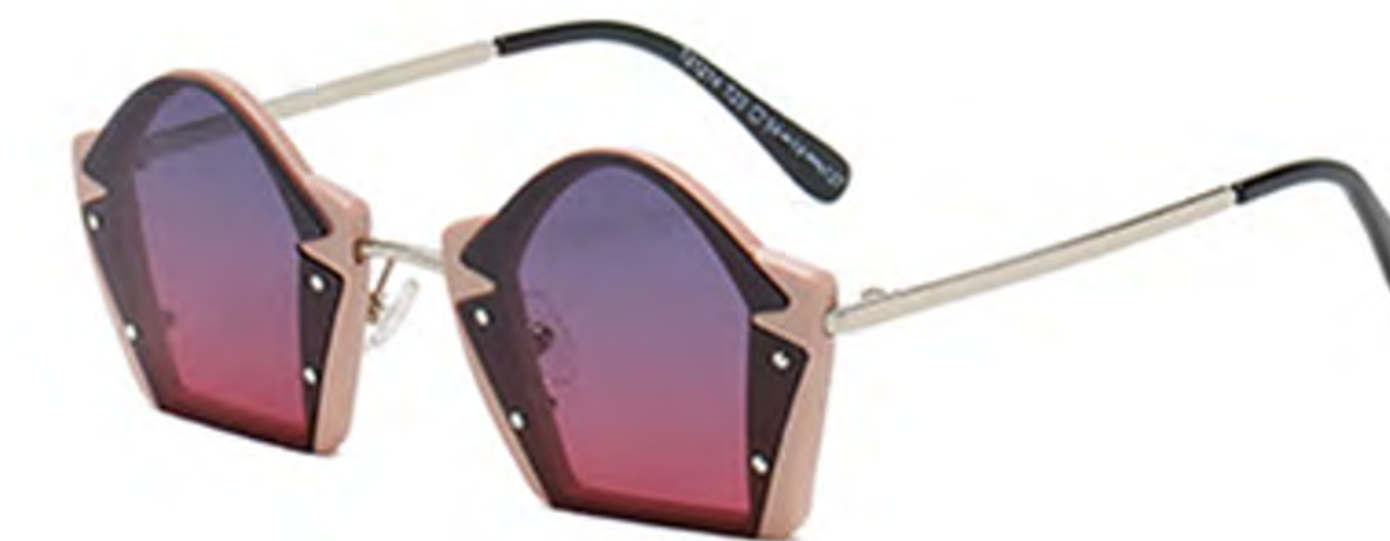
NO.4 T23 藕粉渐变粉