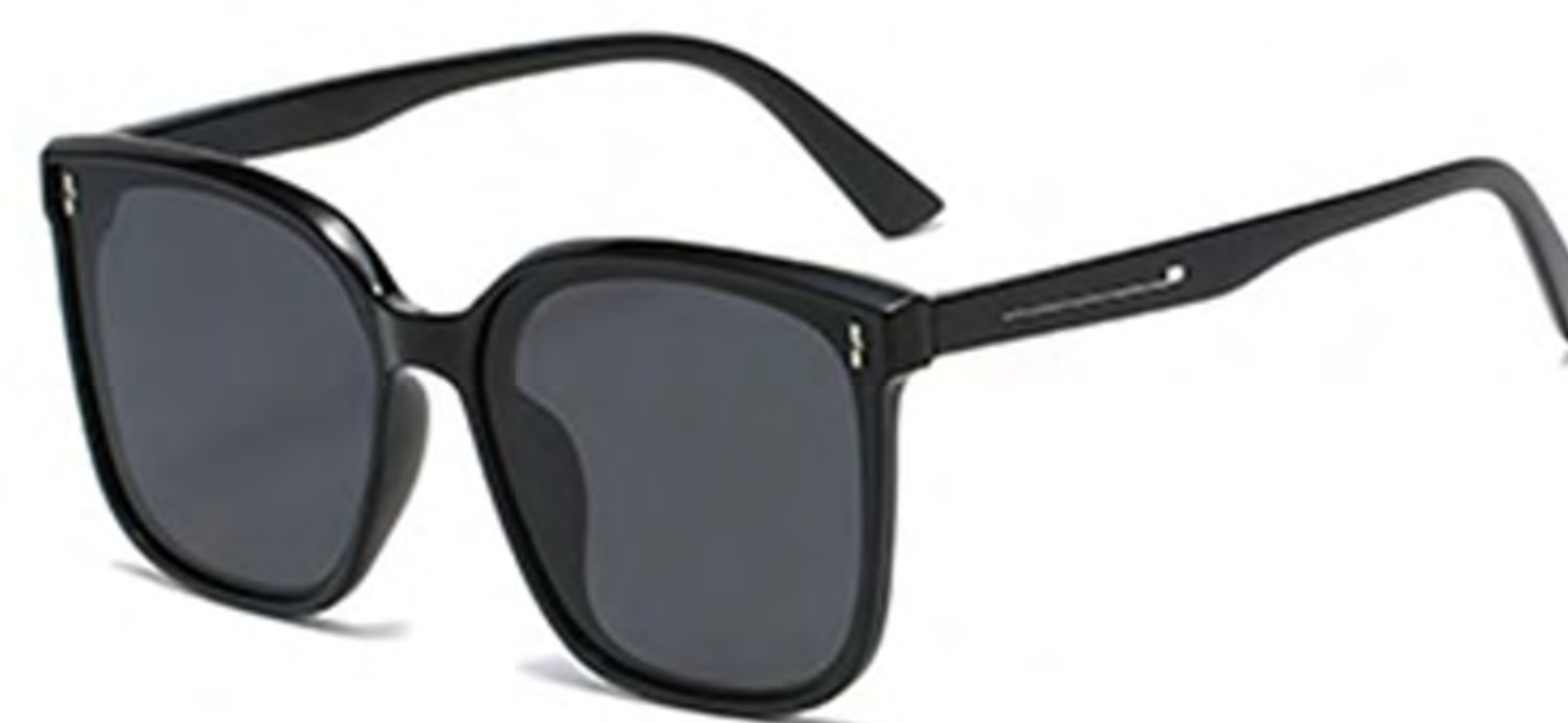
NO.1 T1 黑框灰片