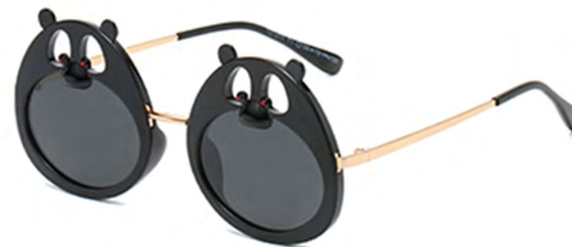
NO.1 T1 亮黑灰