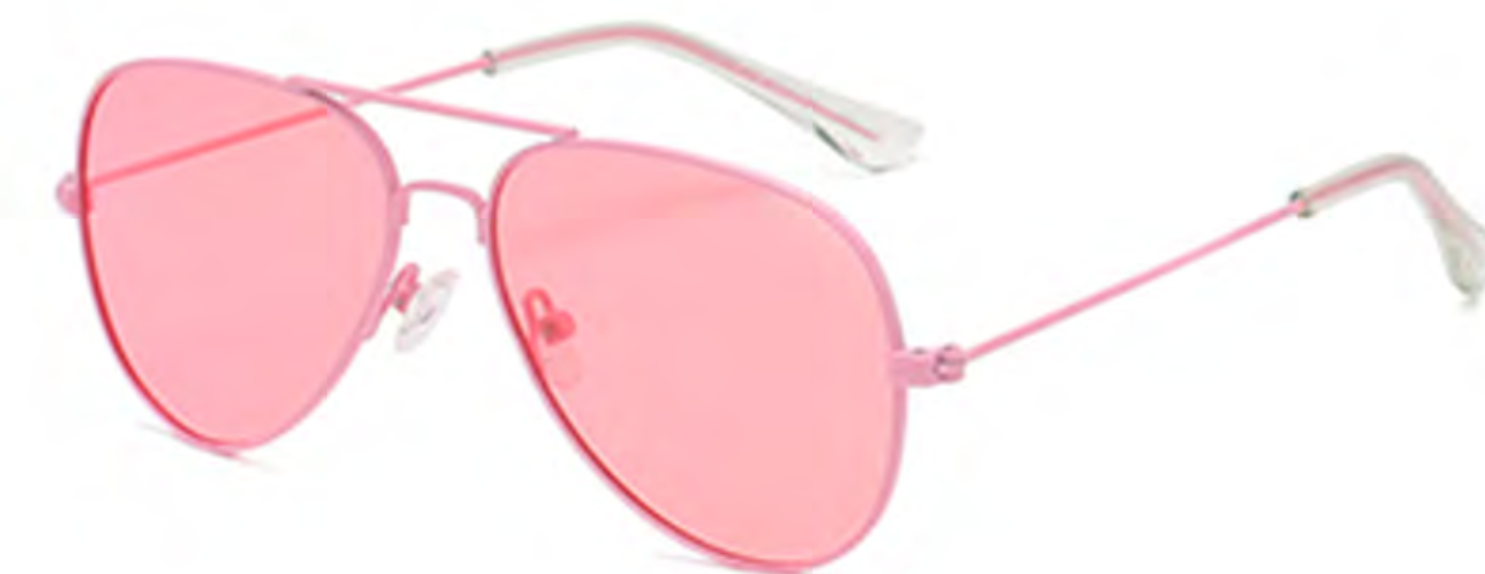
NO.2 T2 粉框粉片