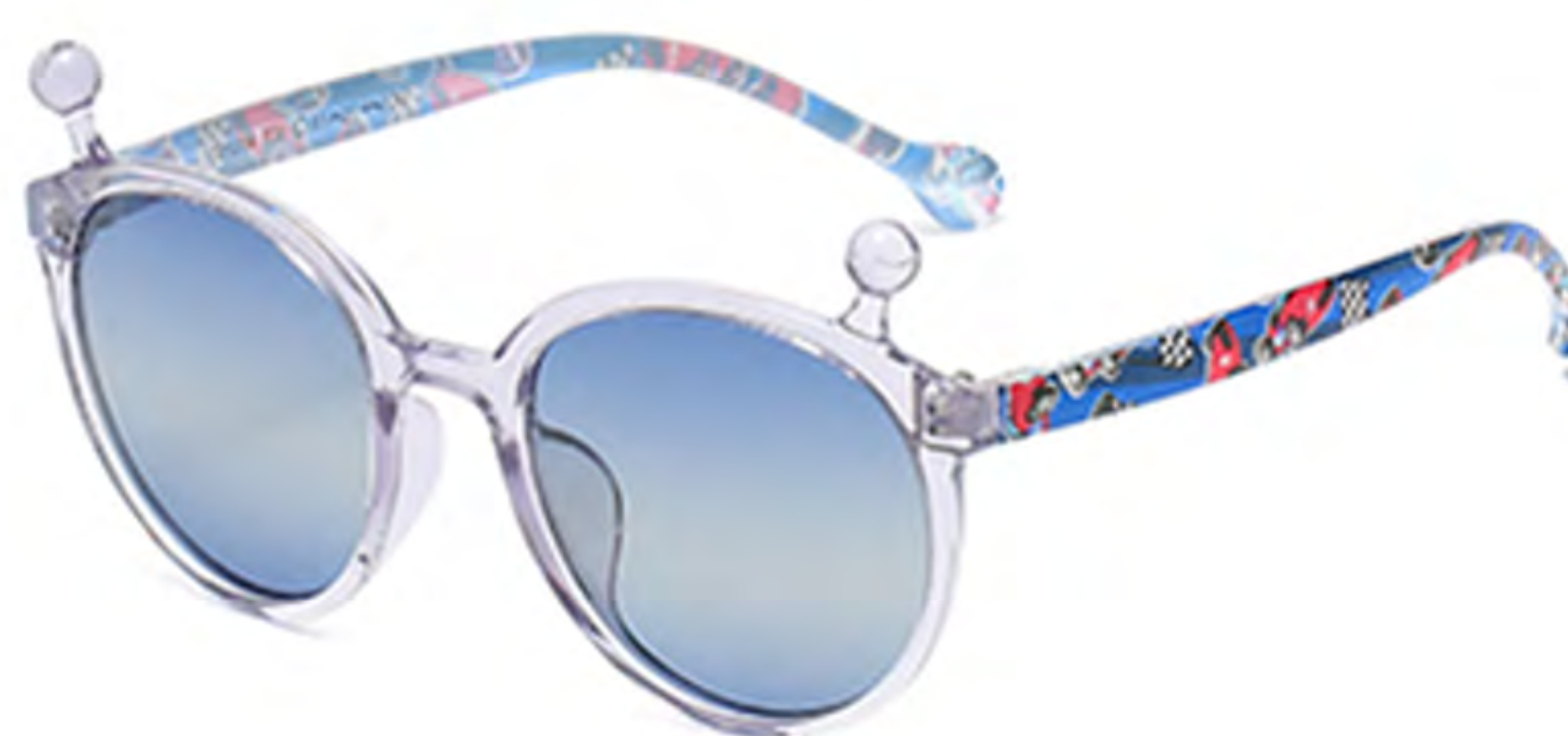
NO.3 T30 透紫渐变蓝