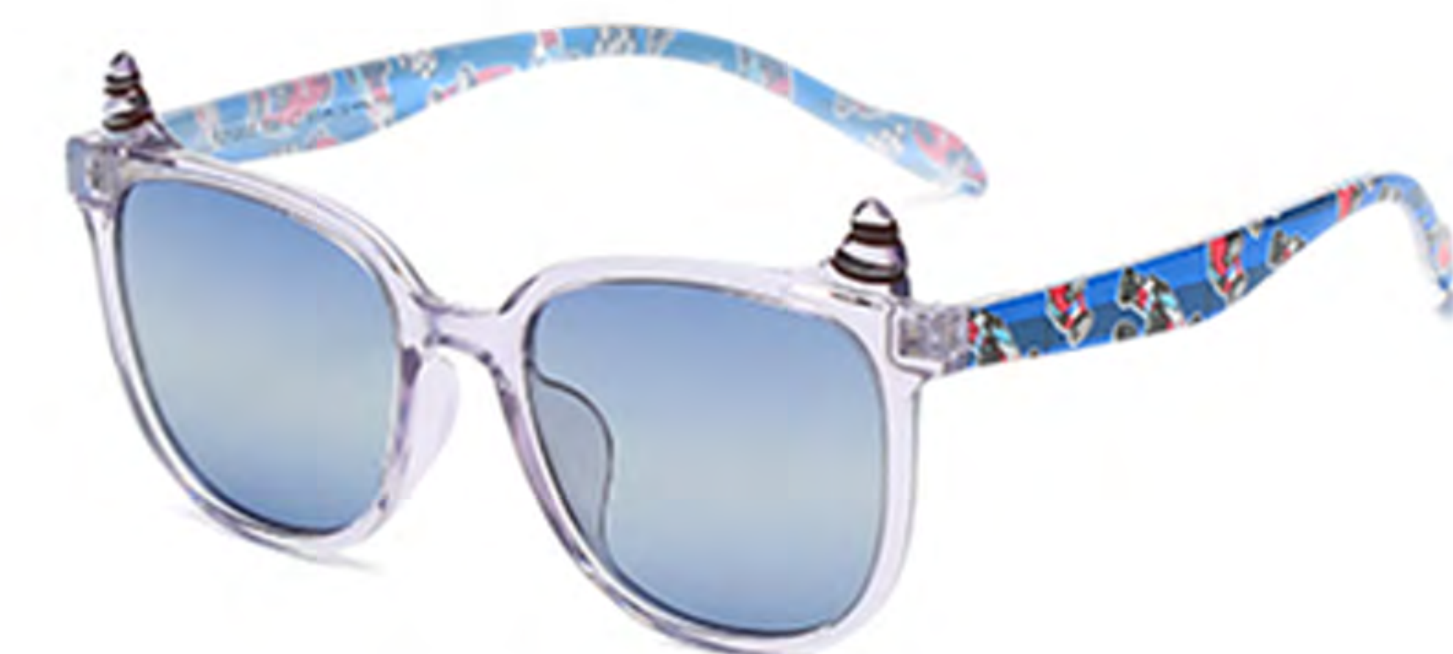
NO.4 T29 透明紫渐变蓝