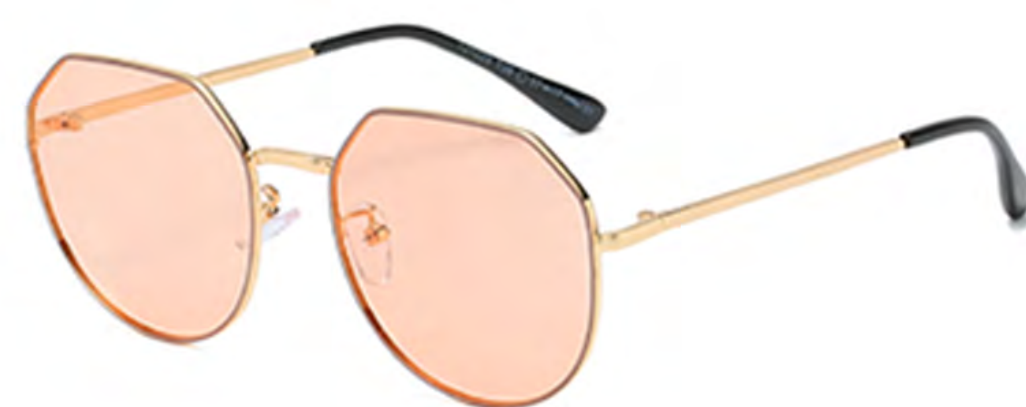
NO.2 T38 金烤咖啡茶片