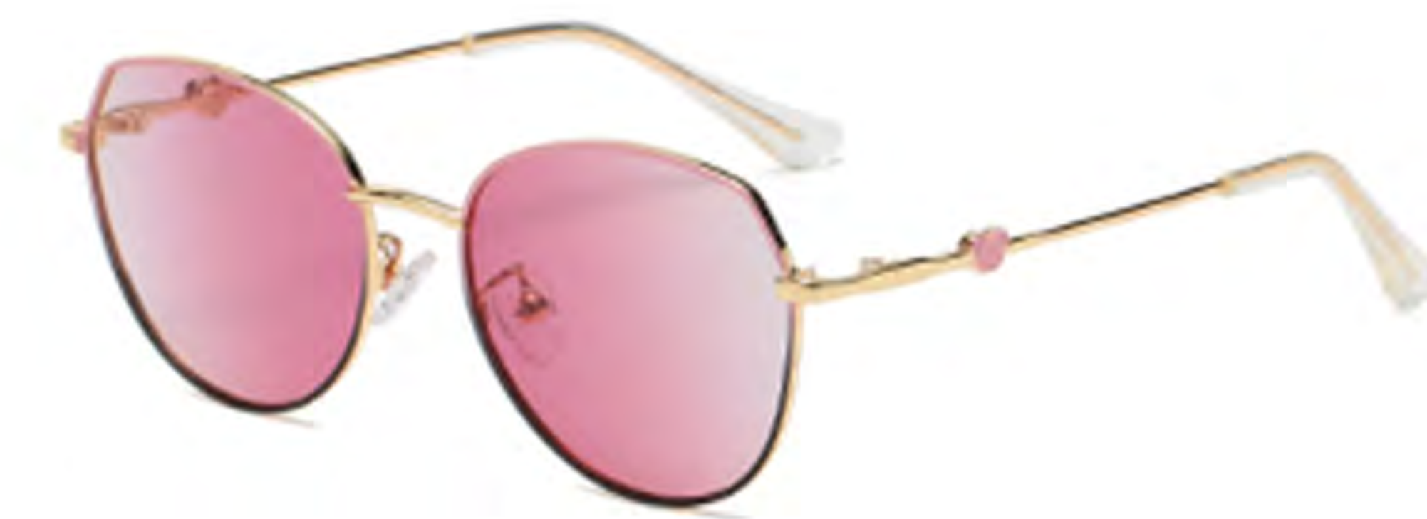
NO.4 T14 上粉下黑粉片