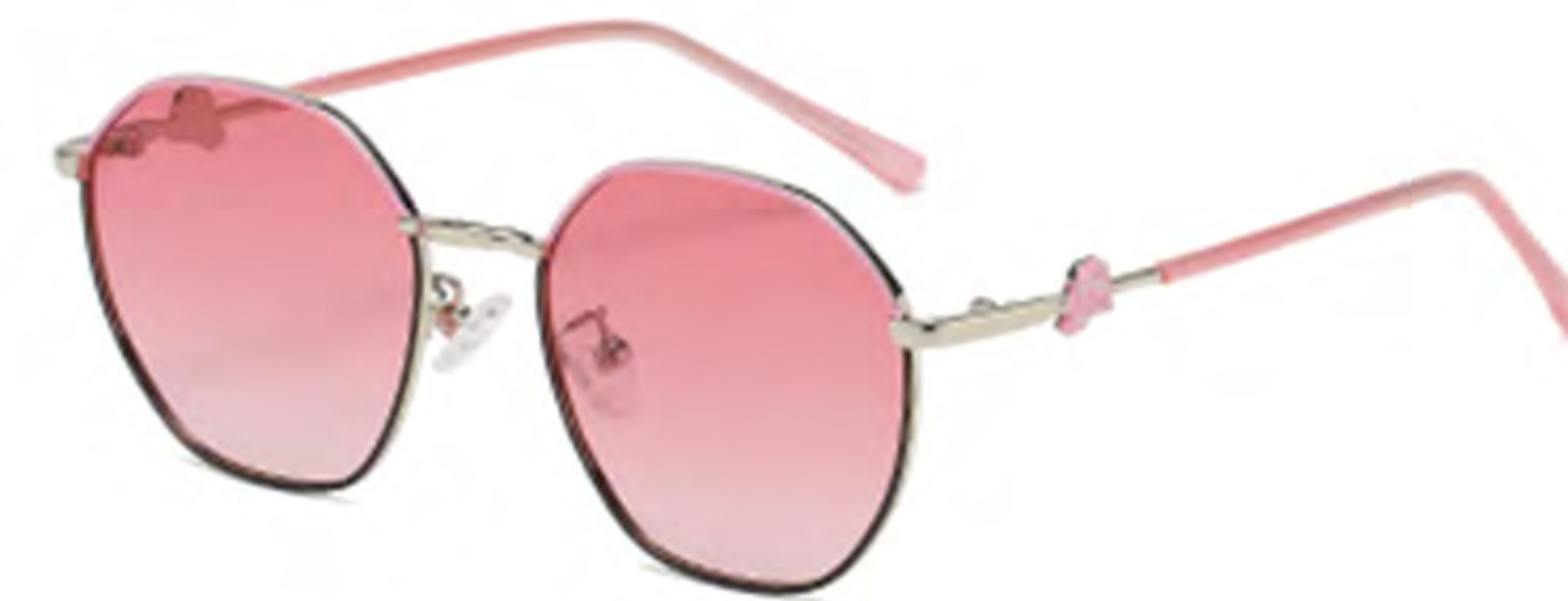
NO.2 T14 上粉下黑粉片