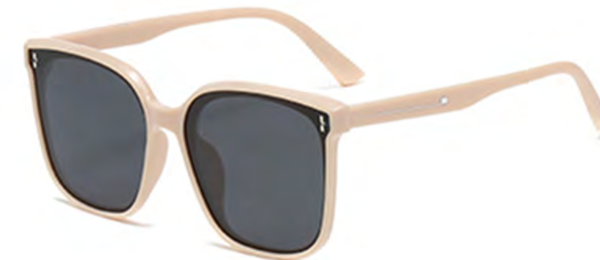
NO.4 T65 米黄框片