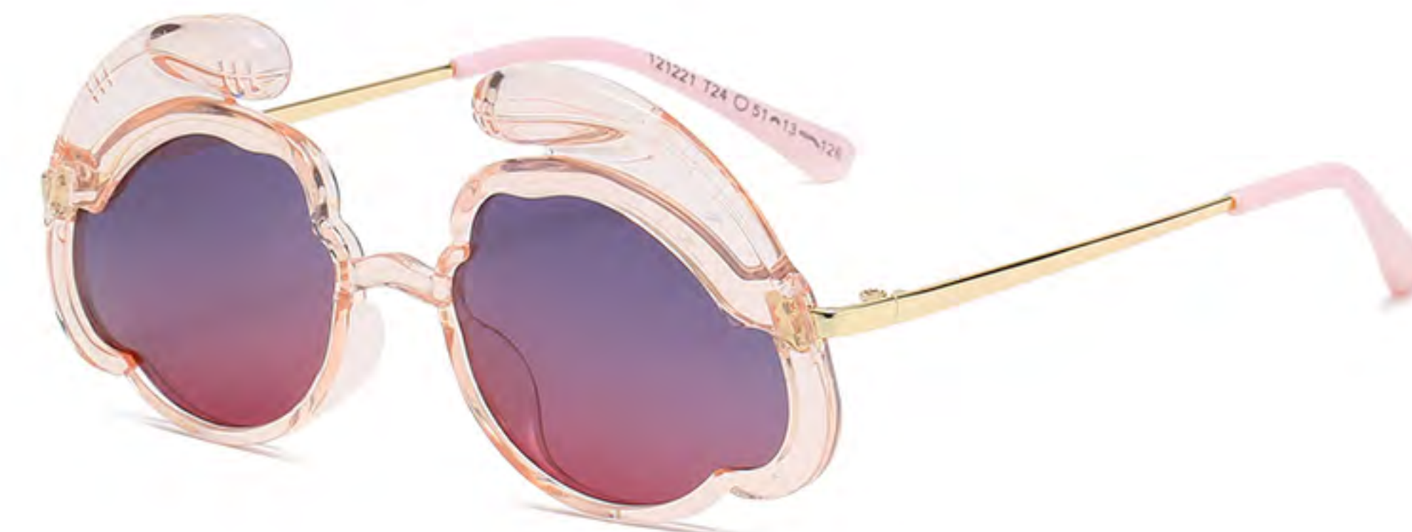
T2 NO.3 透明粉渐变粉