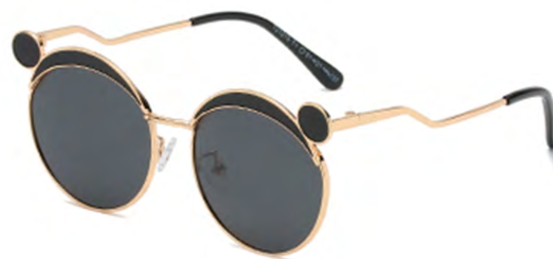
NO.1 T1 金烤黑灰片