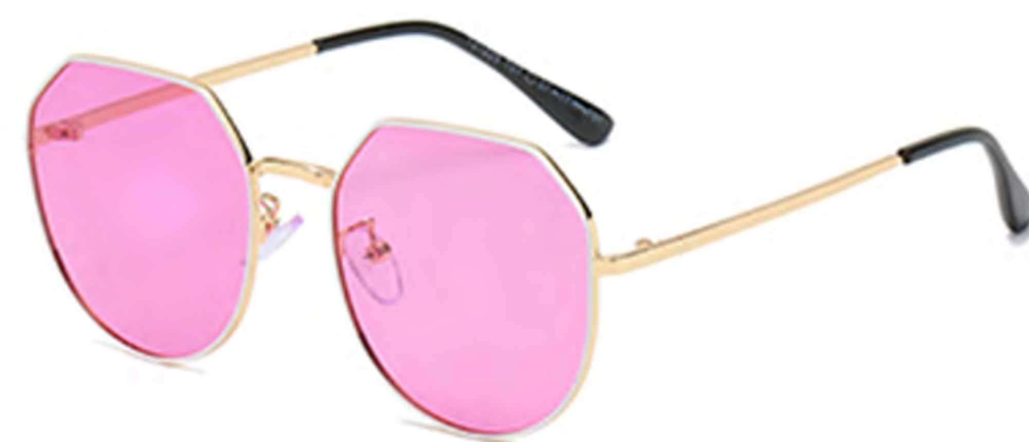
NO.4 T67 金烤白紫片