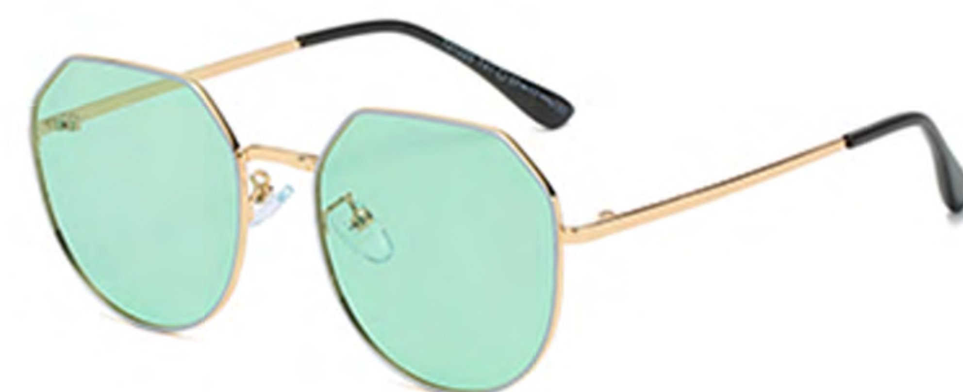
NO.3 T41 金烤蓝绿片