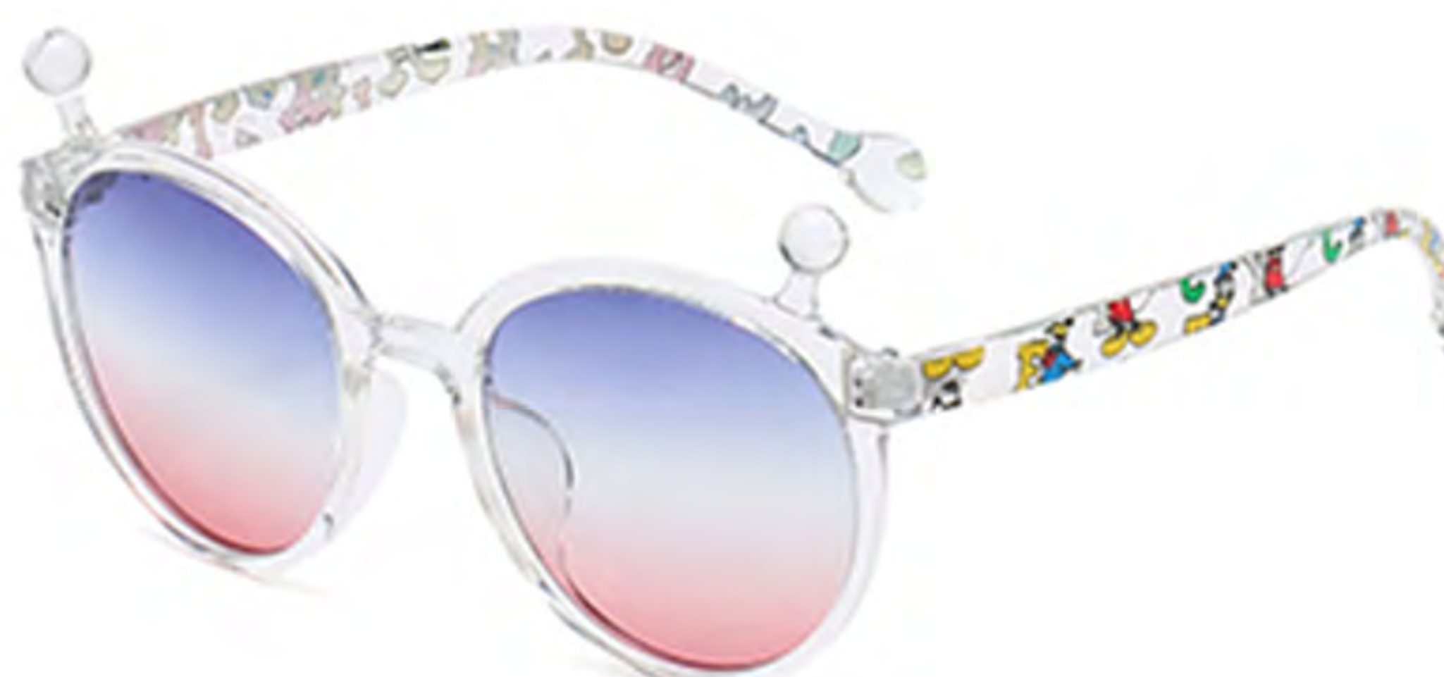
NO.5 T31 透明渐变蓝红