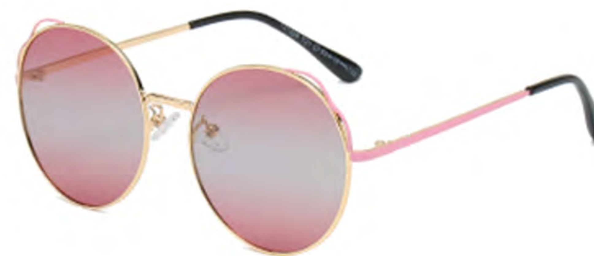
NO.5 T21 金烤粉渐变粉