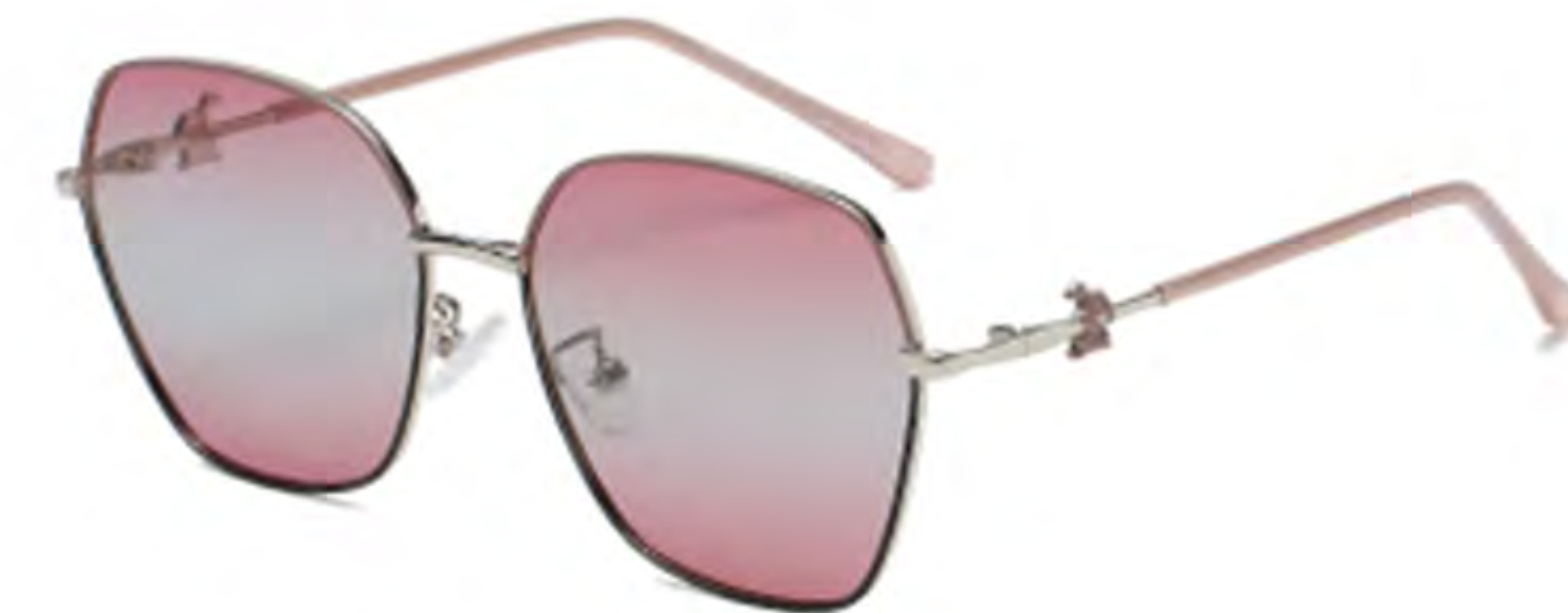
NO.2 T15 上藕粉下黑渐变紫