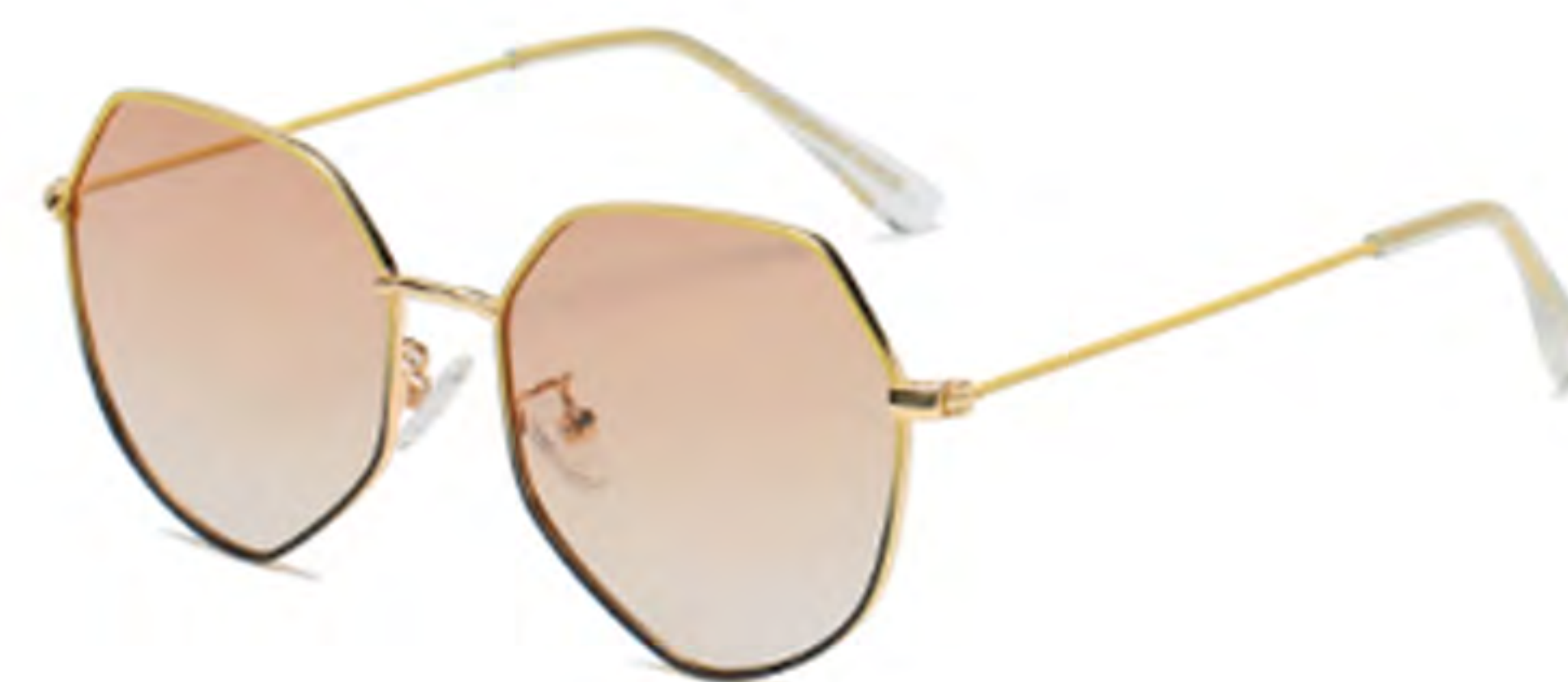
NO.3 T26 上黄下黑黄片