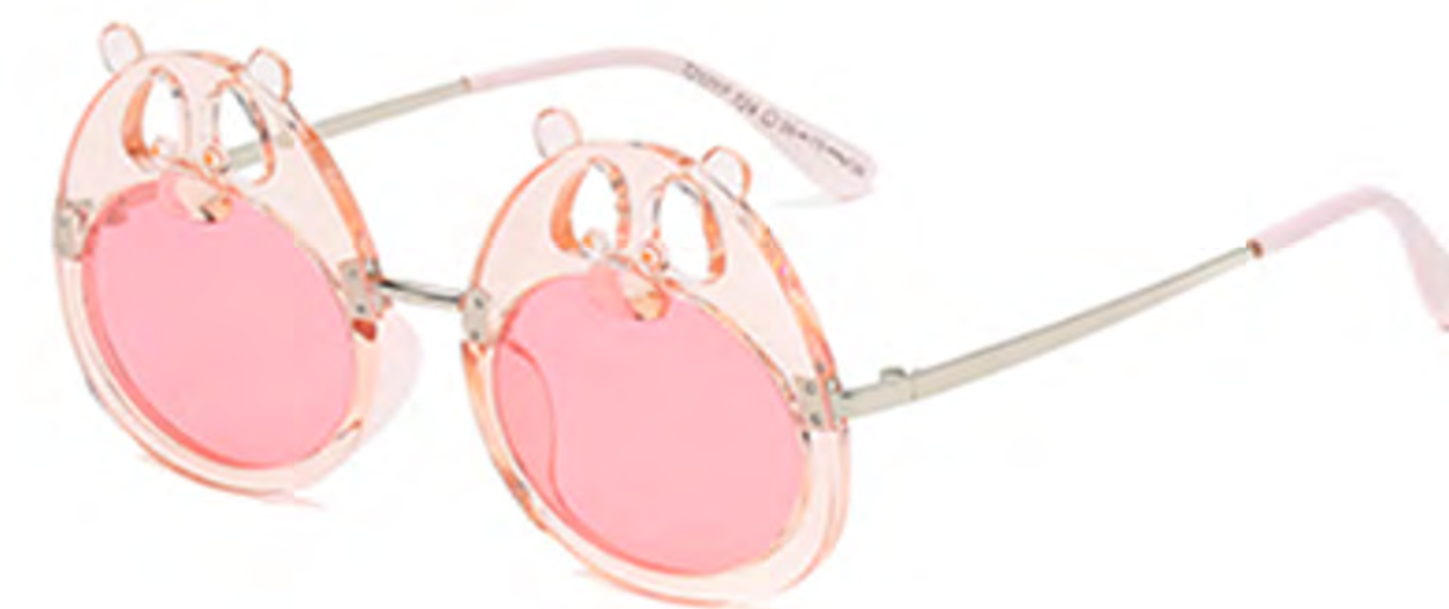
NO.2 T24 粉框粉片