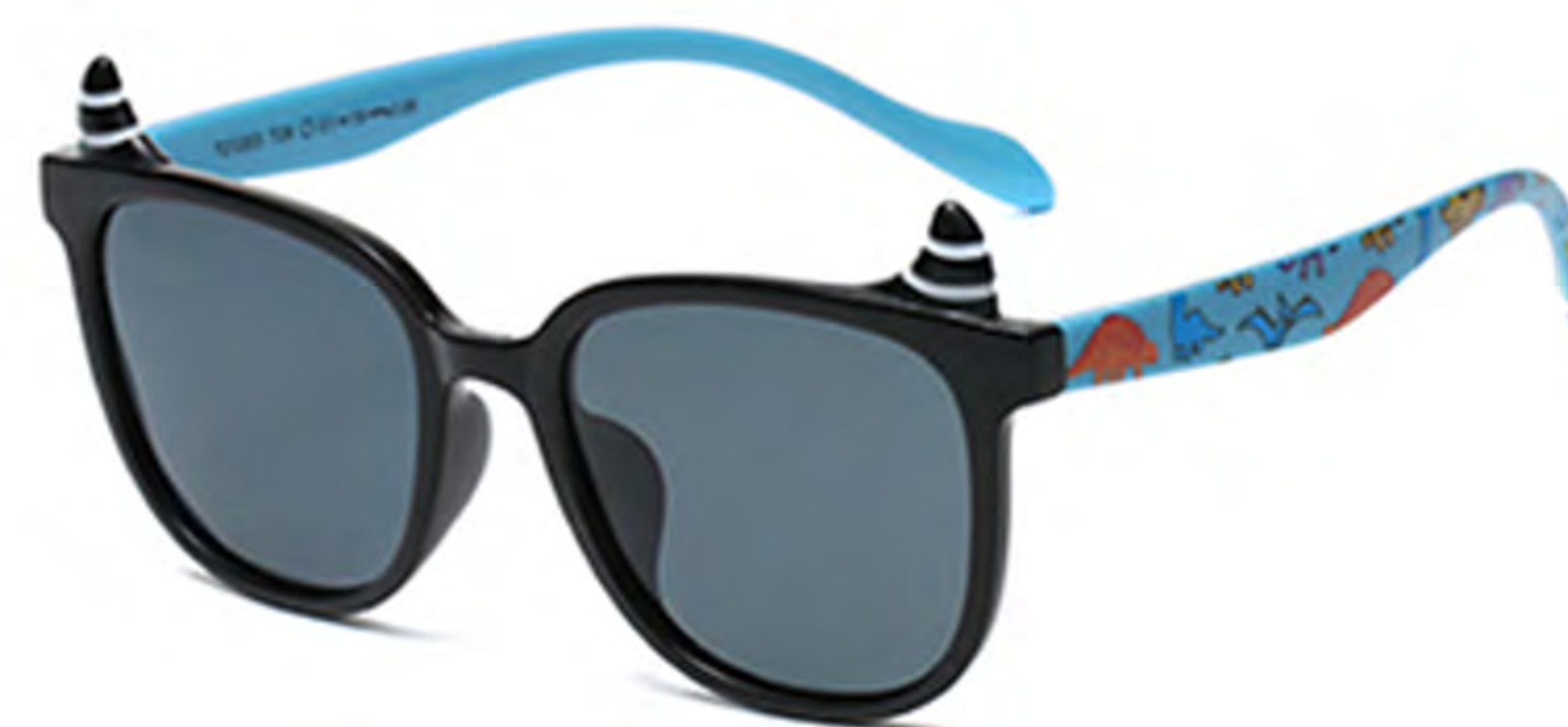
NO.1 T28 黑蓝灰片