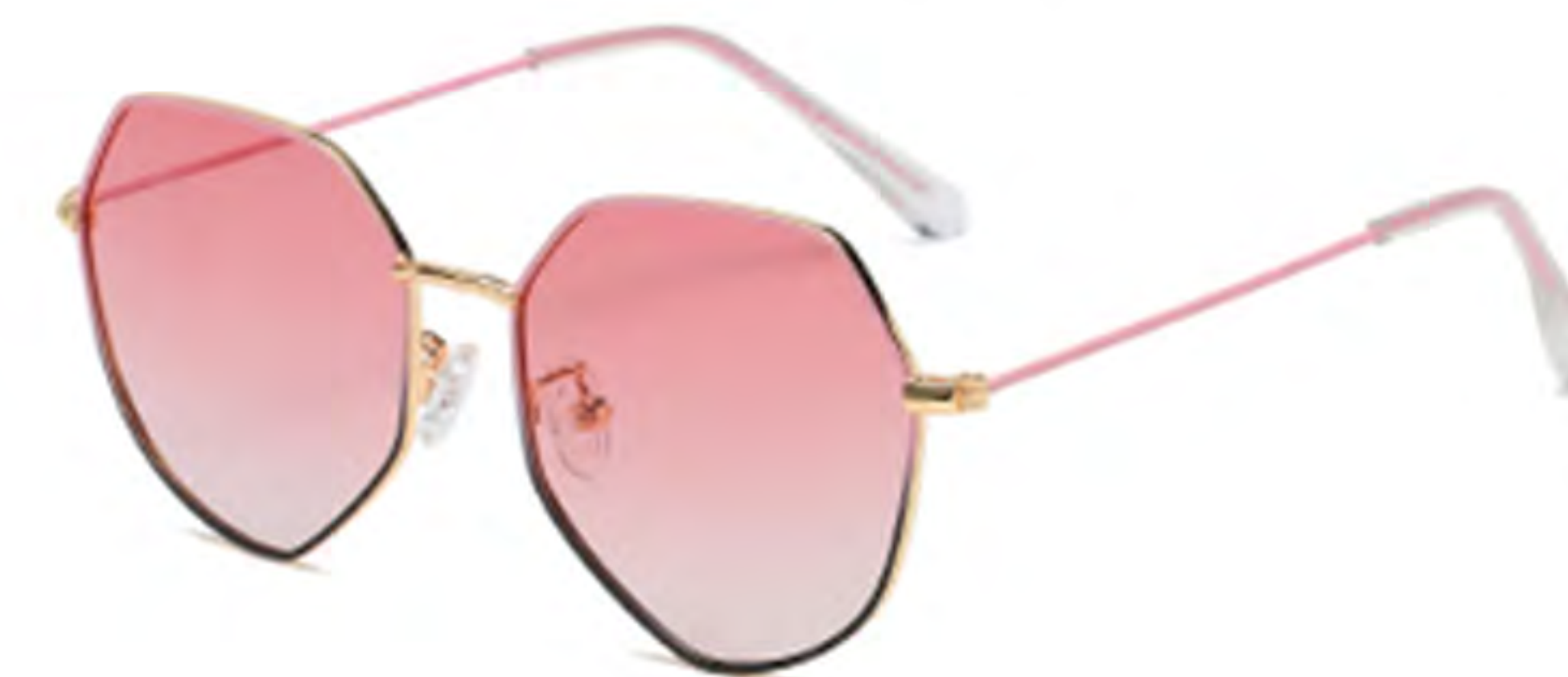
NO.4 T14 上粉下黑粉片