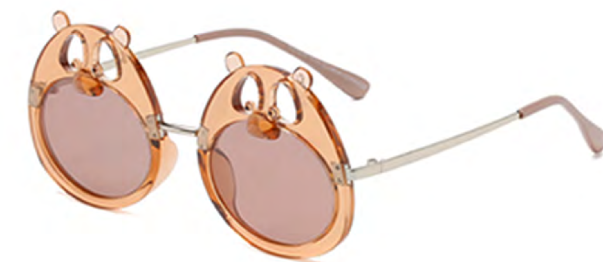
NO.4 T11 透明茶茶片