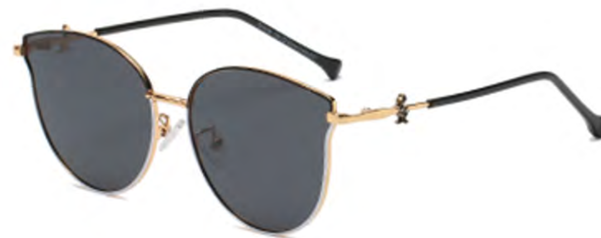
NO.1 T22 上黑下白灰片