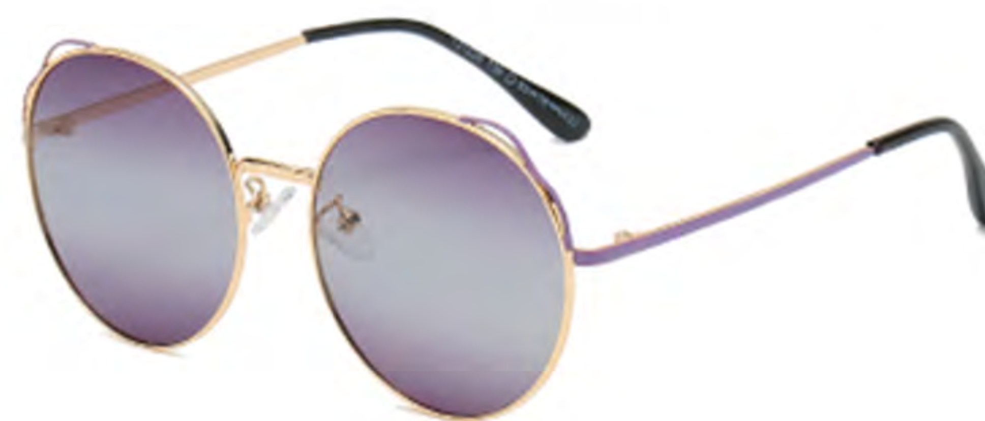
NO.3 T56 金烤紫渐变紫