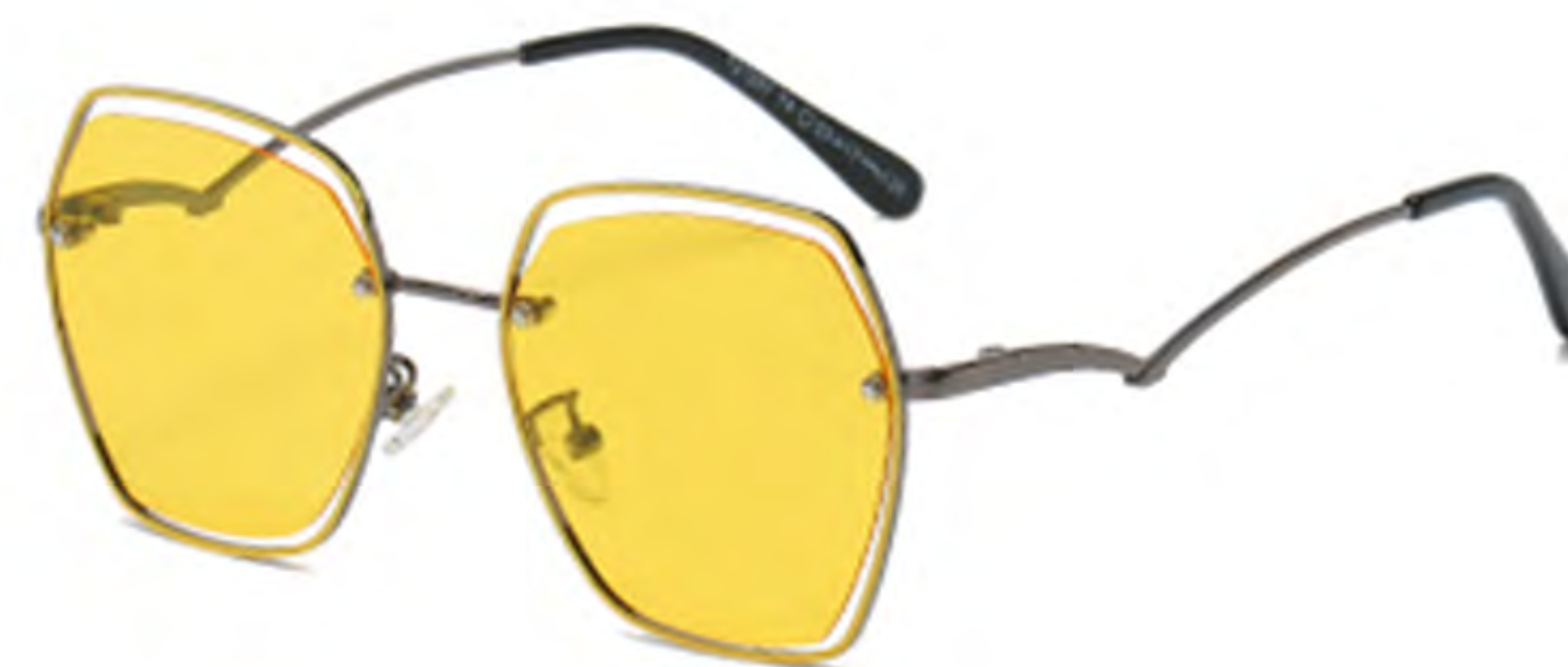
NO.5 T4 枪烤黄黄片