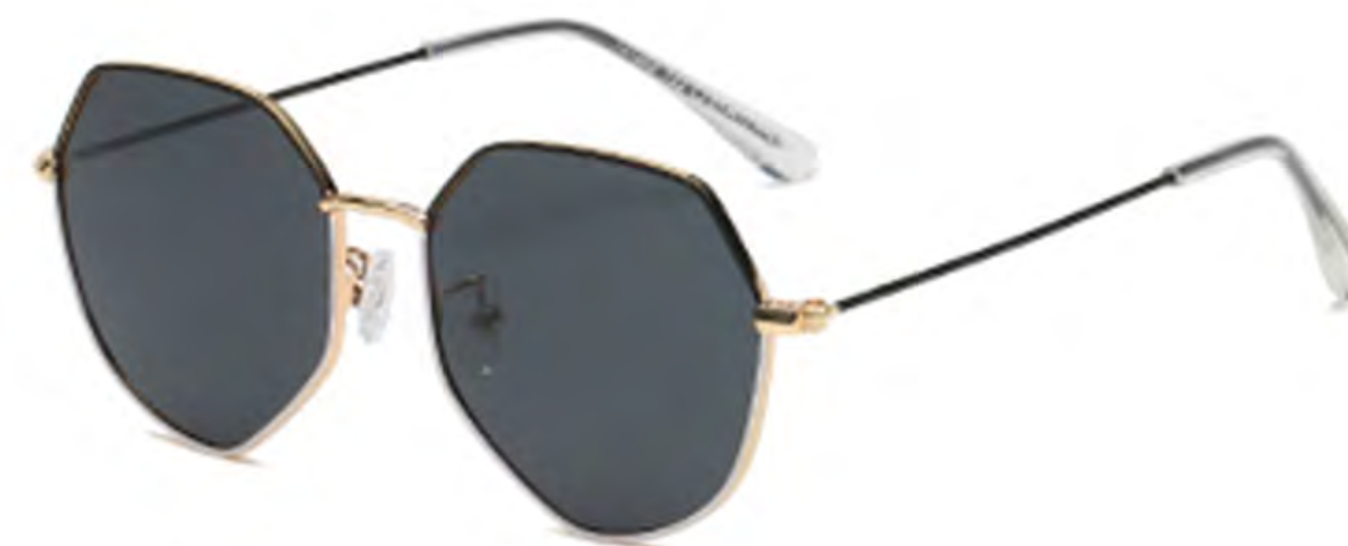
NO.1 T22 上黑下白灰片