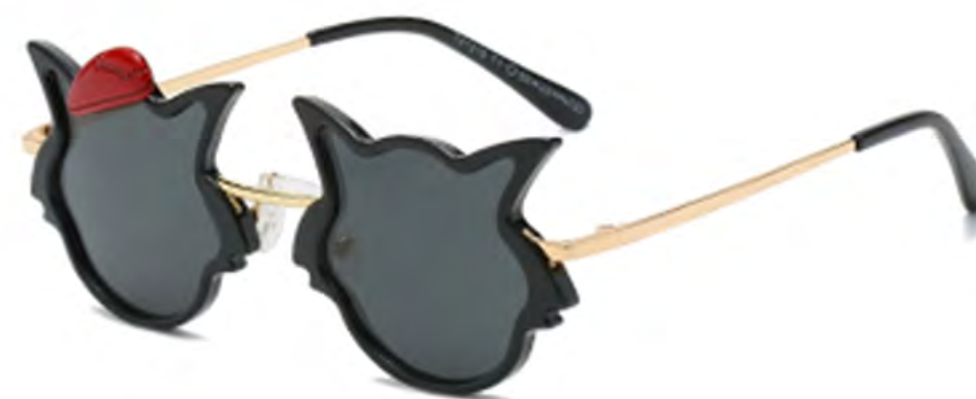
NO.1 T1 亮黑灰片