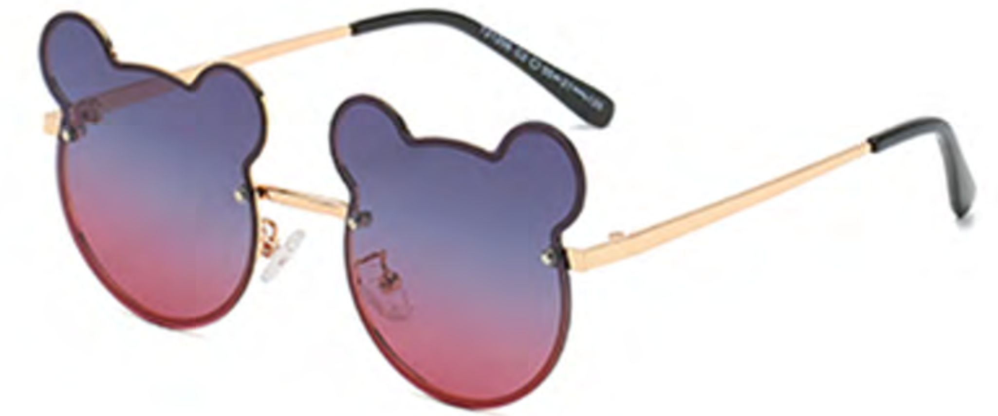
NO.2 C2 金框渐变蓝紫