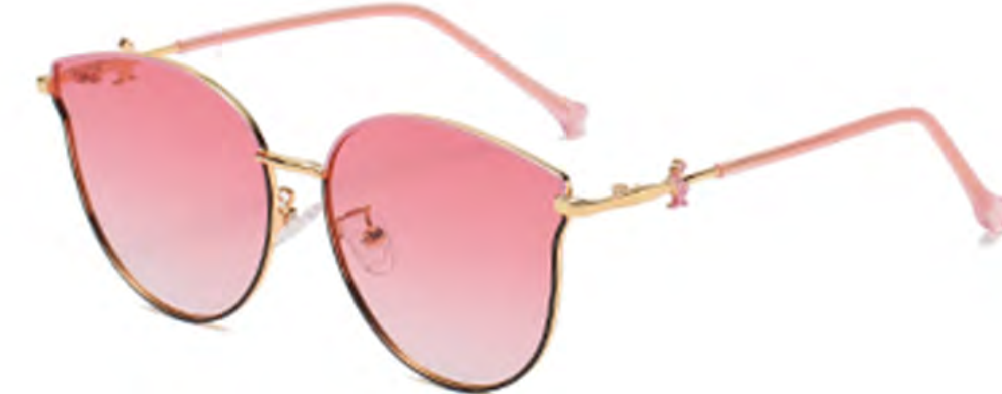
NO.4 T14 上粉下黑粉片