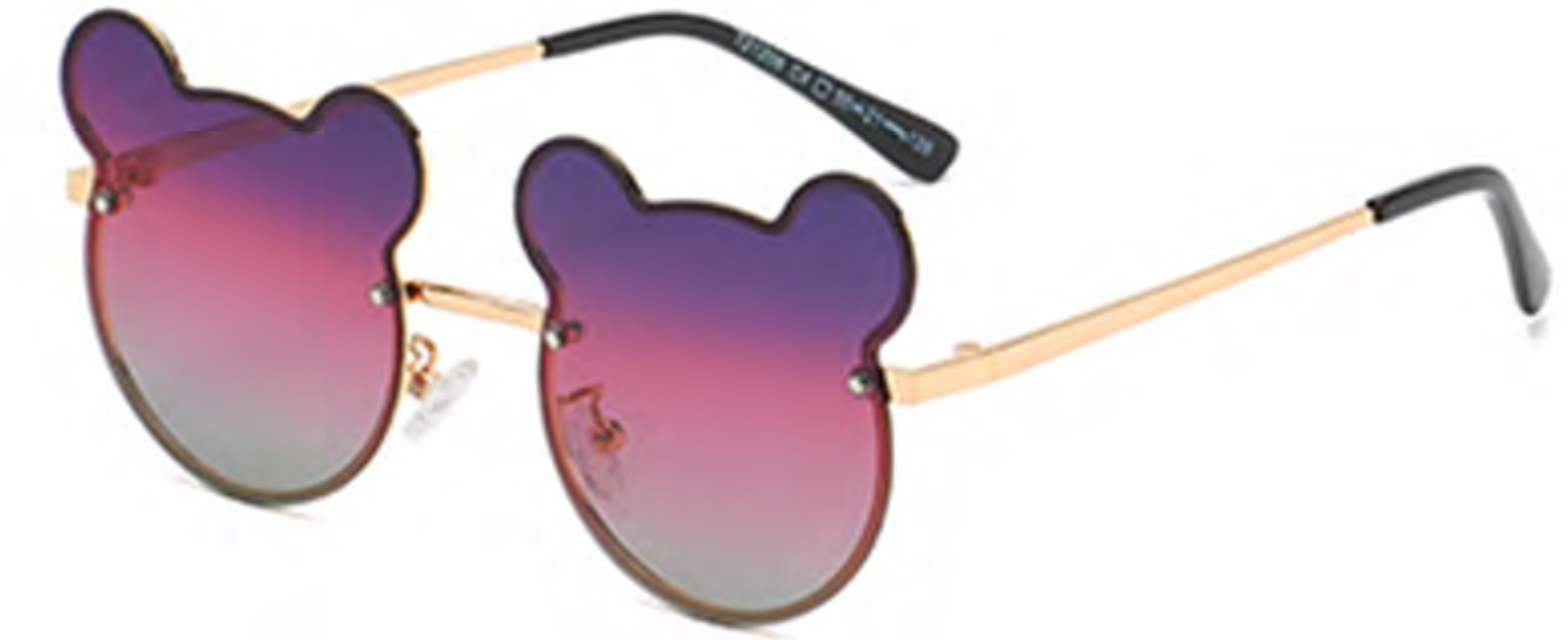
NO.4 C4 金框渐变紫粉