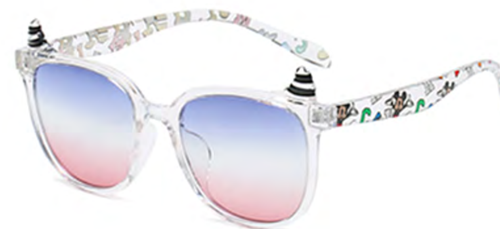
NO.5 T31 透明框蓝粉片