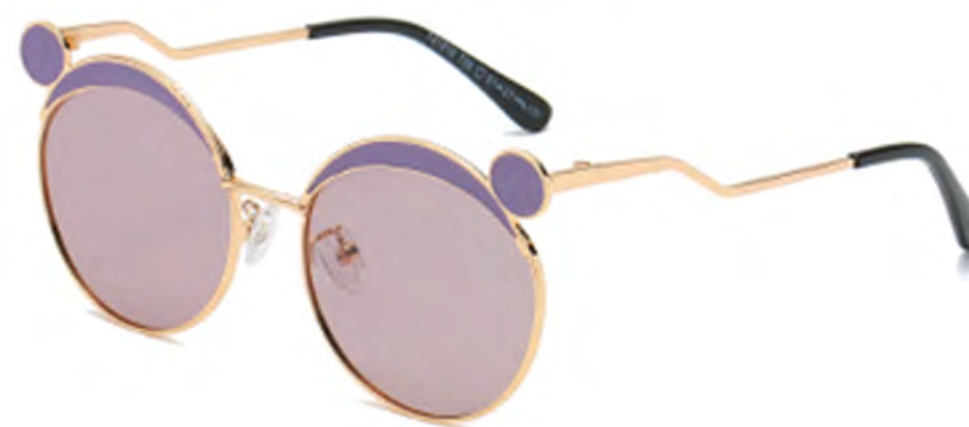
NO.5 T56 金烤紫紫片