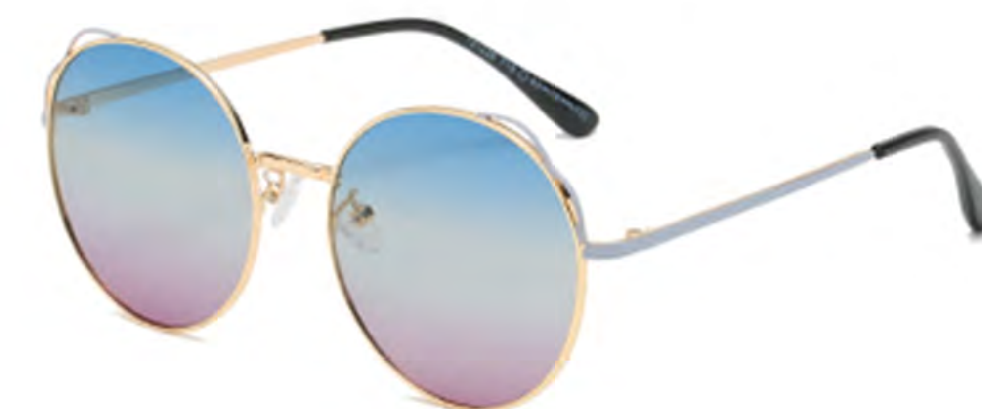
NO.4 T18 金烤灰渐变蓝紫