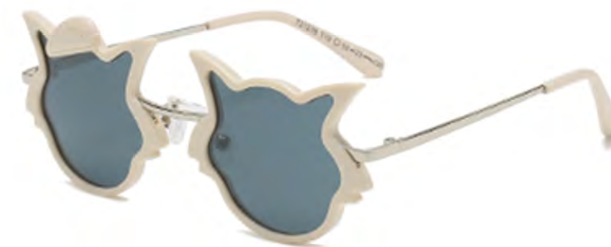
NO.4 T19 米黄灰片