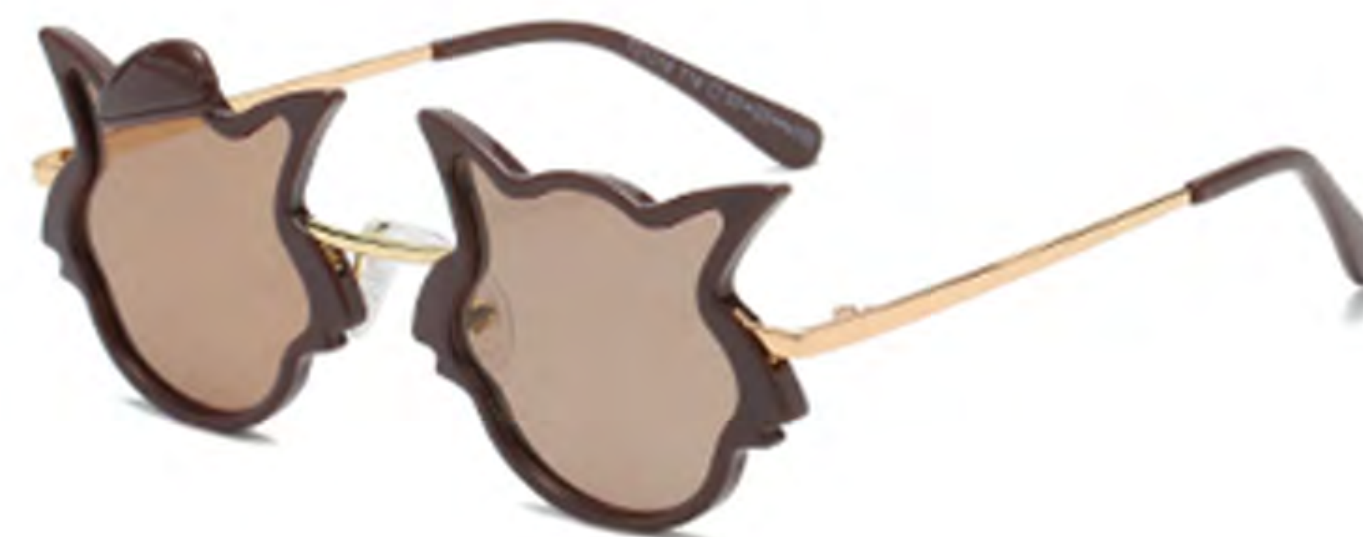
NO.5 T16 咖啡茶片