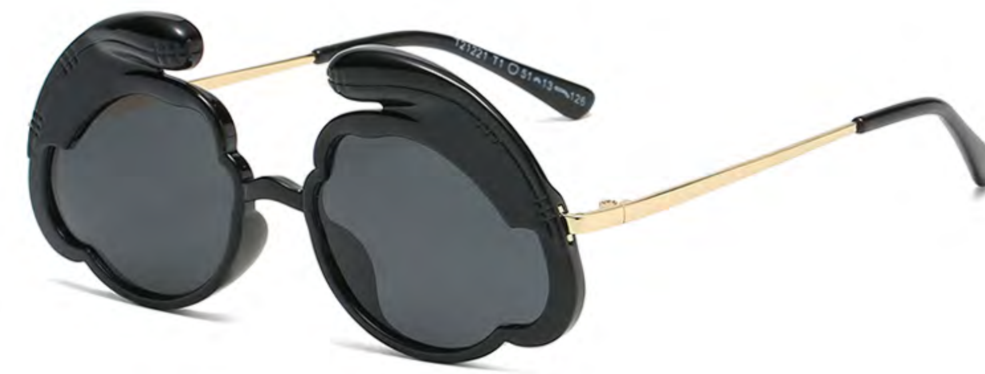
T1 NO.1 亮黑灰片