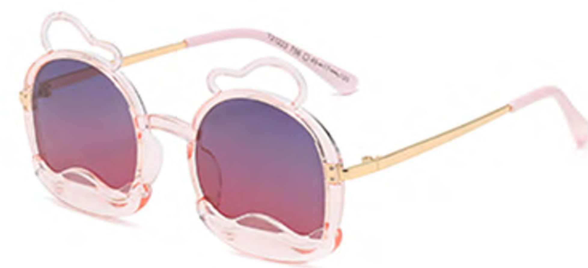
NO.5 T56 透明粉框渐变绿