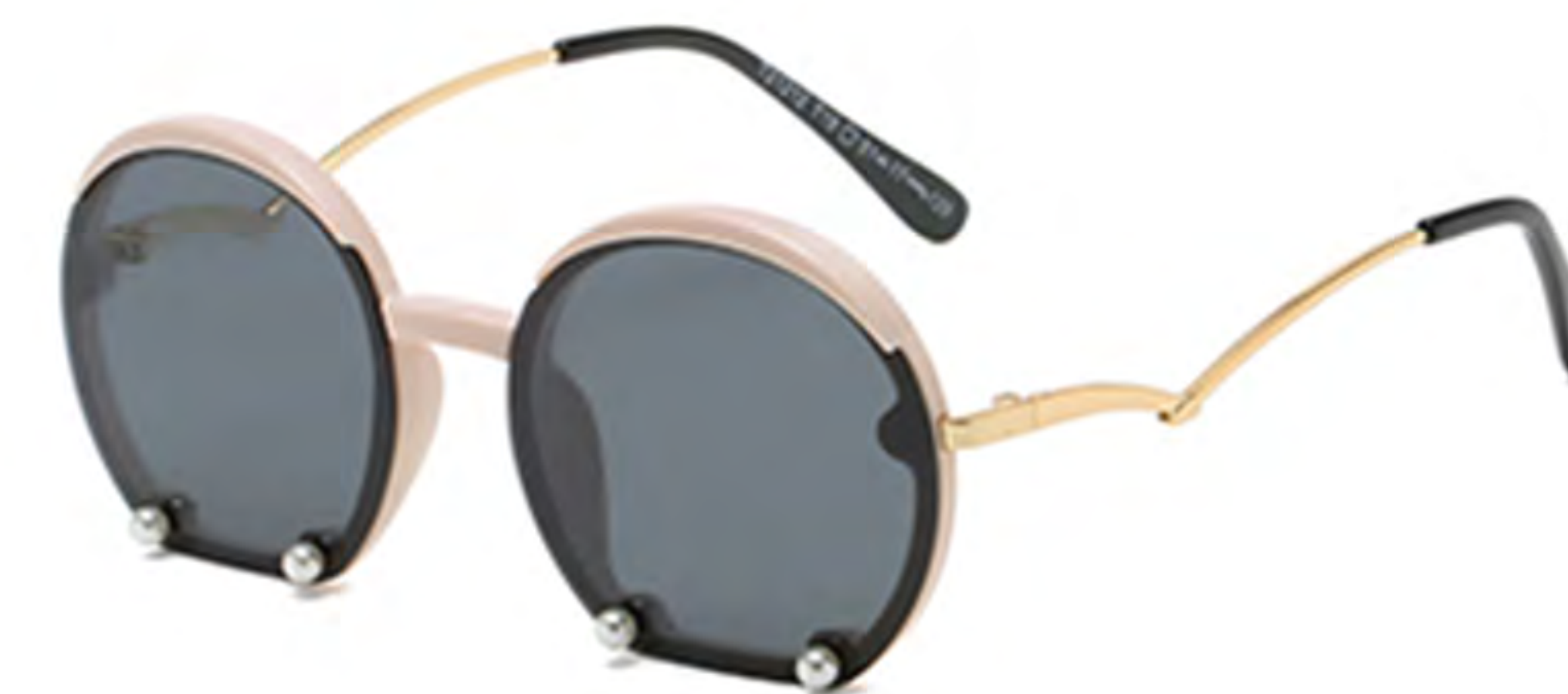
NO.2 T19 米白框灰片