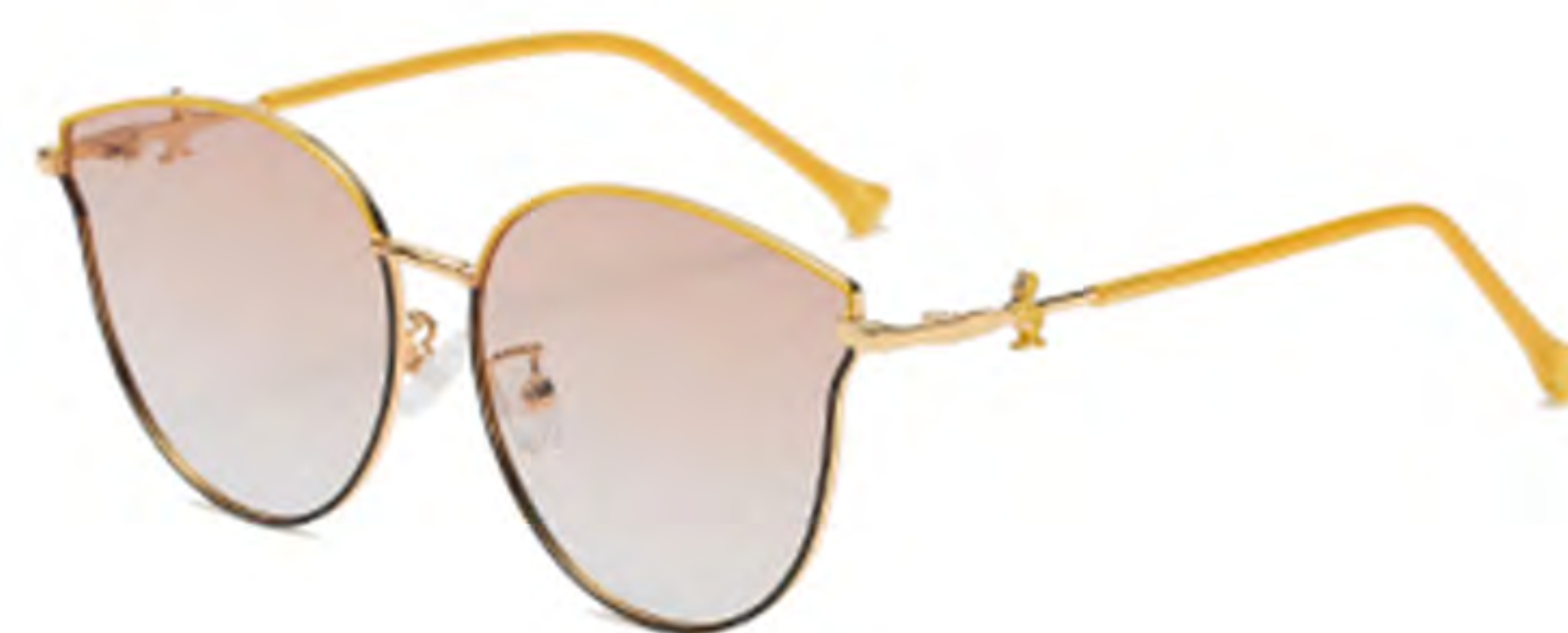
NO.5 T26 上黄下黑渐变茶