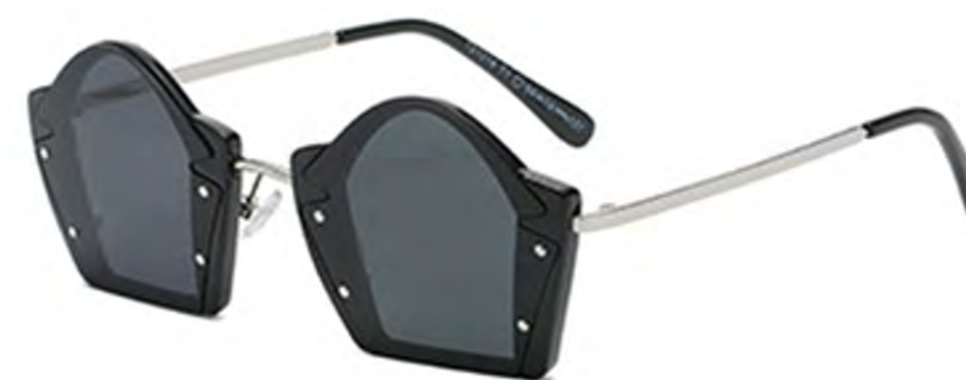
NO.1 T1 亮黑灰