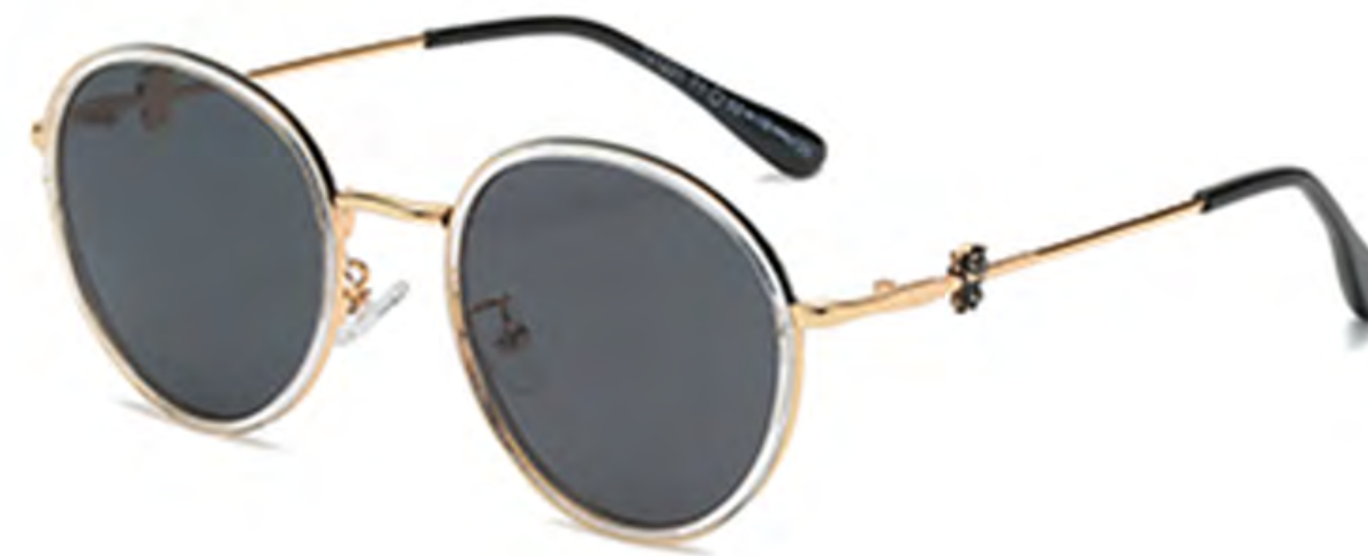
NO.1 T1 金框灰片