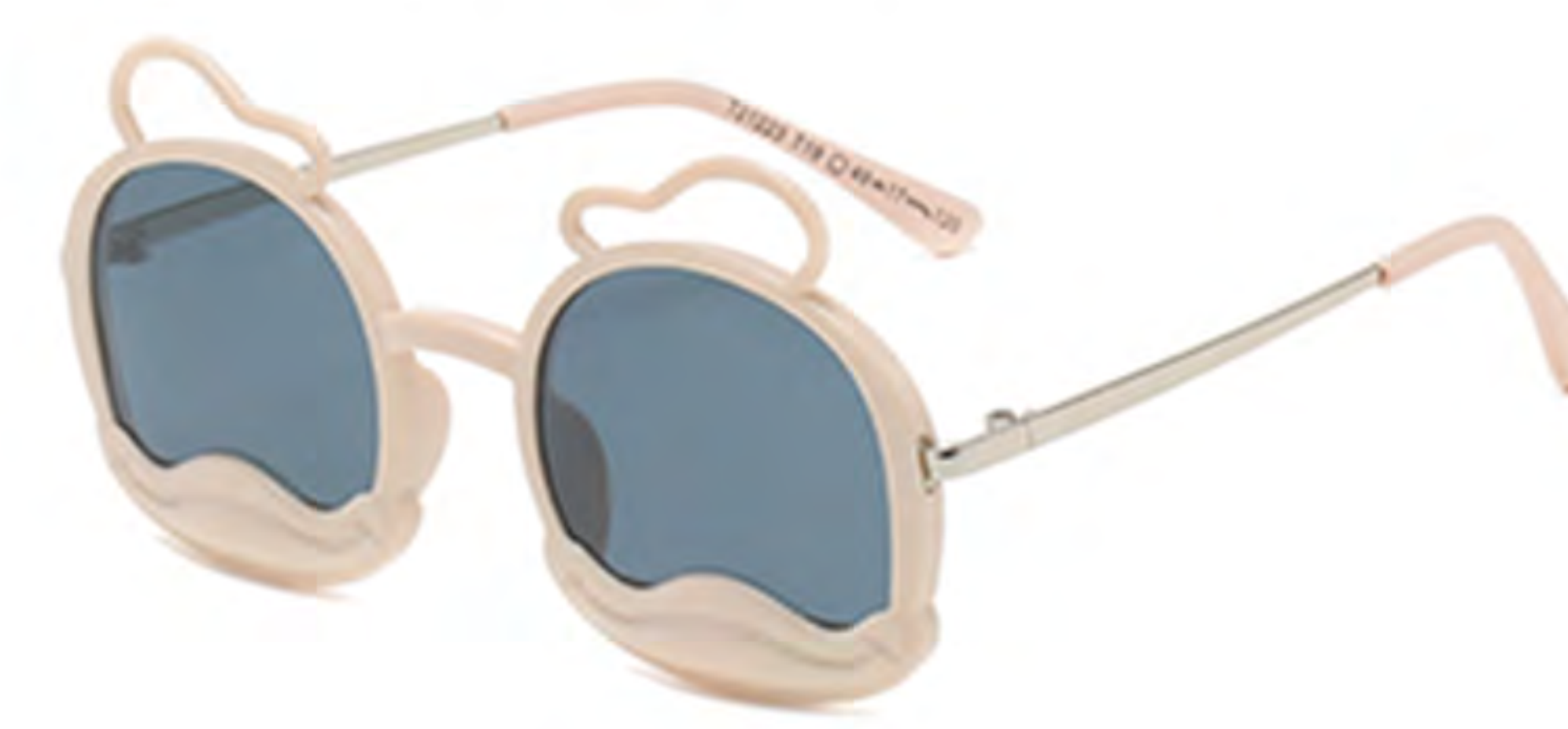
NO.4 T19 米黄框灰片