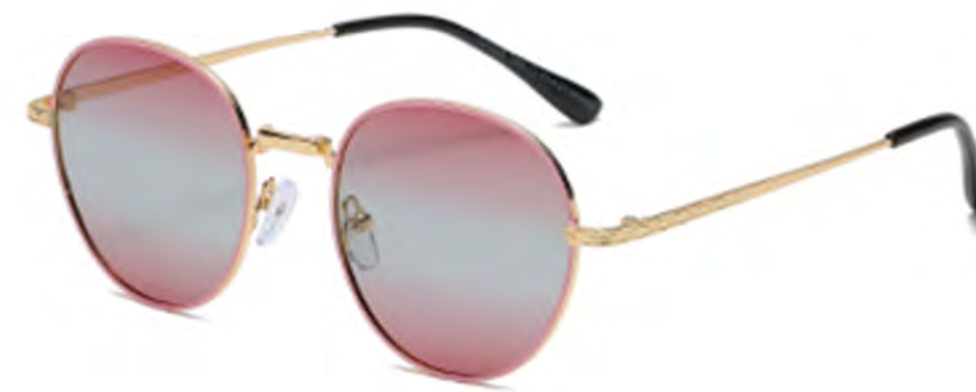
NO.3 T69 金烤裸粉渐变粉