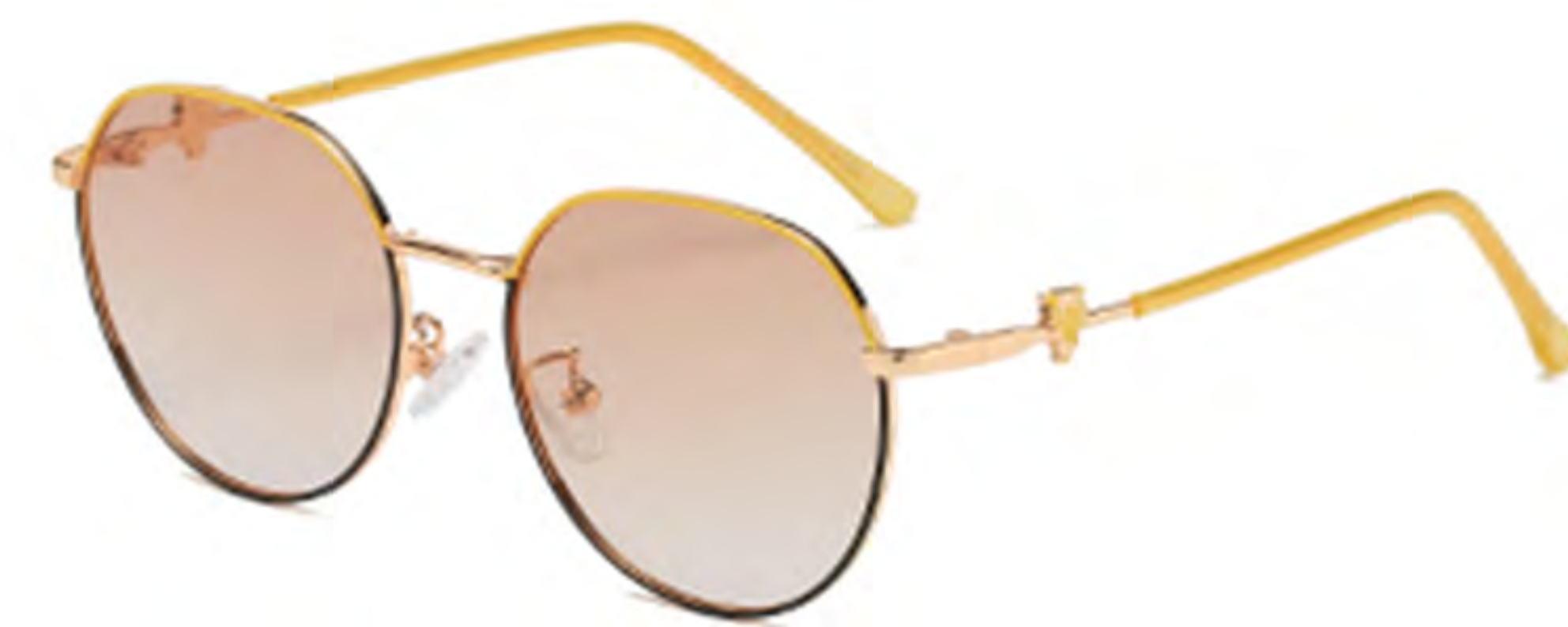
NO.4 T26 上黄下黑黄片