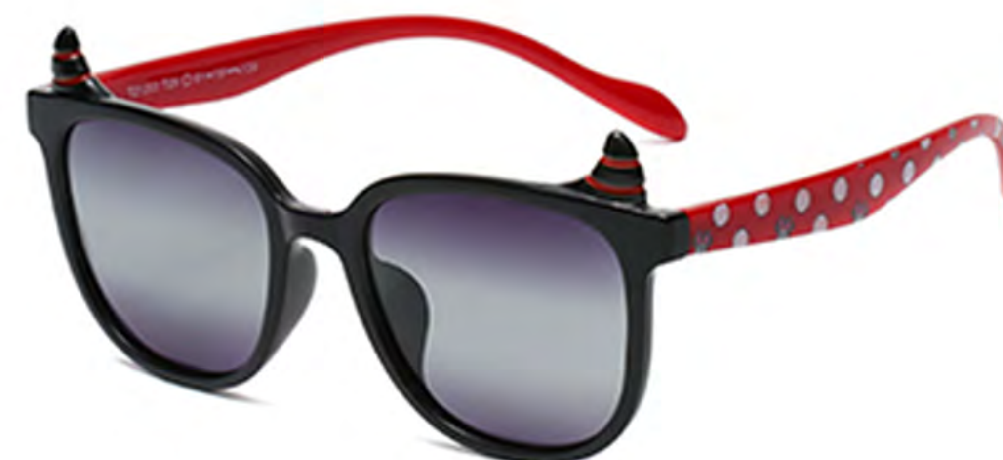
NO.3 T29 黑红渐变灰