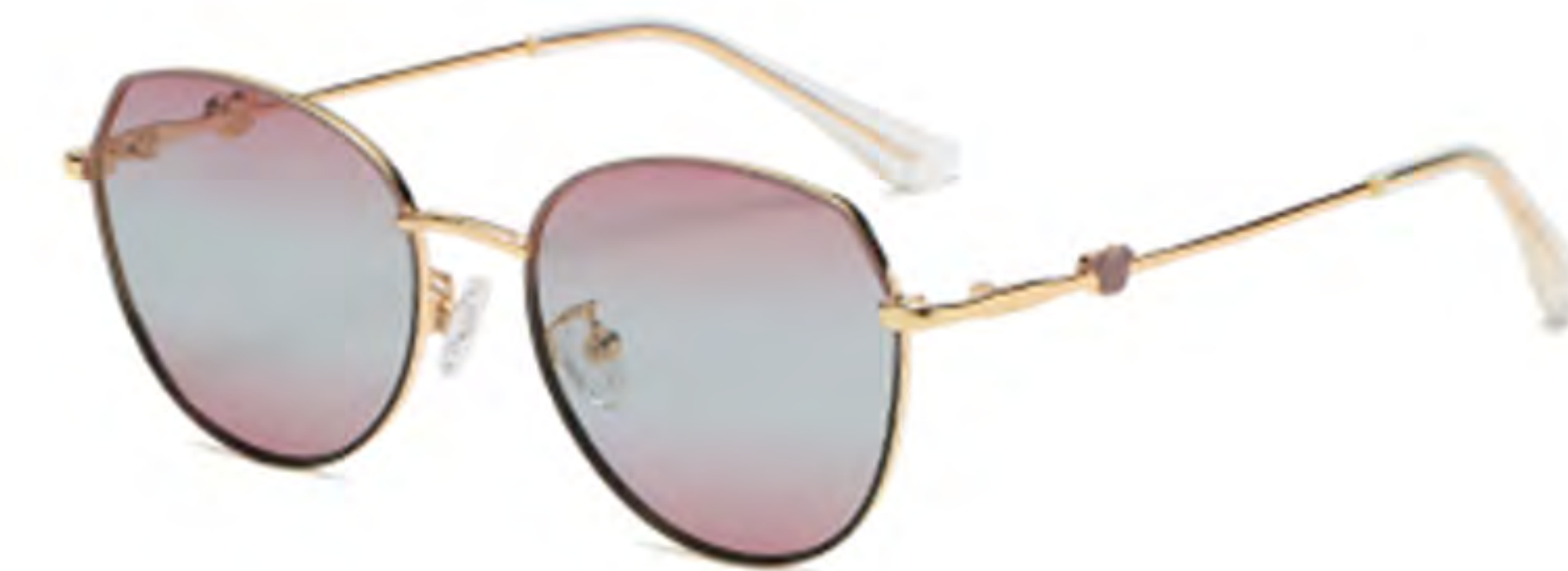
NO.2 T15 上紫下黑渐变紫