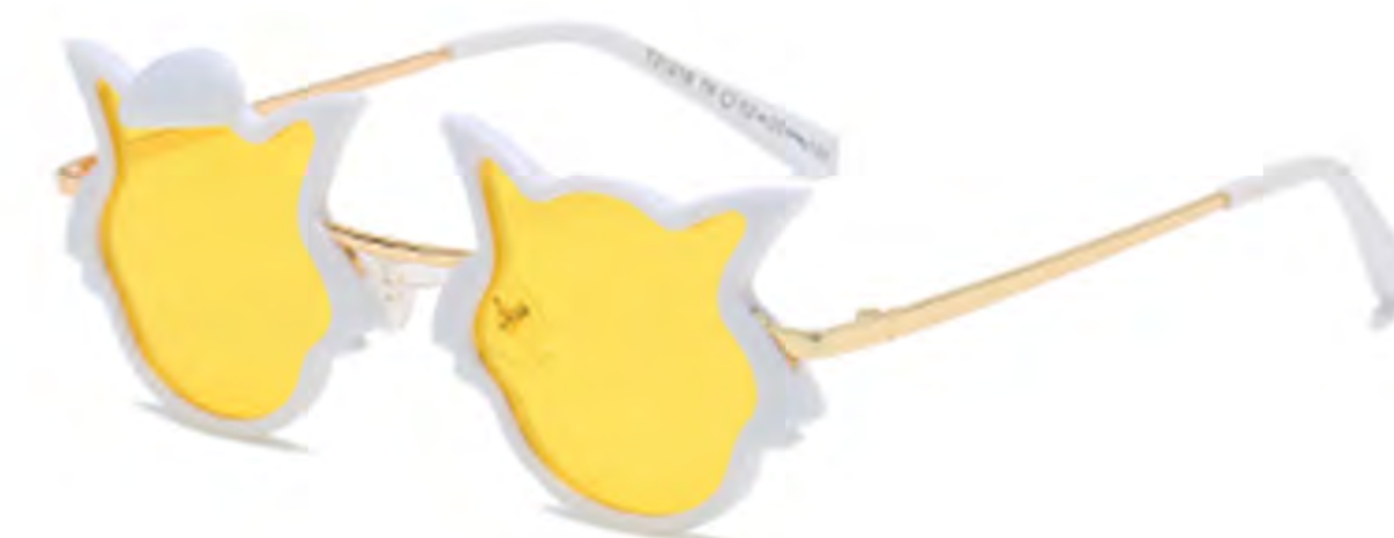
NO.2 T6 白框黄片