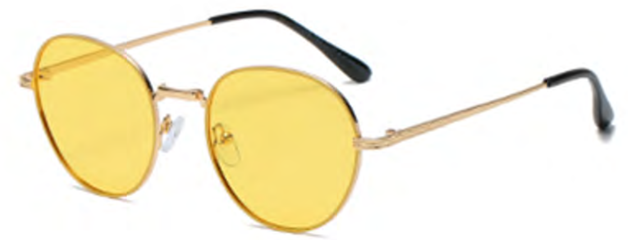
NO.4 T42 金烤黄黄片