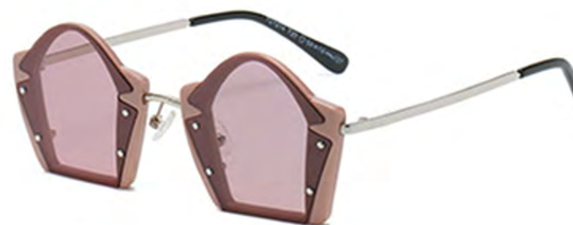
NO.5 T20 咖啡紫片