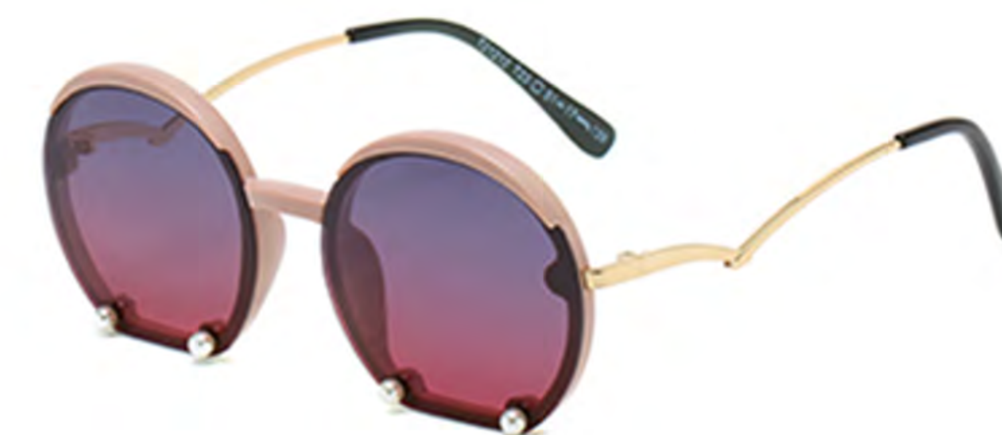
NO.4 T23 藕粉渐变粉