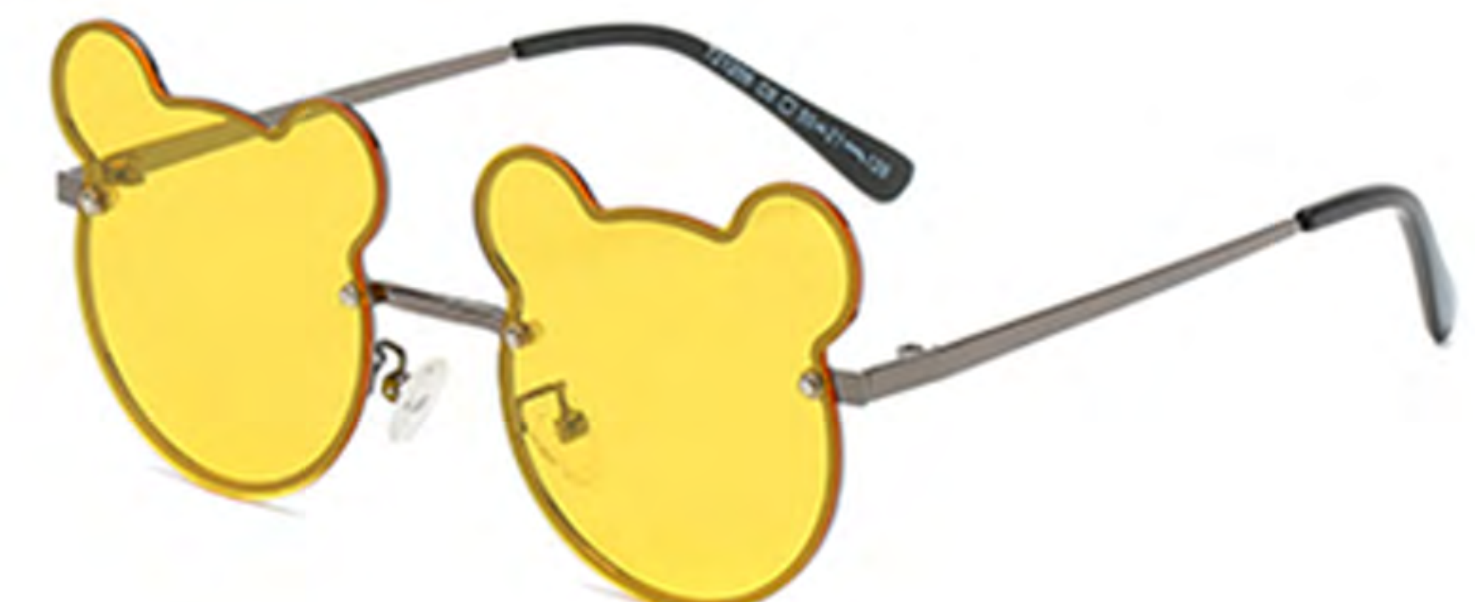
NO.6 C6 枪框黄片