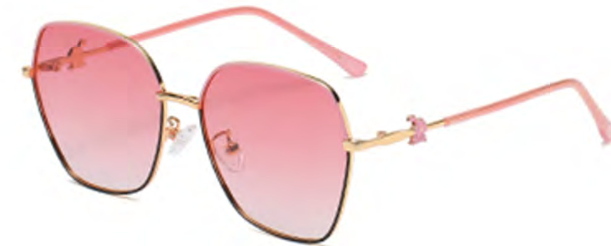
NO.4 T14 上粉下黑粉片