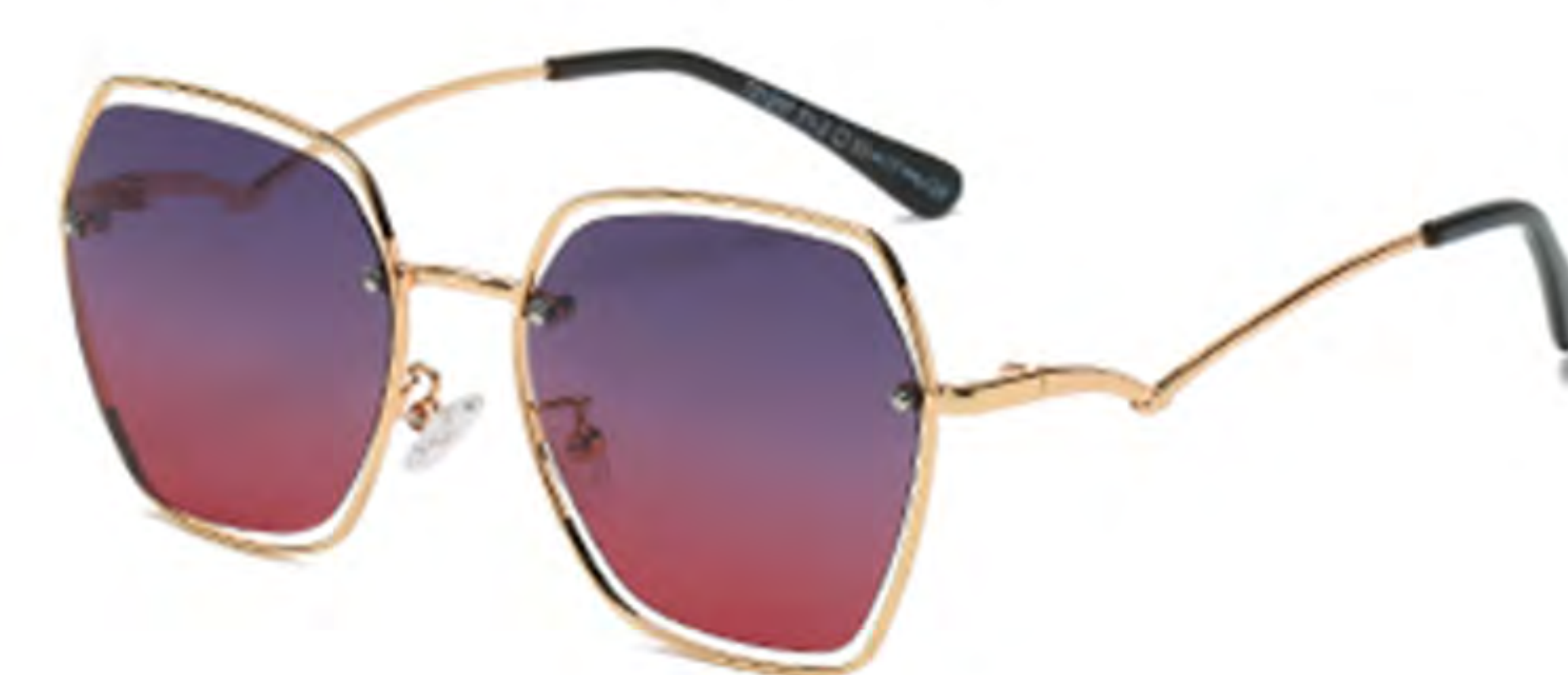
NO.4 T1-2 金框渐变红