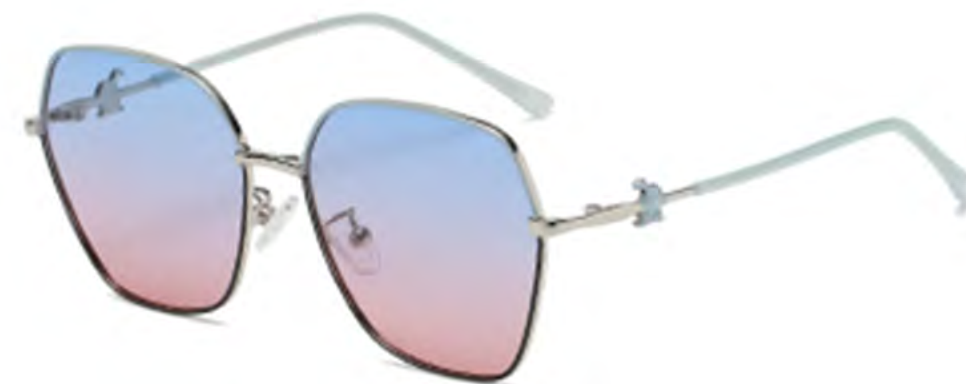
NO.3 T16 上蓝下黑渐变蓝粉