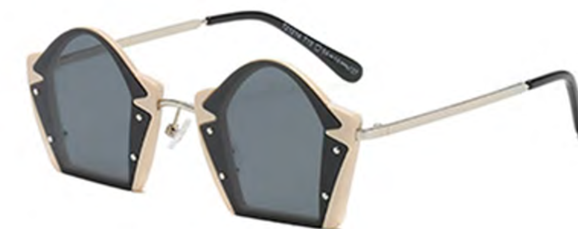
NO.2 T19 米白框灰片