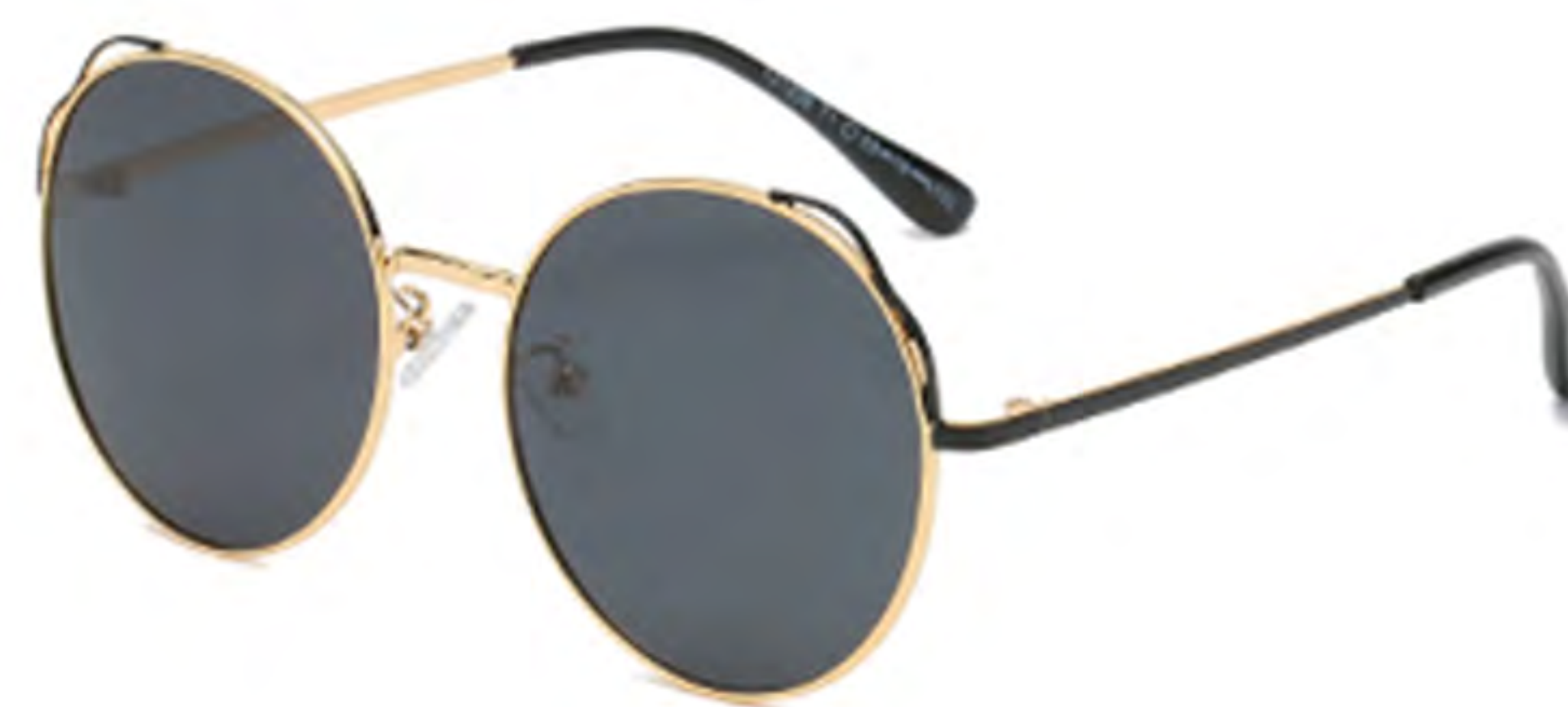
NO.1 T1 金烤黑灰片