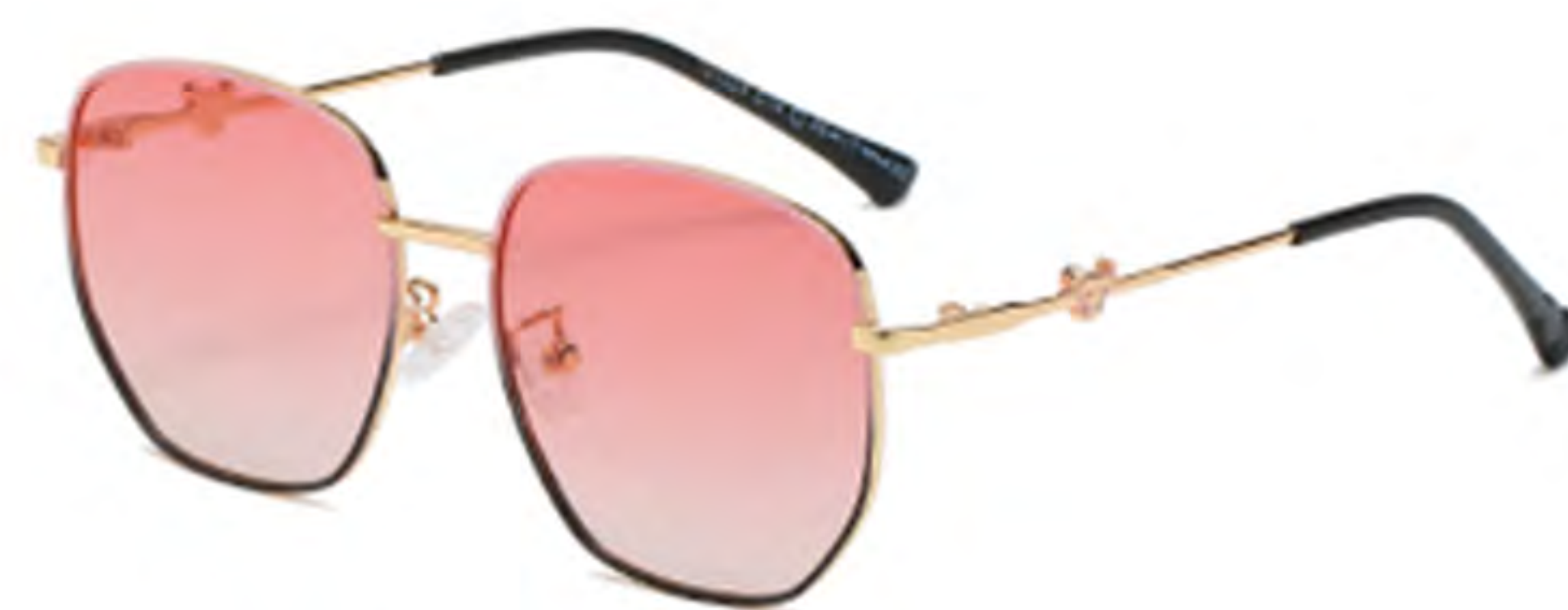
NO.3 T14 上粉下黑粉片