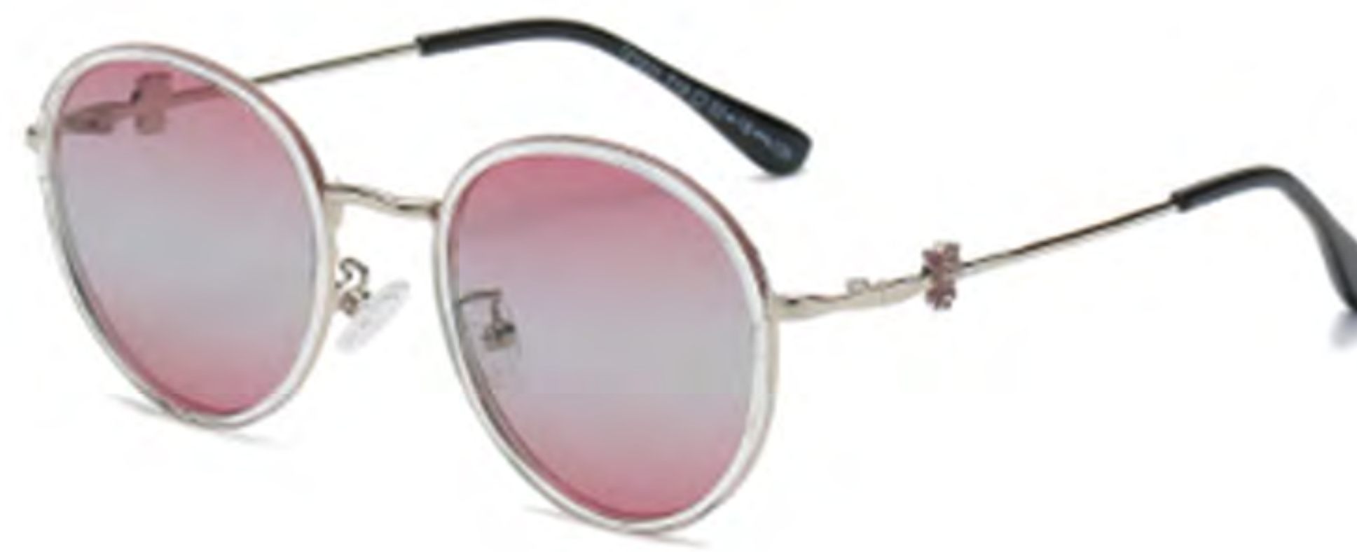
NO.5 T19 银框渐变紫