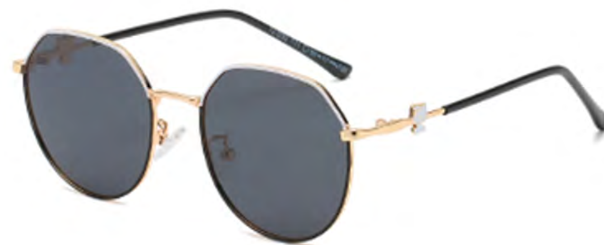
NO.1 T71 上白下黑灰片