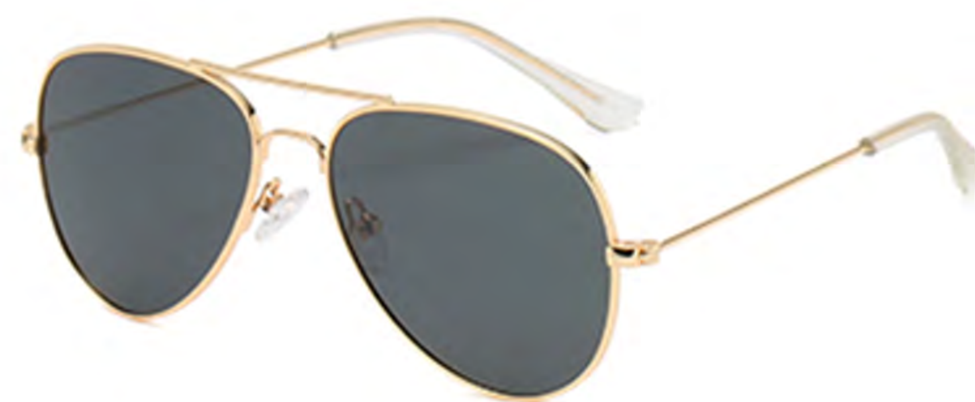
NO.1 T1 金框灰片