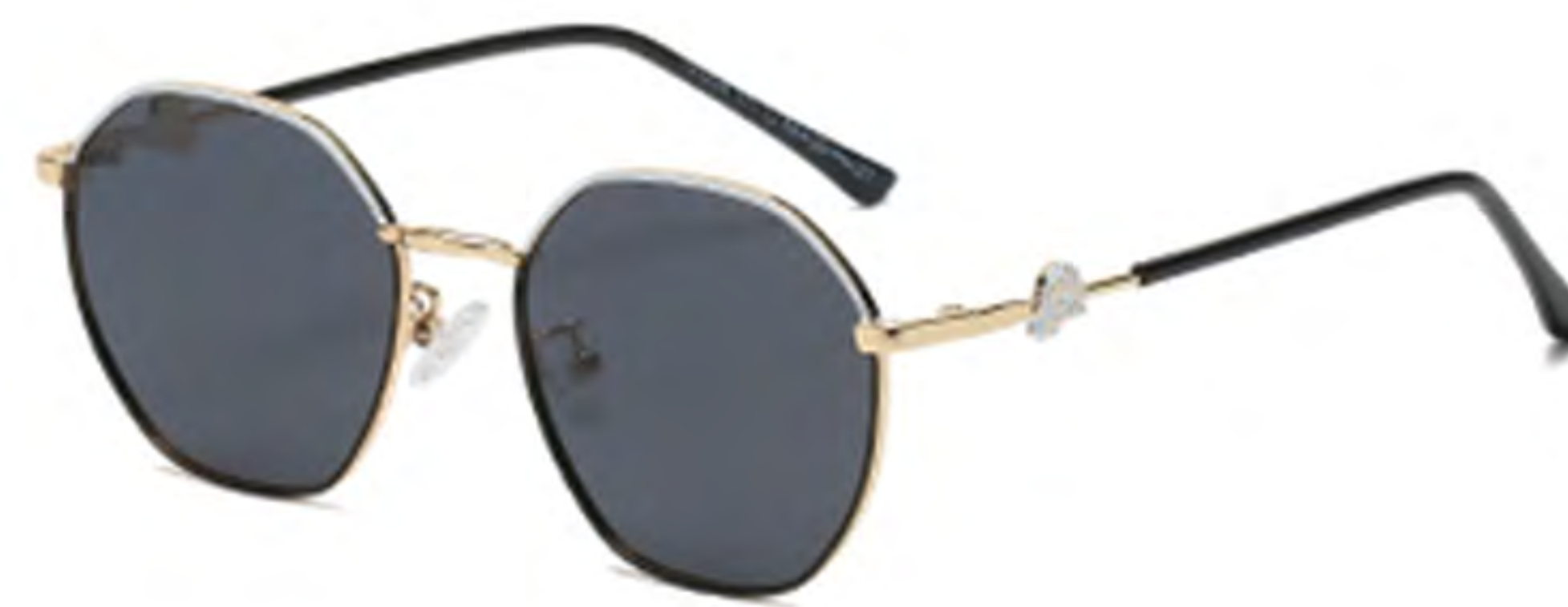
NO.1 T71 上白下黑灰片