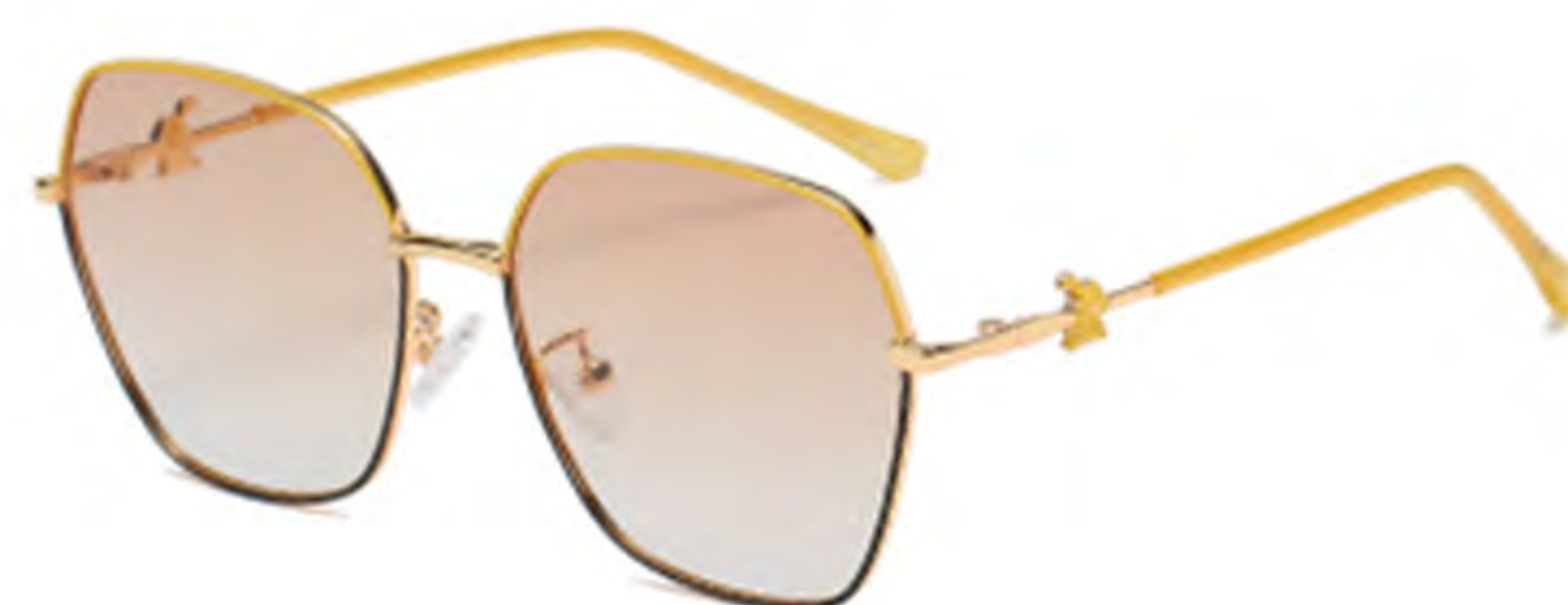
NO.5 T26 上黄下黑渐变茶