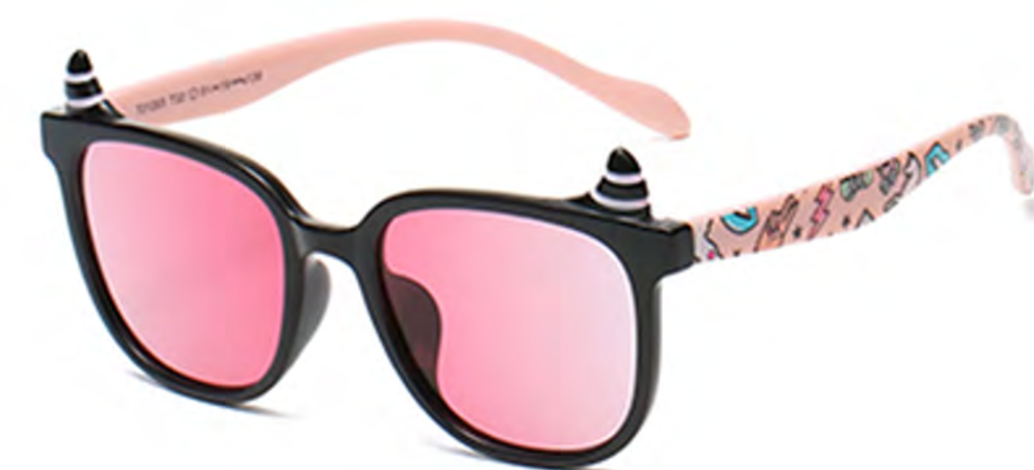
NO.2 T32 黑粉粉片