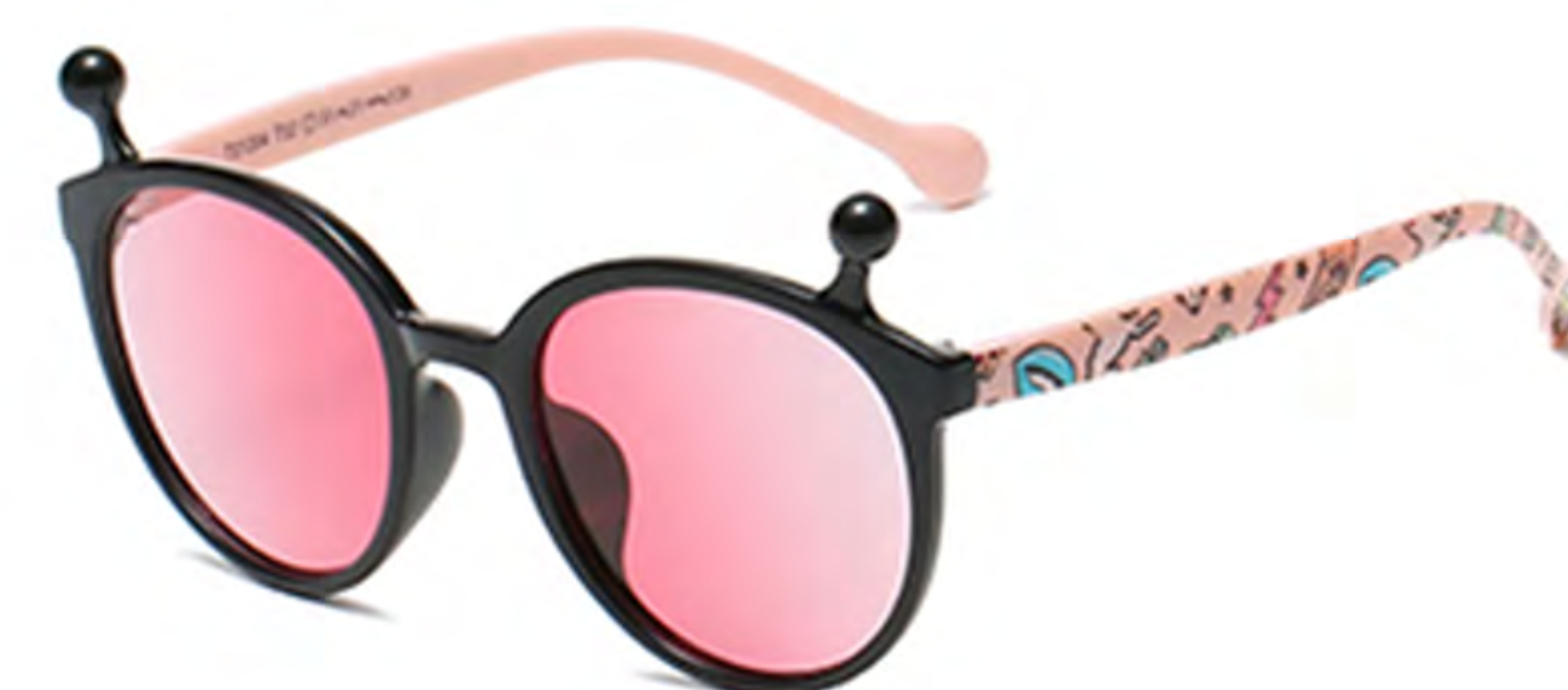
NO.2 T32 亮黑粉片