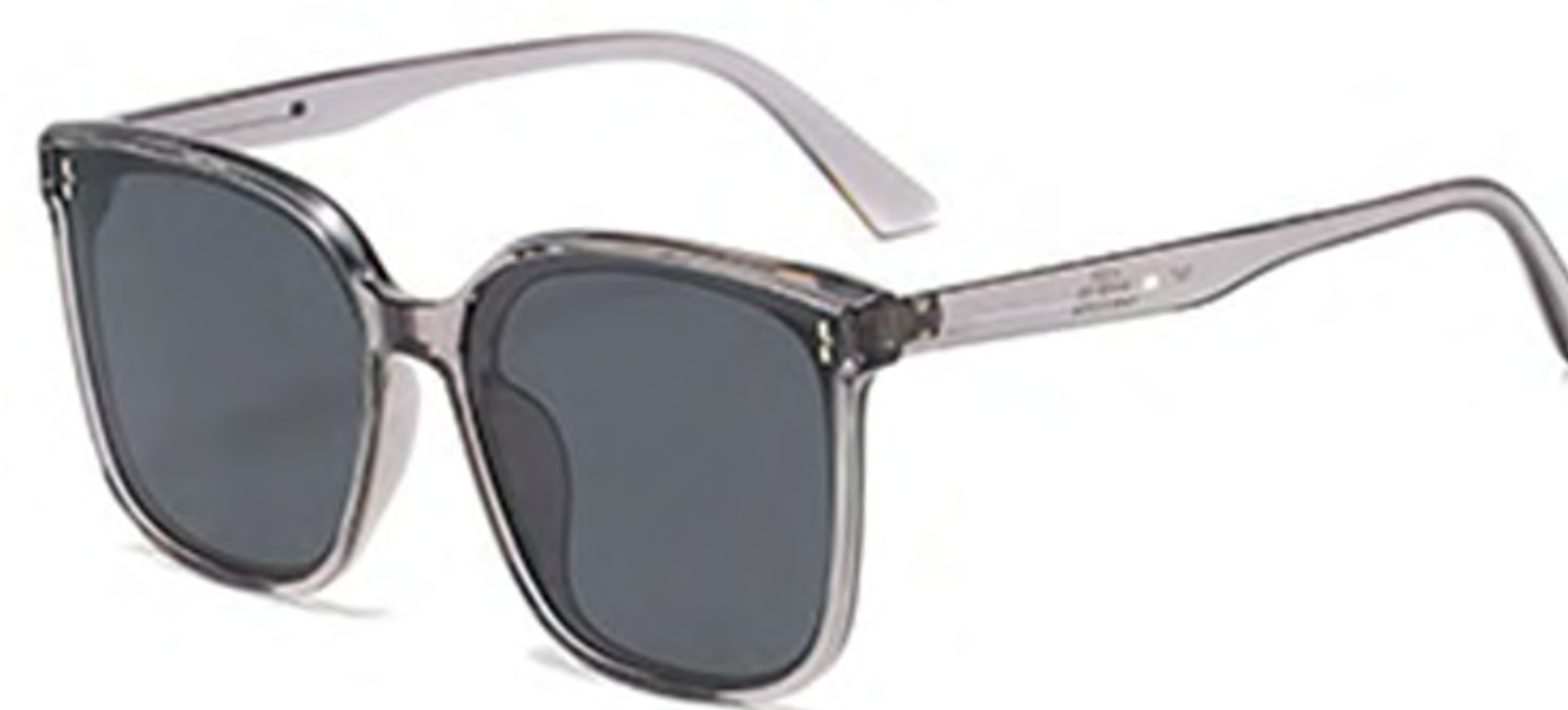
NO.3 T67 透明框灰片