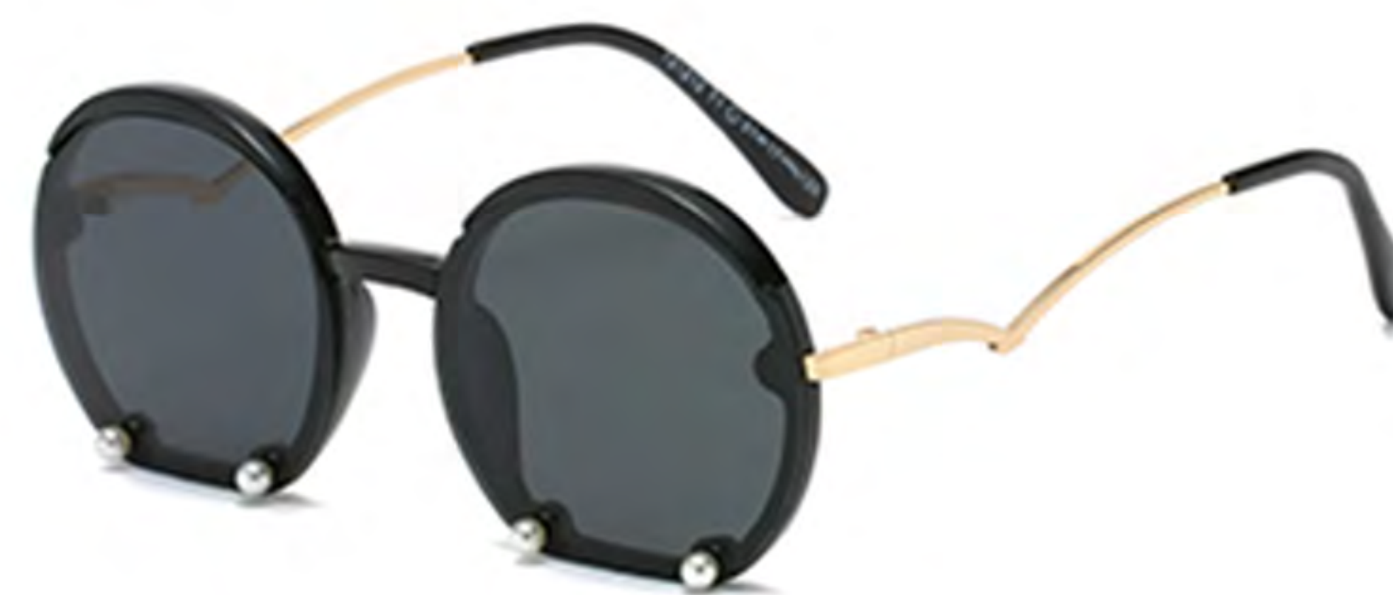
NO.1 T1 亮黑灰