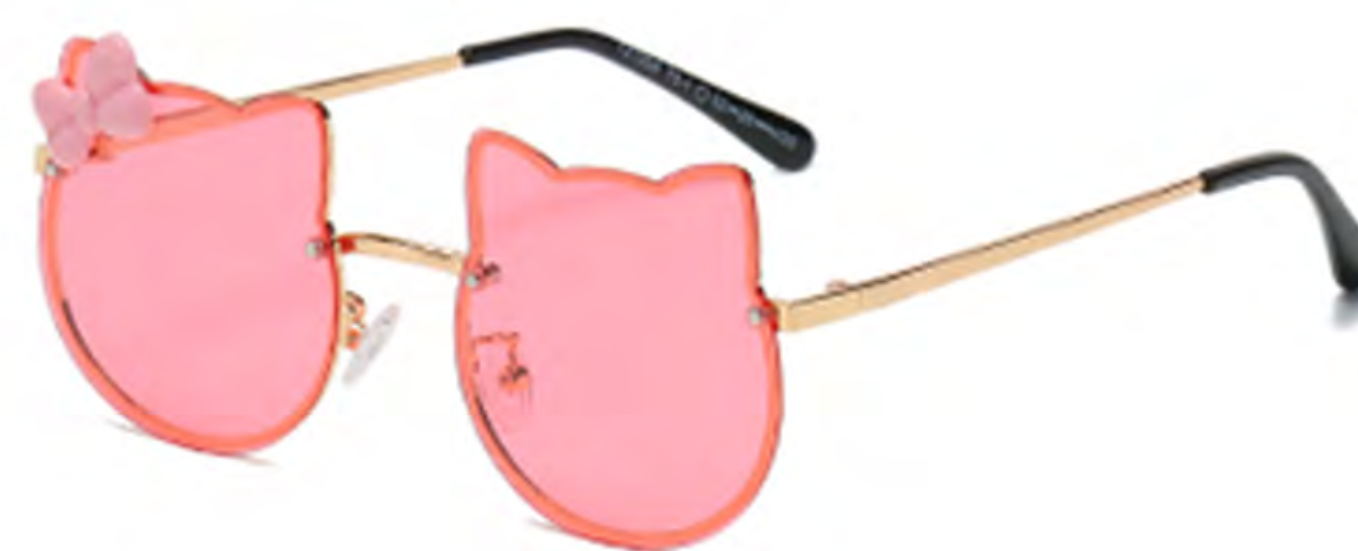
NO.5 T5-1 金框粉片