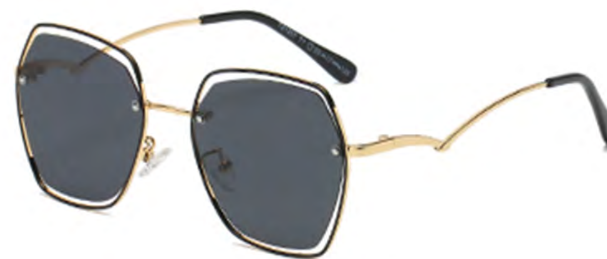
NO.1 T1 金烤黑灰片