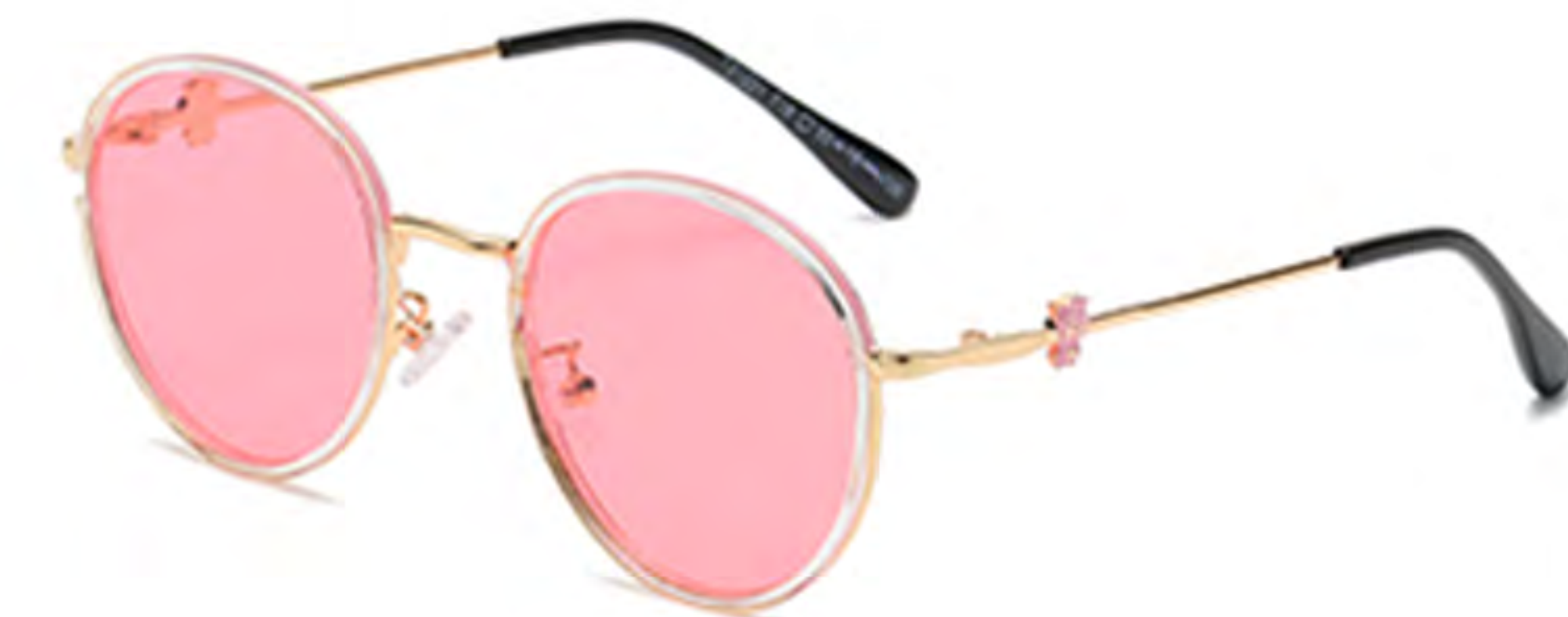
NO.4 T18 金框粉片