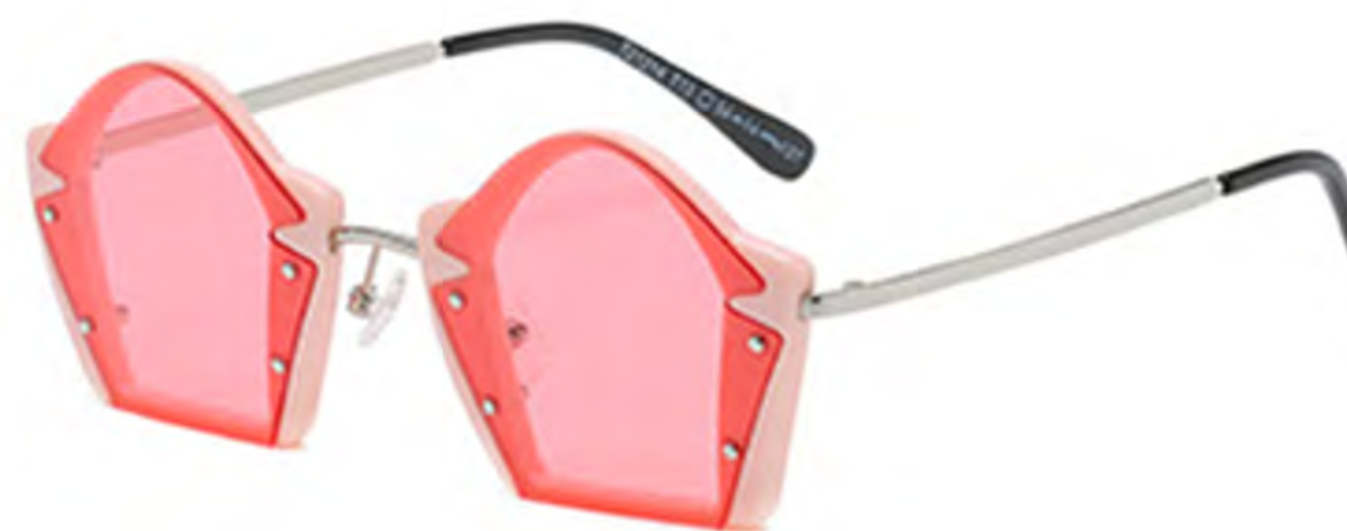
NO.3 T13 粉框粉片