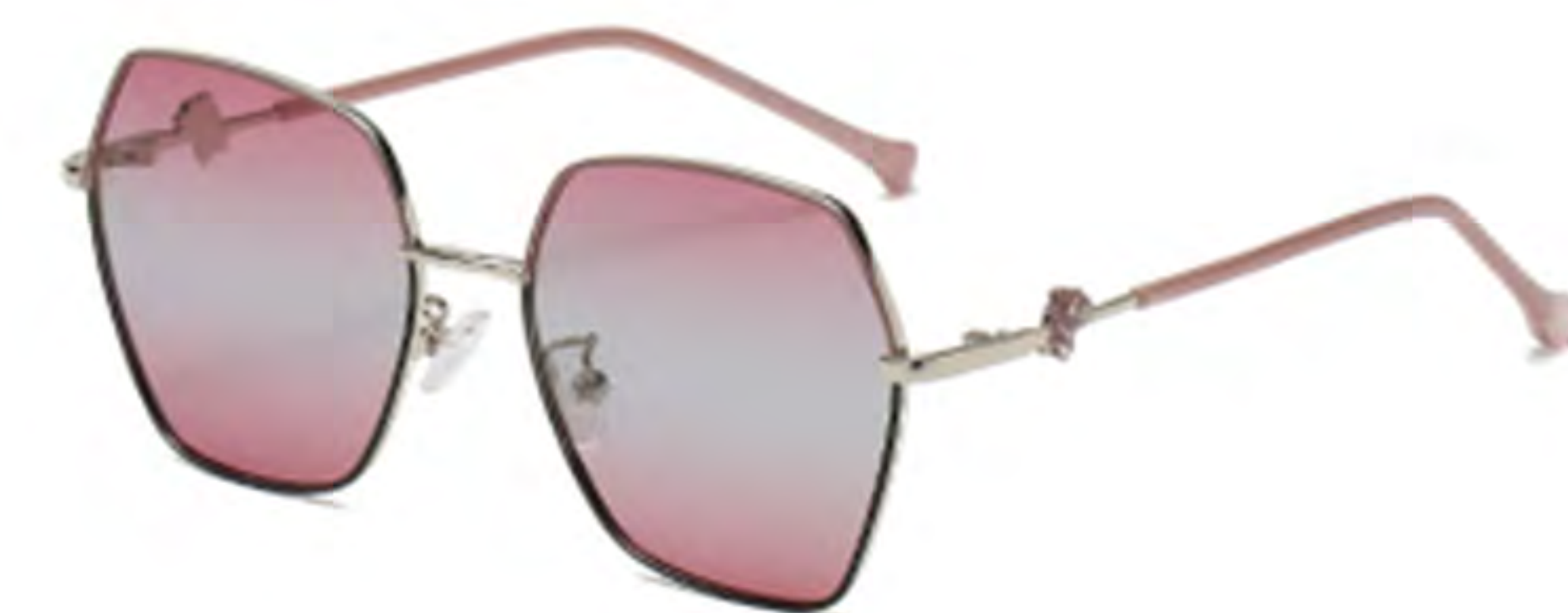
NO.2 T15 上藕粉下黑渐变紫