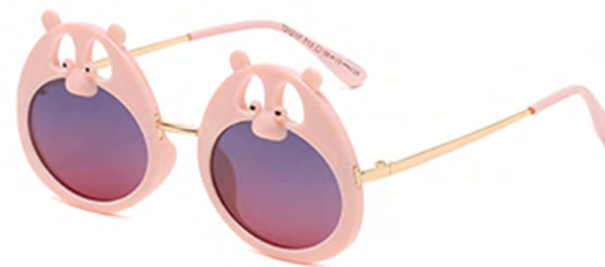
NO.5 T13 裸粉渐变粉