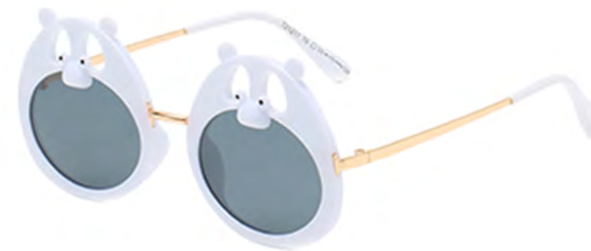
NO.3 T6 白框灰片