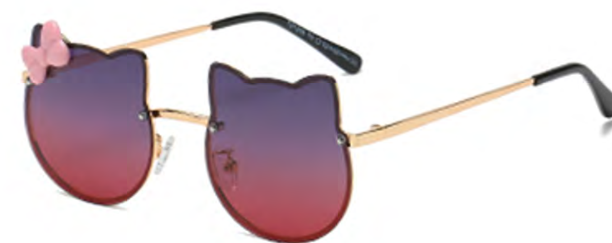
NO.2 T5 金框渐变灰纤