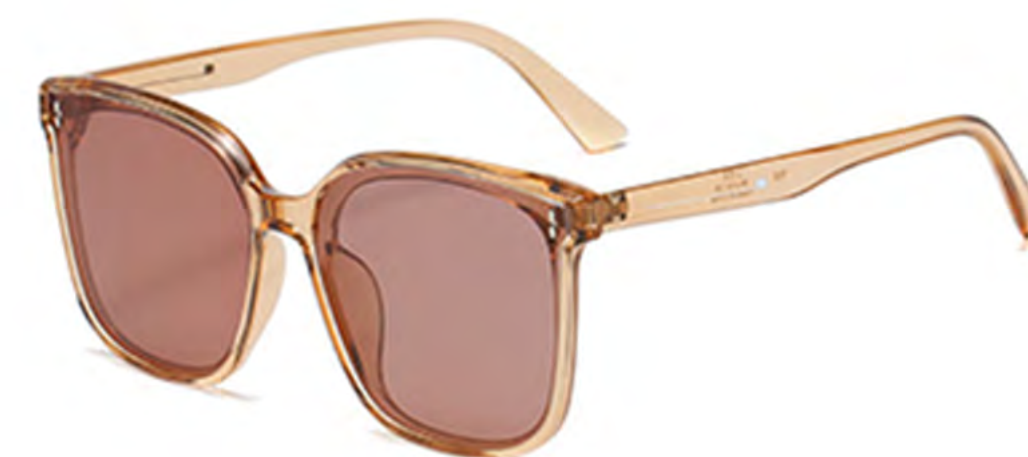
NO.2 T68 茶框茶片