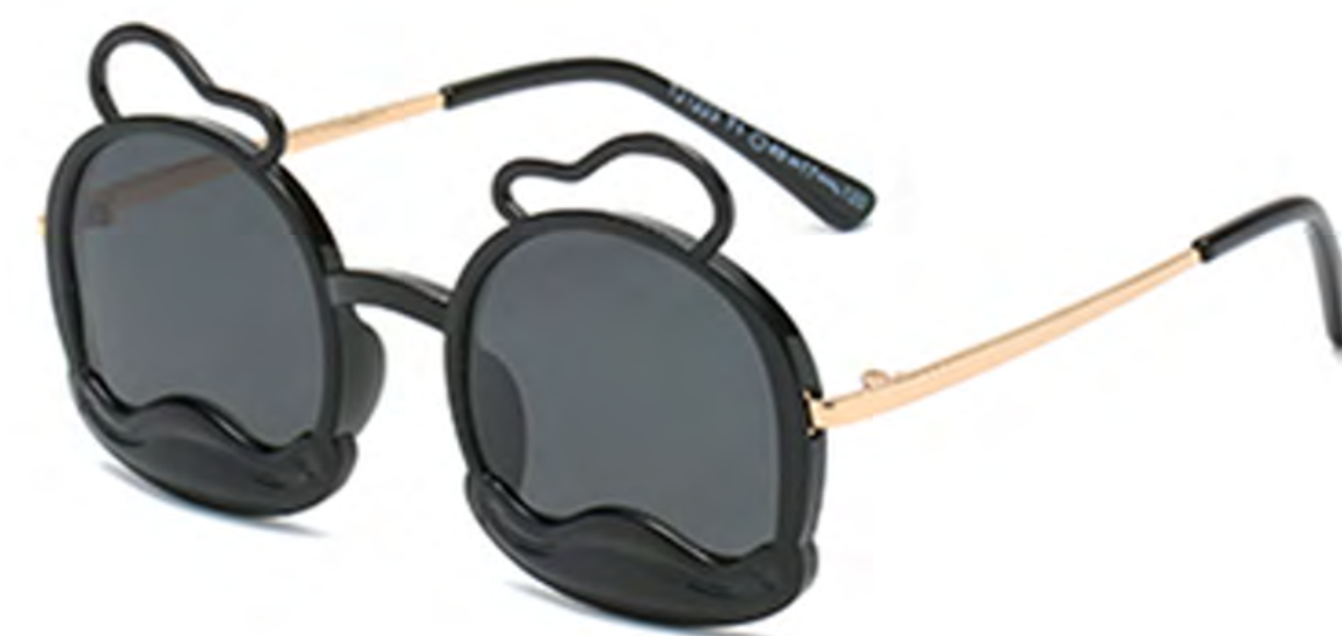
NO.1 T1 亮黑灰片