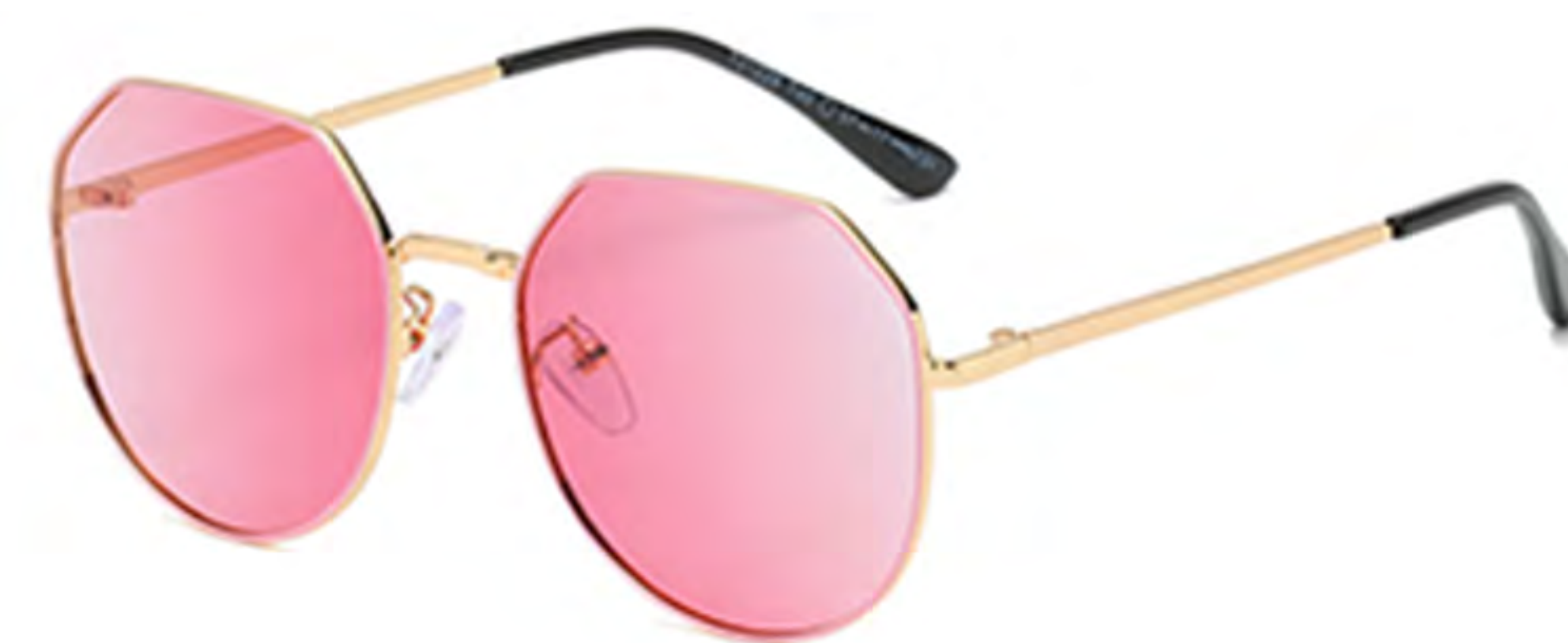
NO.5 T40 金烤粉粉片