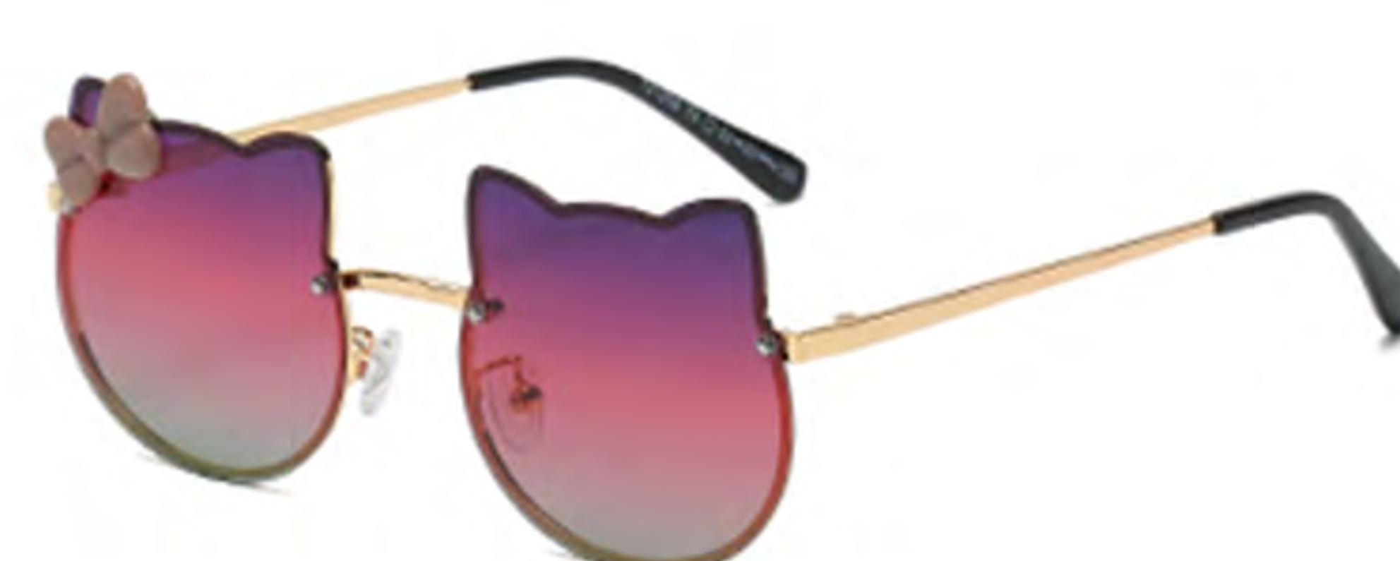
NO.4 T8 金框渐变紫粉