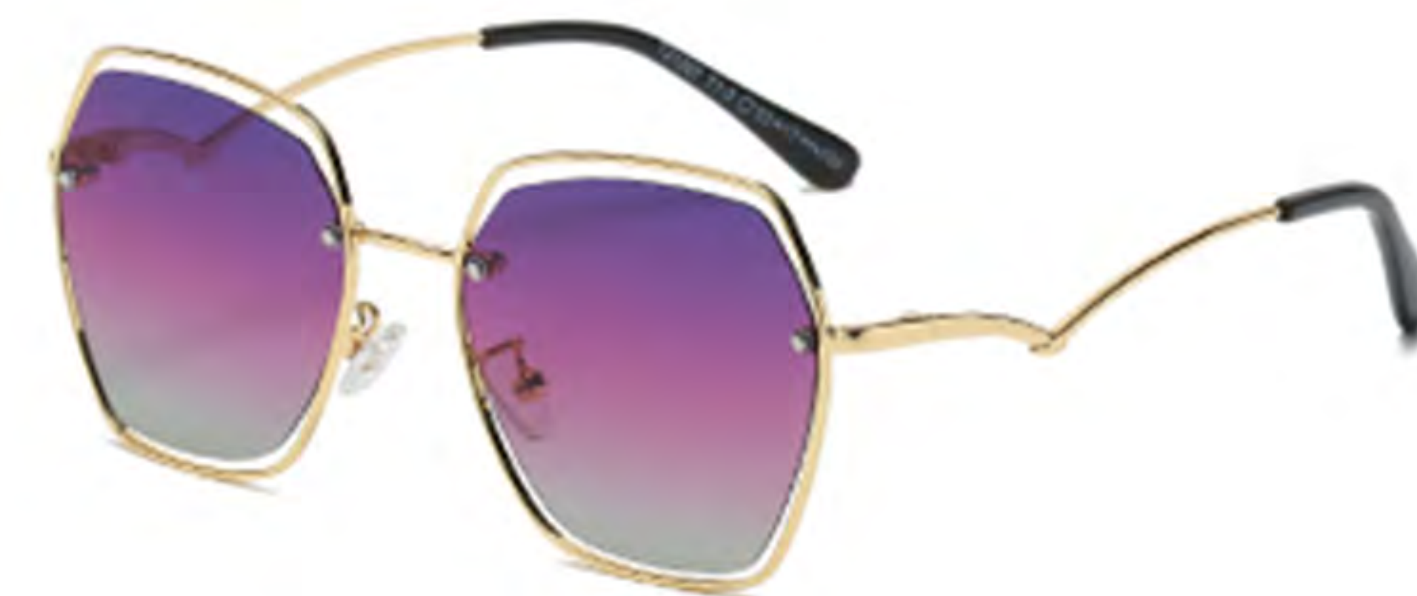
NO.2 T1-3 金框渐变紫