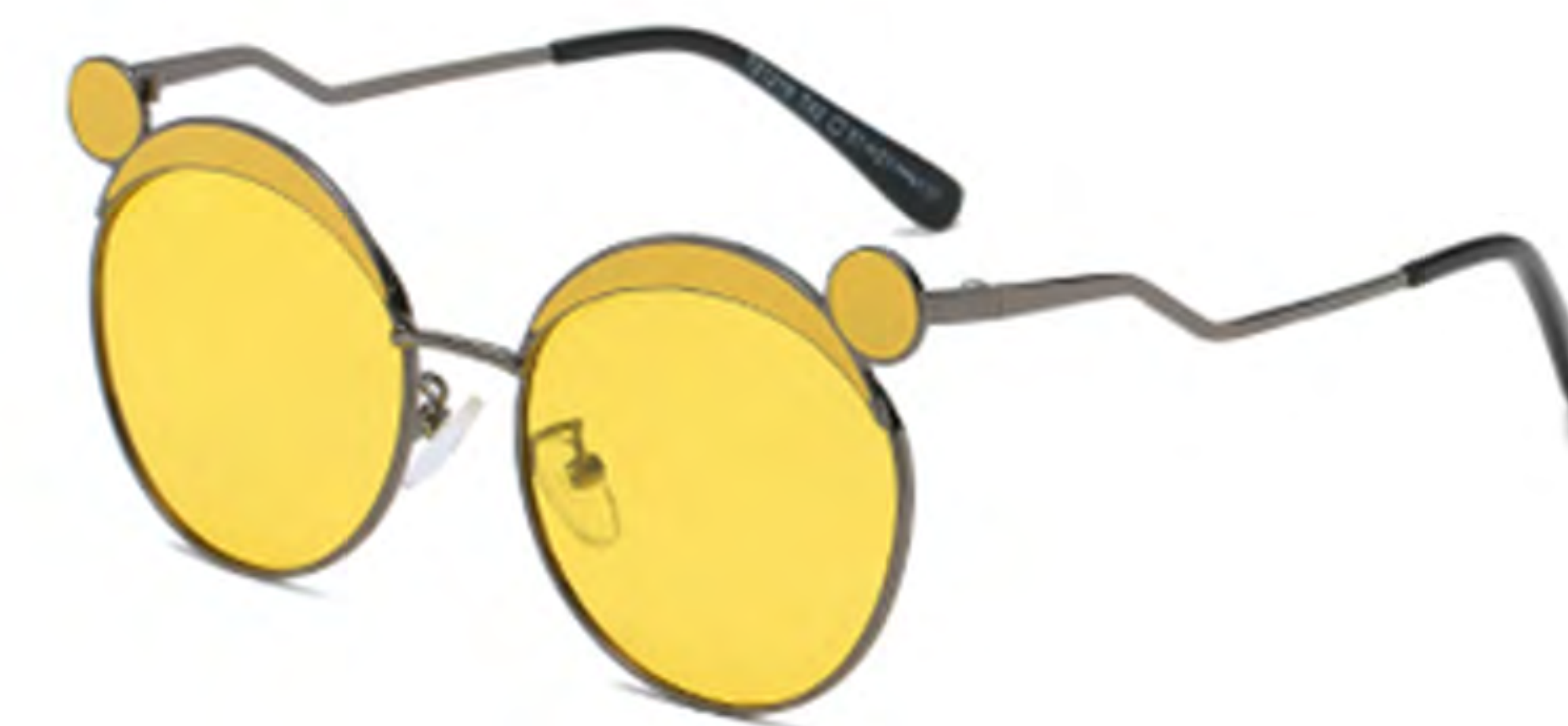
NO.2 T42 枪烤黄黄片