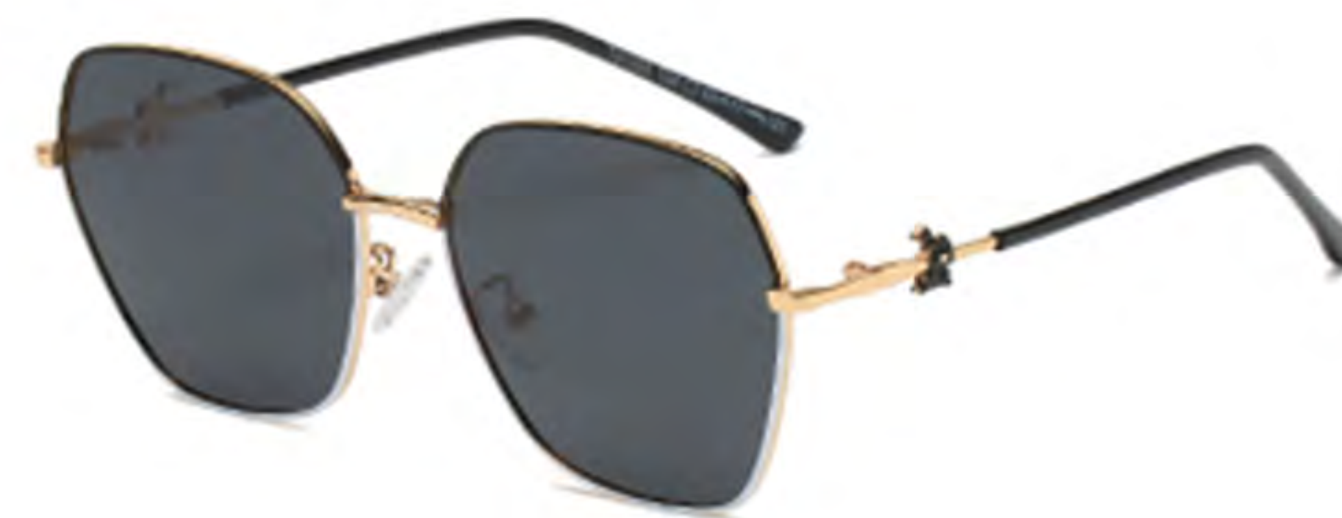
NO.1 T22 上黑下白灰片