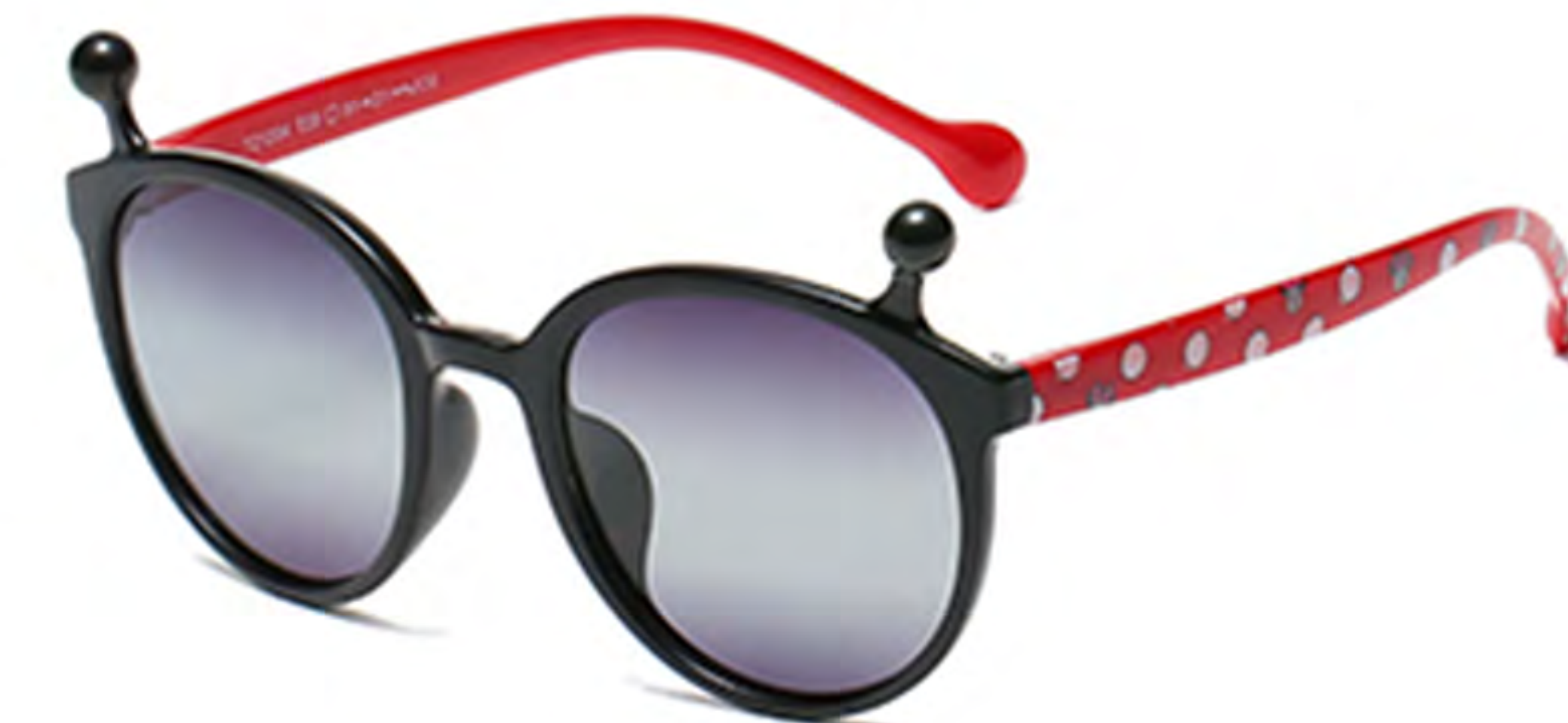
NO.4 T29 亮黑渐灰