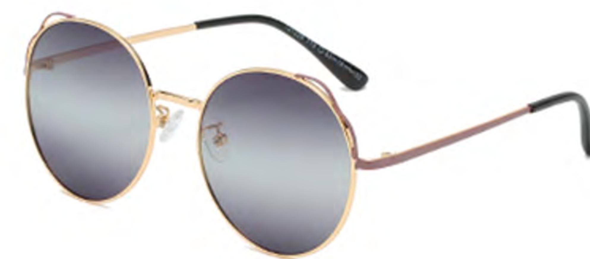
NO.2 T19 金烤咖啡渐变灰