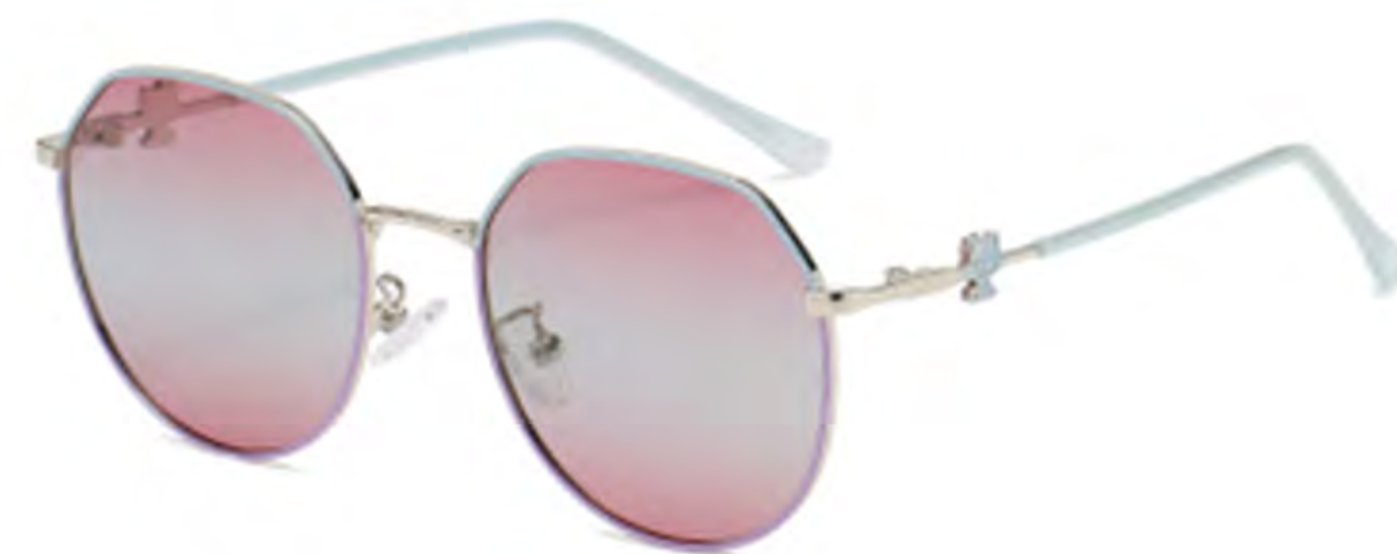
NO.5 T24 上蓝下紫渐变紫