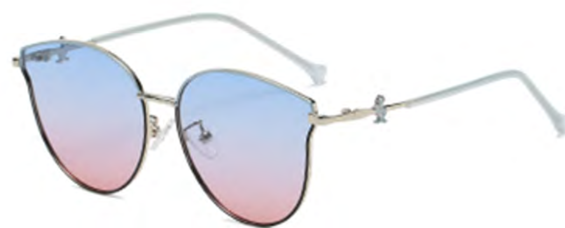
NO.3 T16 上蓝下黑渐变蓝粉