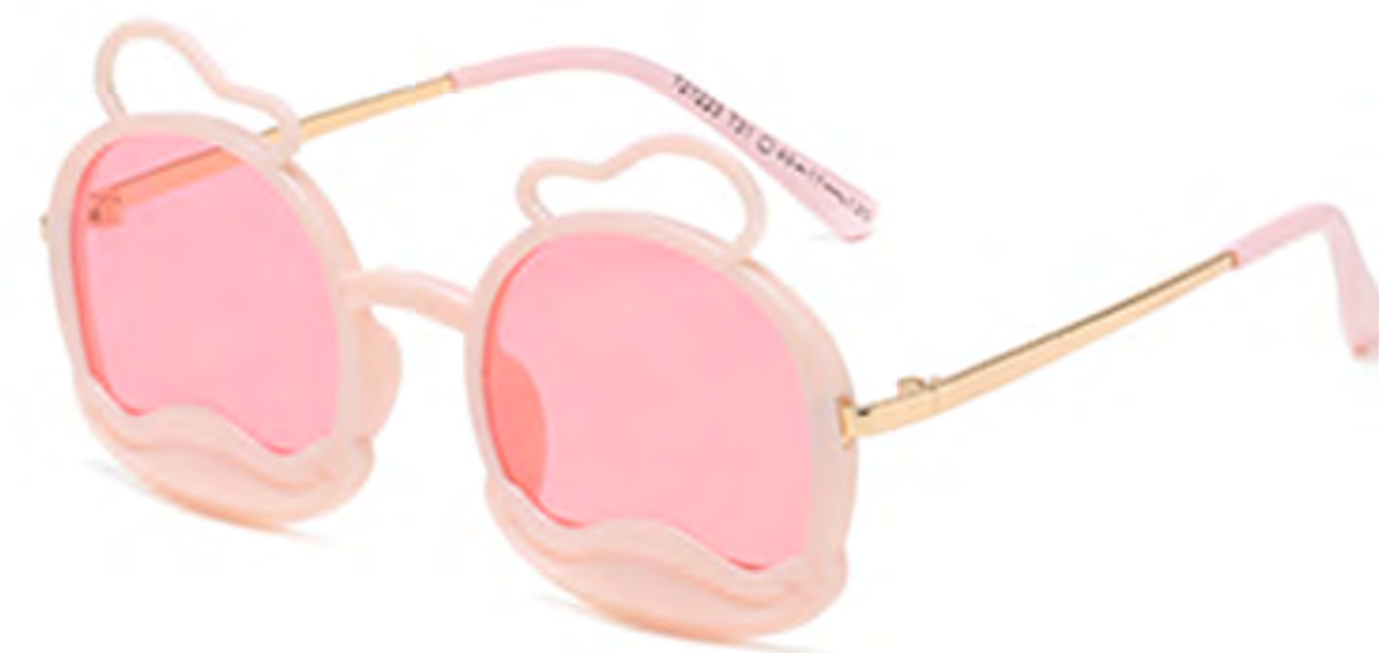
NO.3 T31 粉框粉片