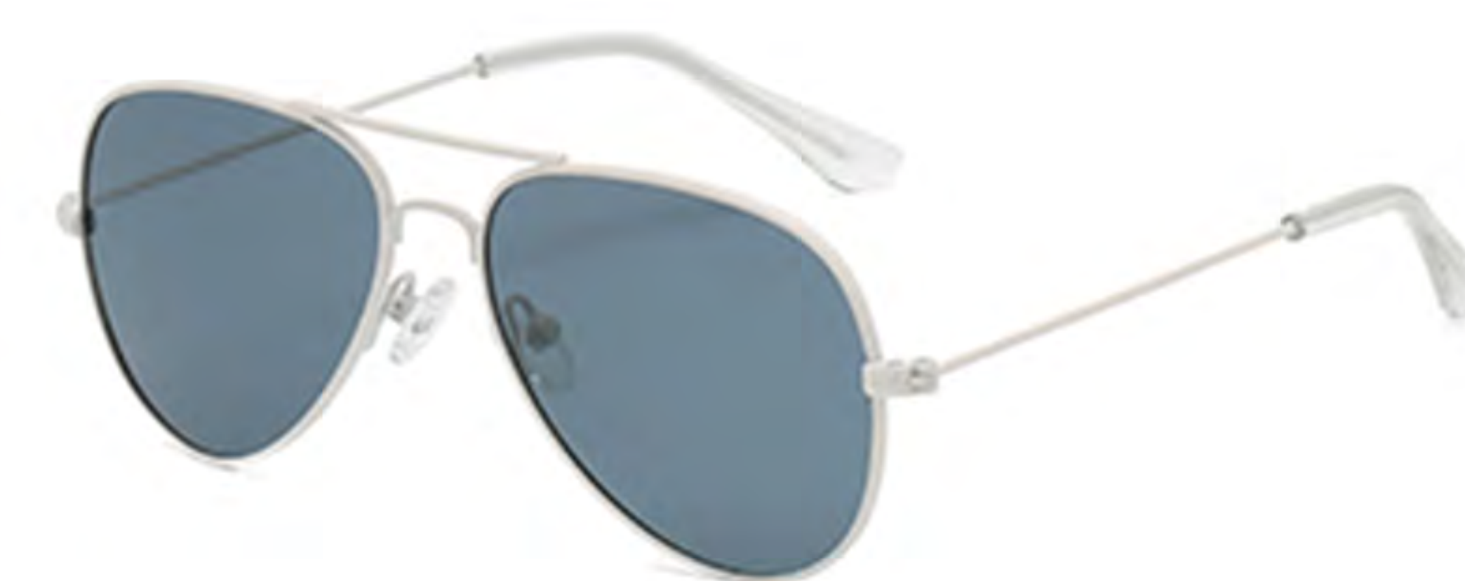
NO.4 T3 米白灰片