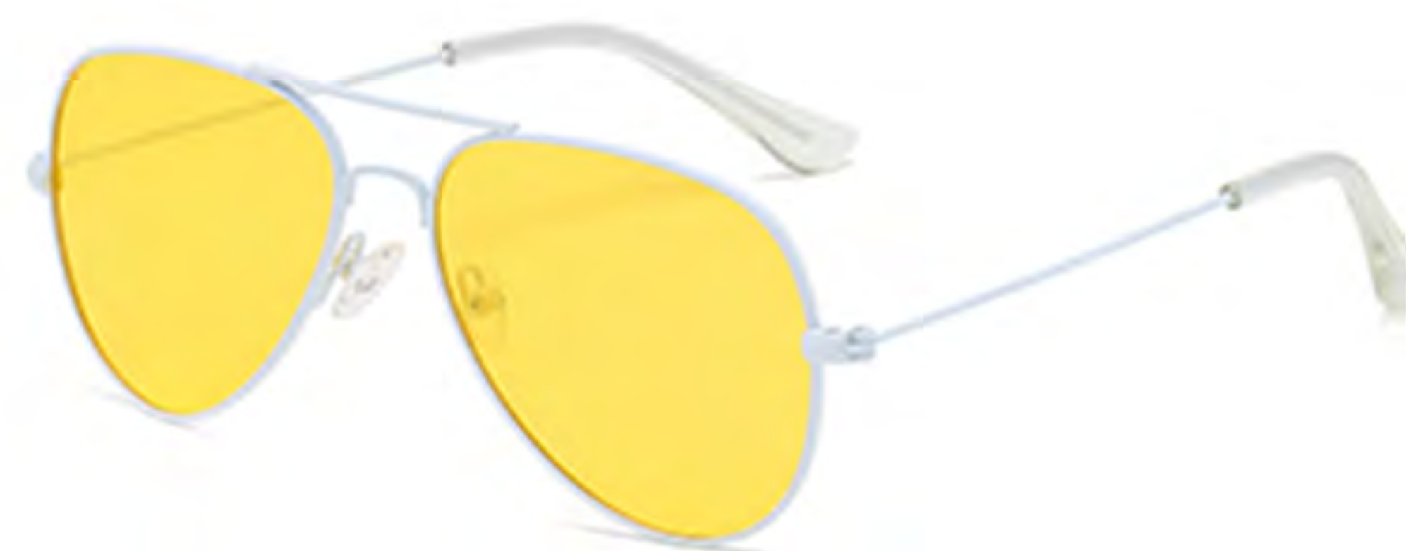
NO.3 T30 白框黄片