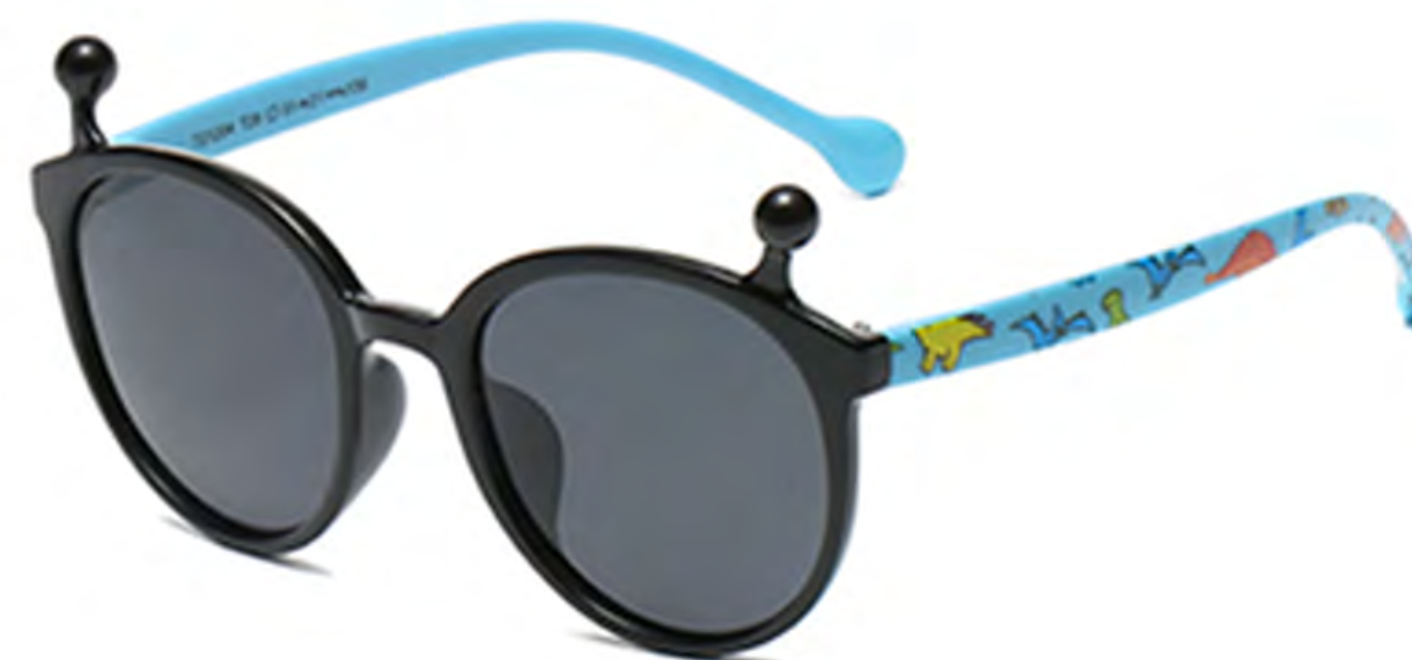
NO.1 T28 亮黑灰片