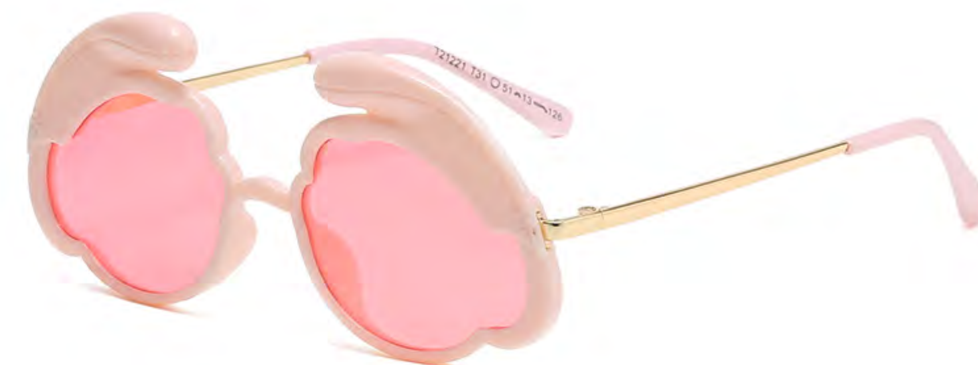
T31 NO.5 粉框粉片