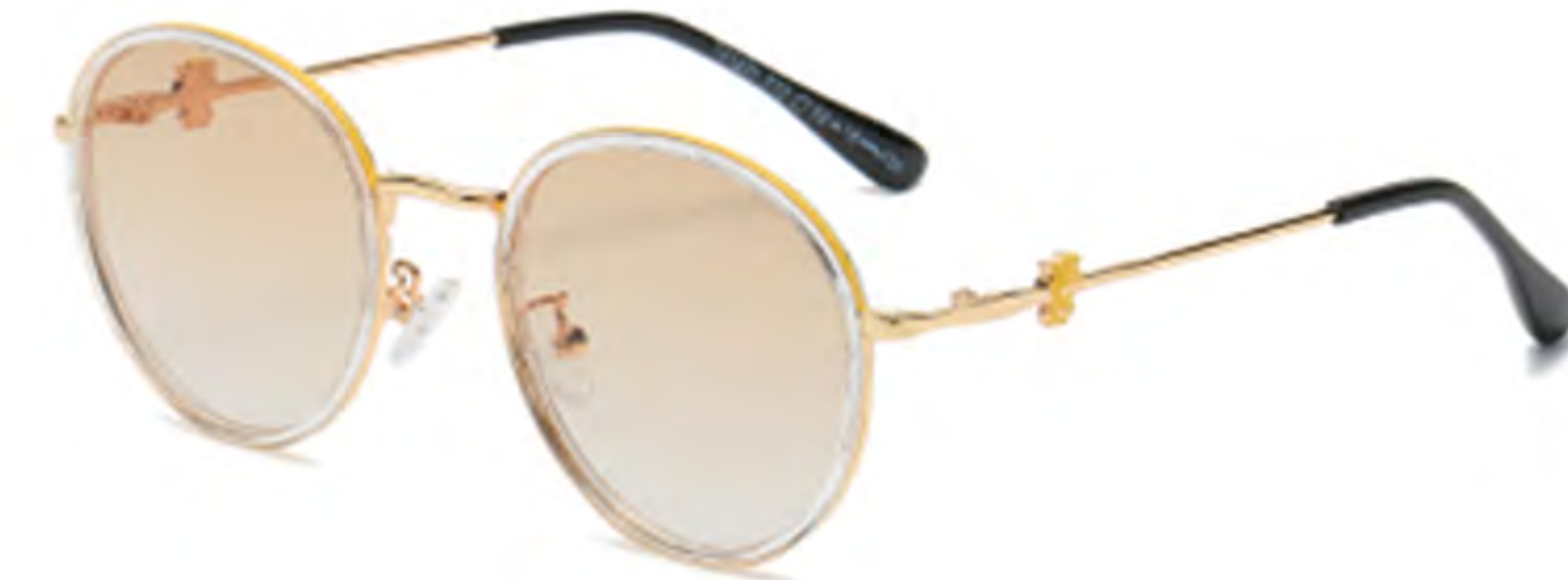
NO.2 T72 金框渐变茶