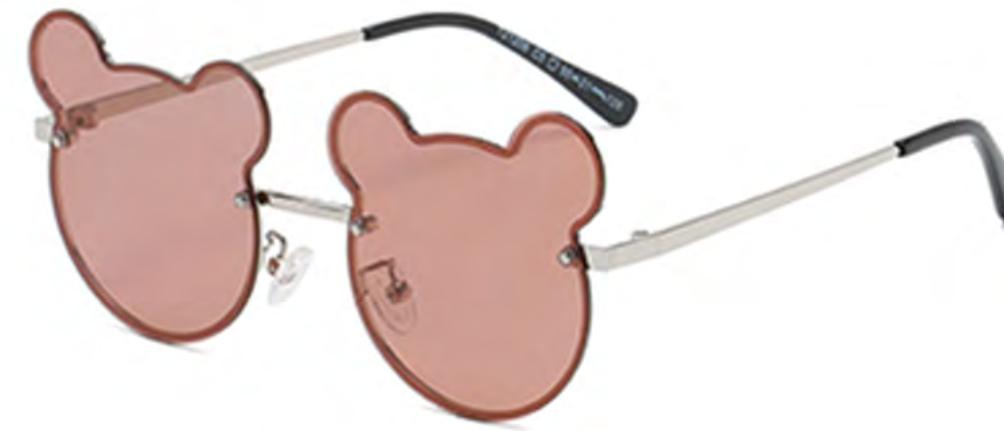
NO.5 C5 银框茶片