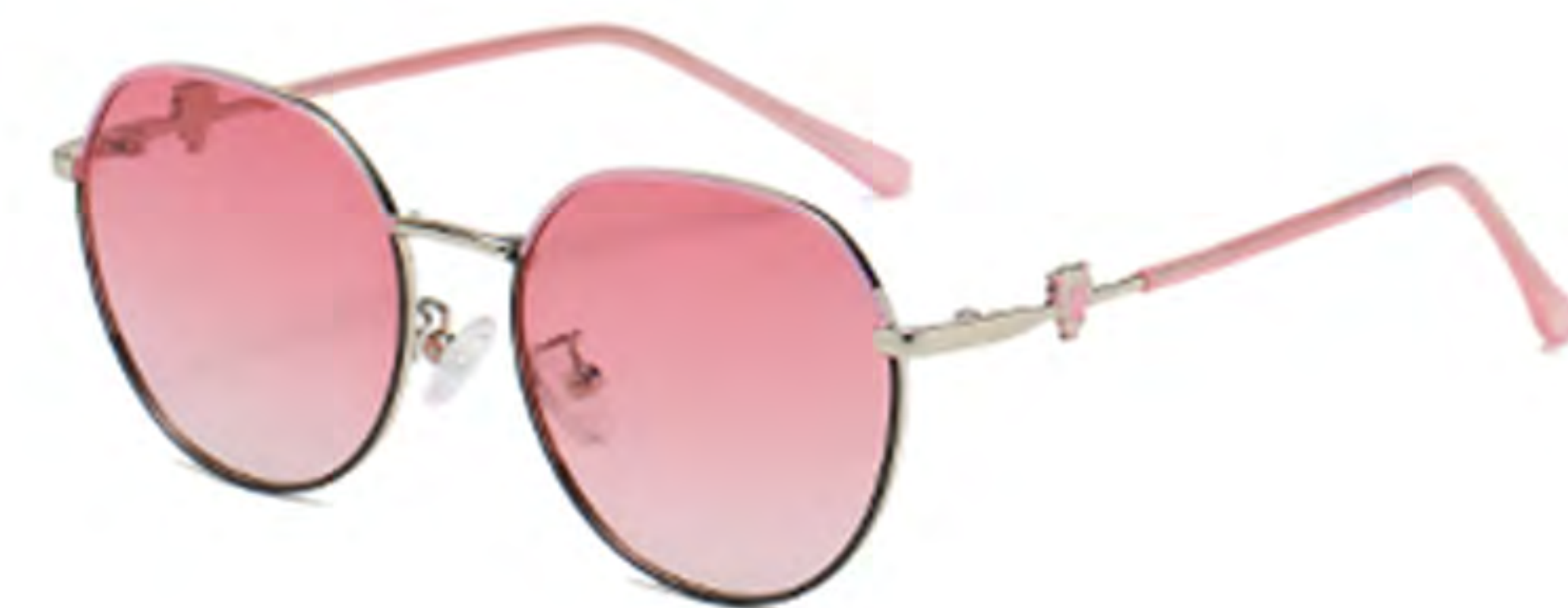
NO.2 T14 上粉下黑粉片