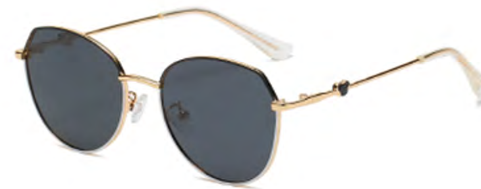
NO.1 T22 上黑下白灰片