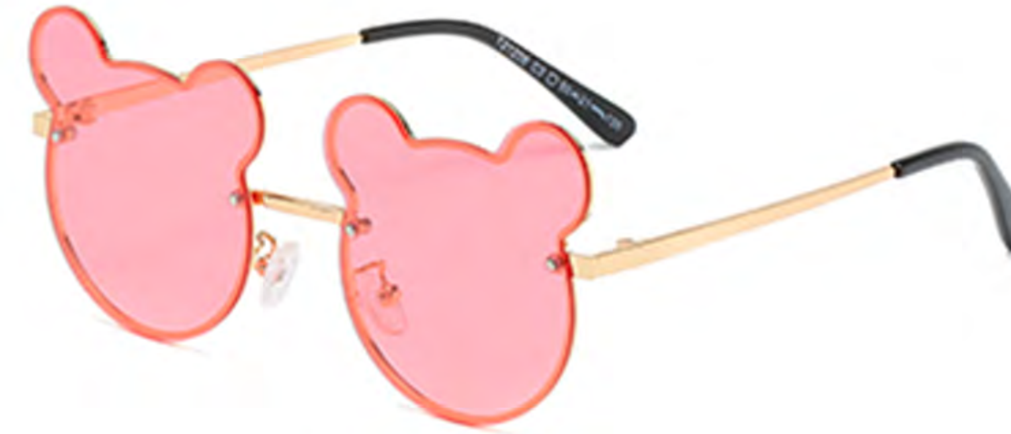
NO.3 C3 金框粉片