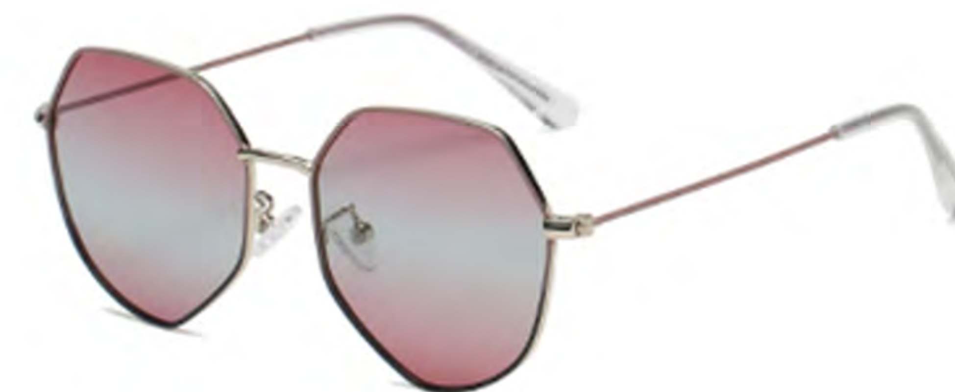
NO.2 T15 上紫下黑渐变紫